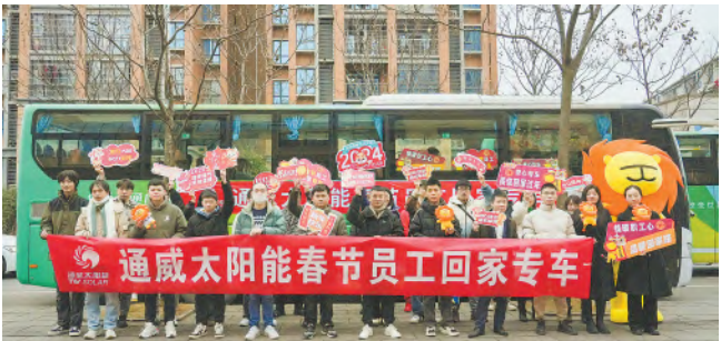
阳光仔欢送通威家人们回家