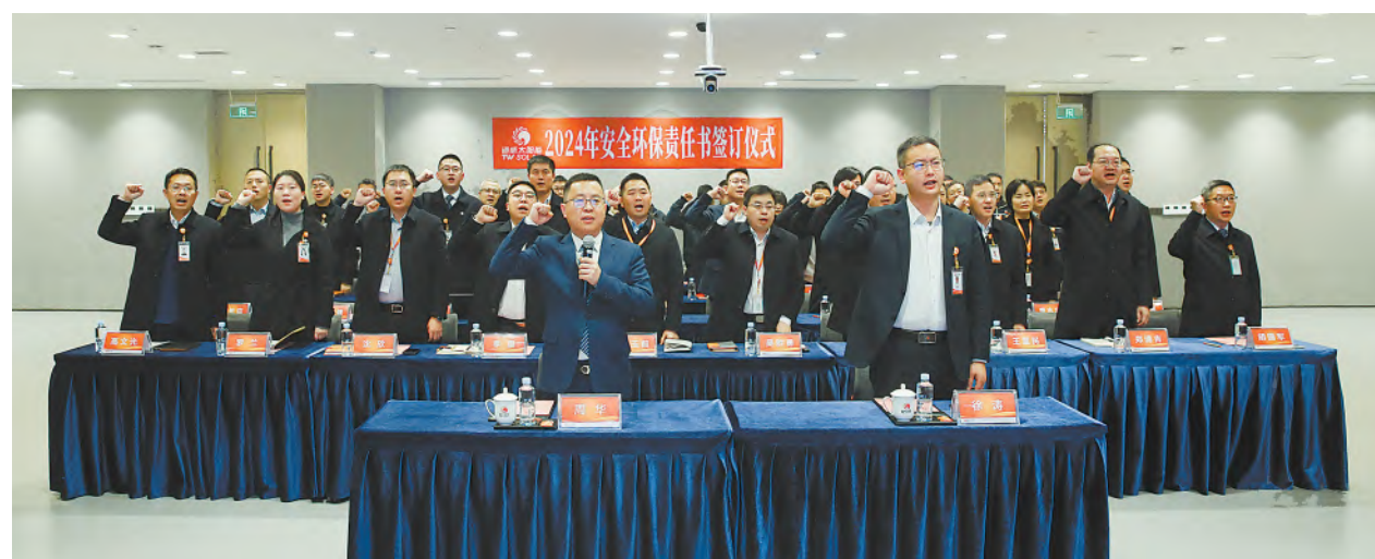
2024年安全环保责任书签订现场

通威太阳能将以此次合规性签署为契机，不断加强内部治理，优化环保与安全管理体系，确保企业的可持续发展与社会责任实现完美契合。在环保安全领域追求卓越的决心，为推动整个