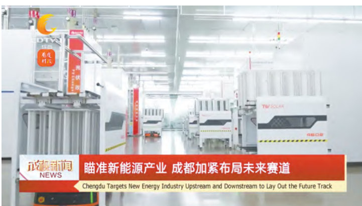
1月3日,成都广播电视台聚焦通威太阳能