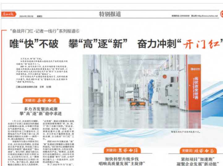
2月1日,《眉山日报》聚焦通威太阳能