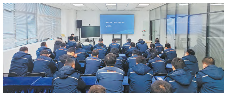
复工复产专项安全培训