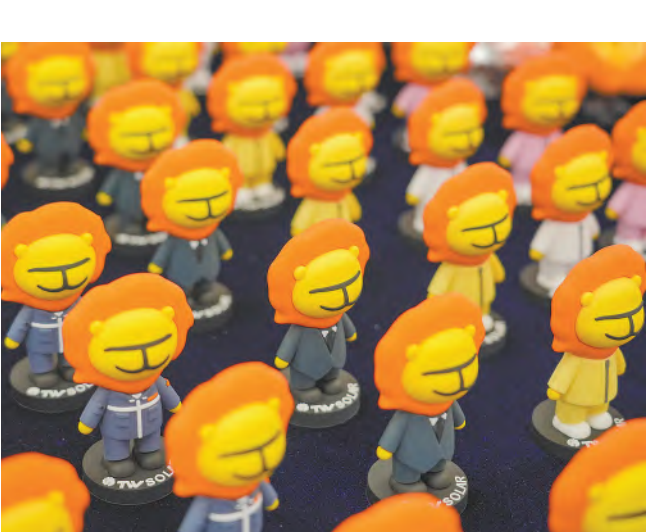
游园会阳光仔定制造型