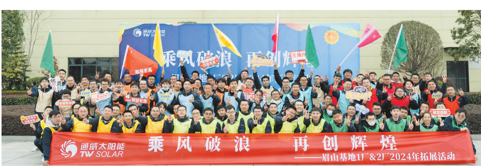
团队拓展,振奋龙马精神