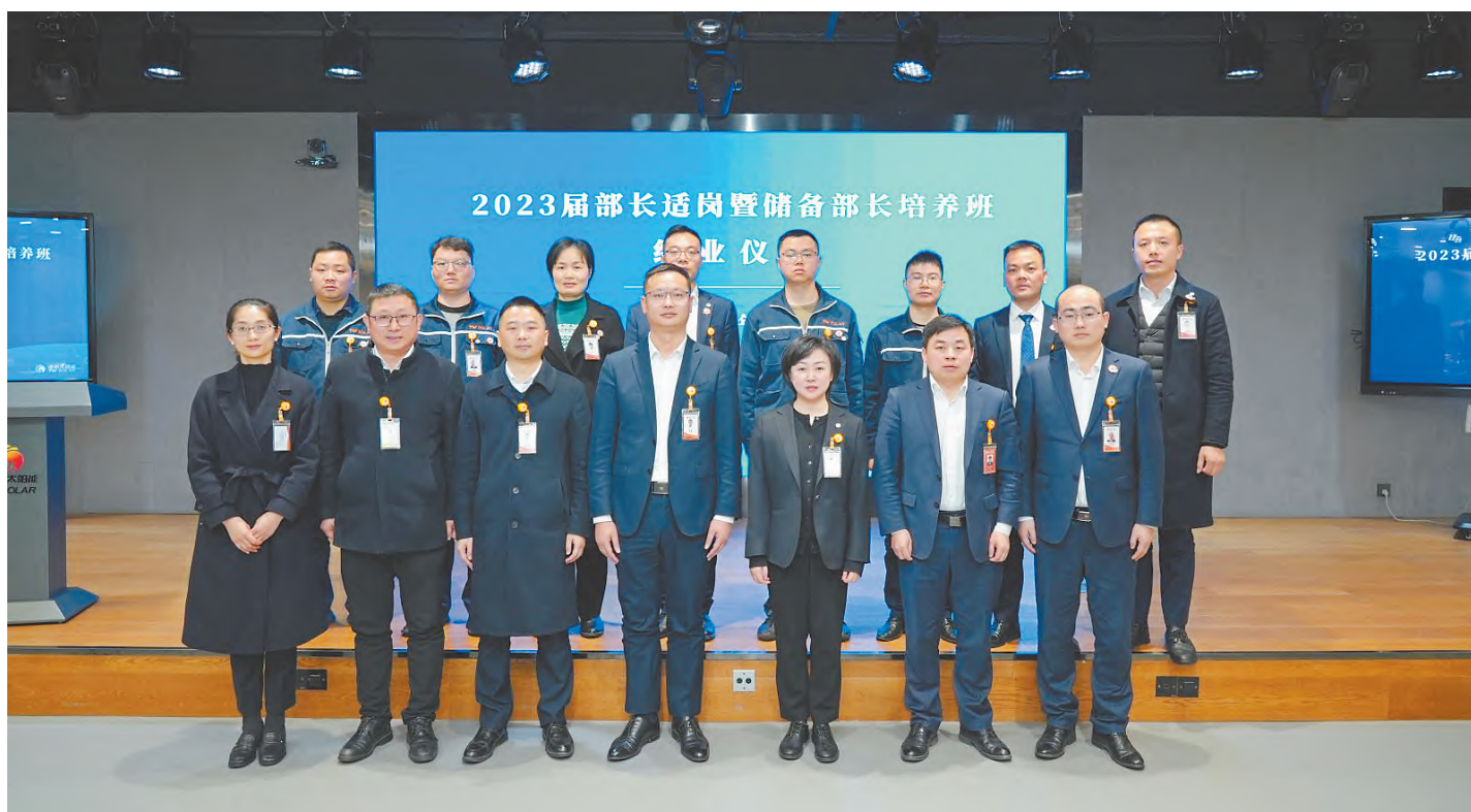
2023届中高管培养项目结业合影