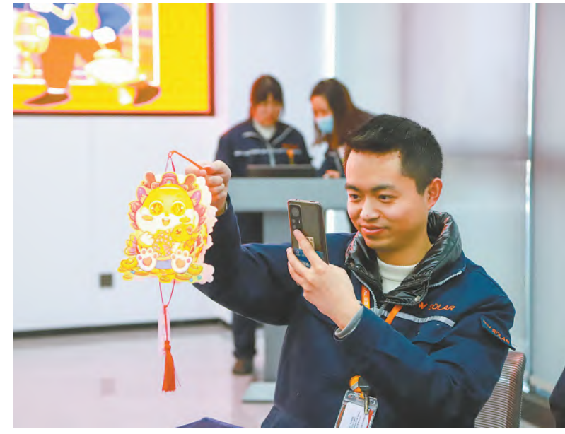
跟自己的DIY花灯合影