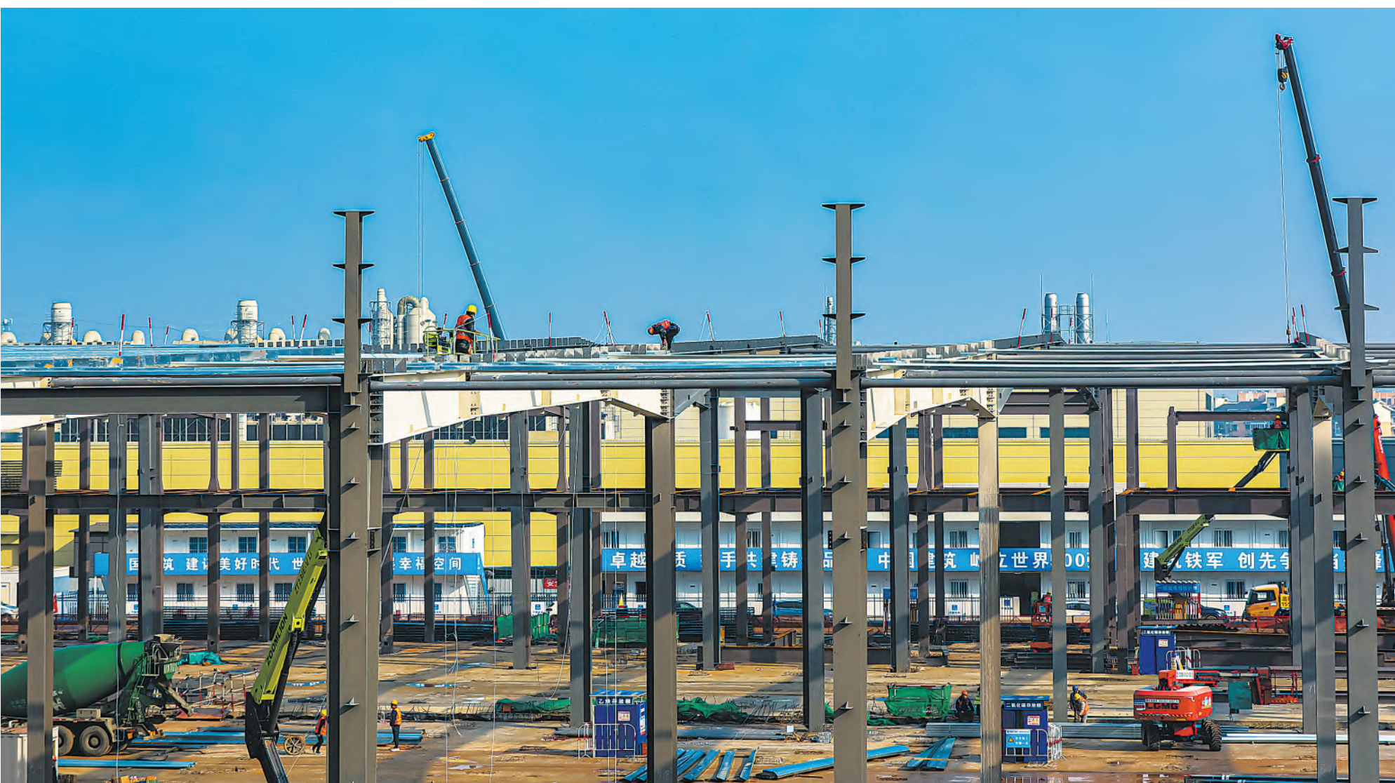
建设中的通威全球创新研发中心