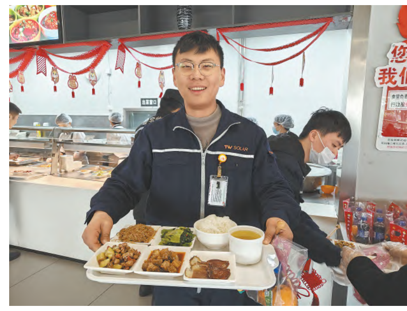
员工开心领取公司春节福利餐