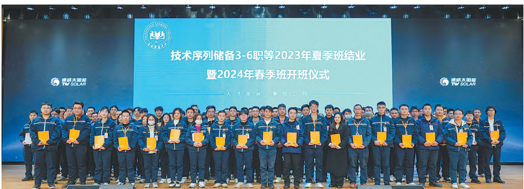
技术序列培养班赠书仪式合影

未来，通威太阳能人力资源部将针对各级领导对于五型班组建设要求，持续推动各厂部深化五型班组建设，共同为通威太阳能培养出一批优秀的“五型班组”管理团队，为公司高质量发展作出更大的贡献！