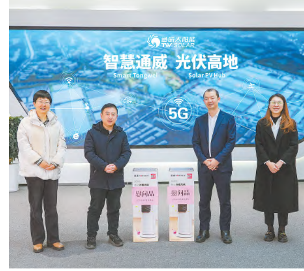
慰问金堂基地科技工作者代表