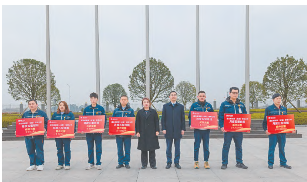
1月月度五型班组表彰

据悉，通威太阳能中高管人才培养项目自2019年启动以来，通过系统化的培育机制，持续培养输出管理干部100余人，已经成为公司培养干部人才的核心路径。未来，通威太阳能人力资源部将不断完善管理干部人才培养体系，着力打造一支享受奋斗、拥抱危机、防危重安的中高层管理团队，不遗余力地为公司发展提供充足的后备人才力量。