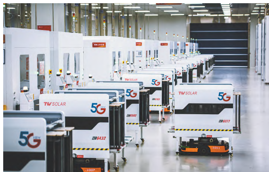
通威太阳能 5G 智能制造生产车间

通力合作,威力无穷。在全体通威同仁的共同努力下,通威太阳能眉山基地将继续抢抓成渝地区双城经济圈、成德眉资同城化发展的重大战略机遇,以“开年就开工,开工就开战,开战就决战”的实干姿态投入到生产建设当中,在生产、技术、项目等方面全面发力,再次跑出通威“加速度”凝聚光伏行业发展“新动能”。