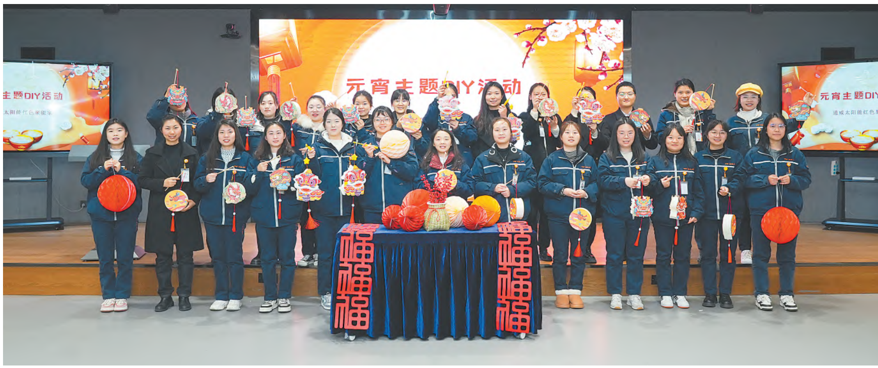
元宵节主题活动合影