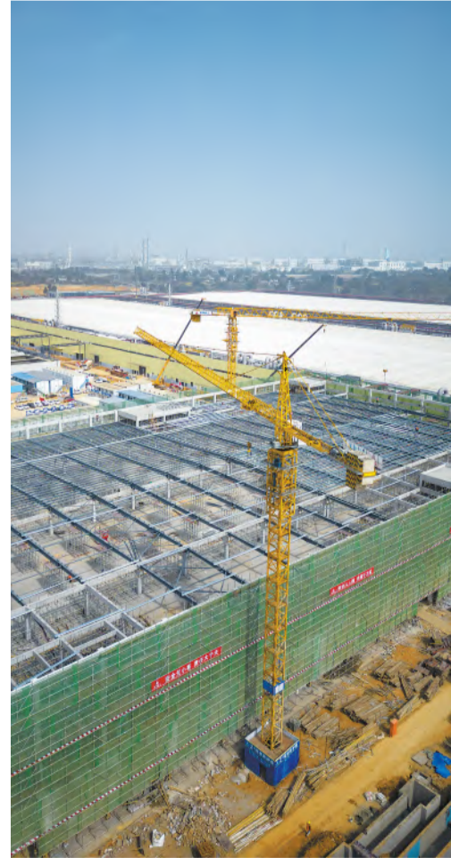
2024年2月,通威太阳能眉山基地四期项目进行结构封顶钢架搭建