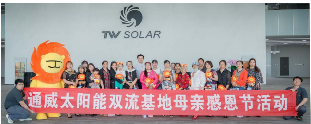
双流基地合影留念