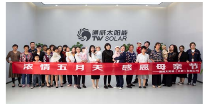
合肥基地合影留念

活动中,员工及其家属先后参观了A1展厅智能制造生产车间、“红色聚能家”党工阵地、员工食堂、健身房等区域,进一步了解了通威太阳能发展历程、行业地位及战略布局、企业文化建设、员工福利等基本情况。母亲们表示,通过这一次活动,