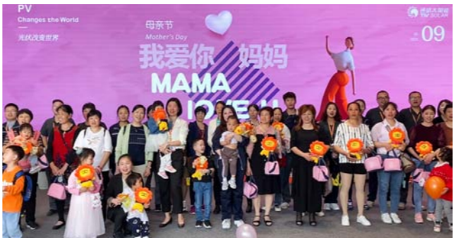
眉山基地合影留念

本报讯(通讯员 秦文 李慧 鲁二宝)为弘扬中华民族传统美德,提高员工素质,增强员工“孝道”意识,推动企业健康发展,5月8日,通威太阳能红色聚能家在母亲节来临之际,组织开展“浓情五月天·感恩母亲节”主题活动,来自合肥、双流、眉山基地的30余职工代表邀请其母亲、子女共计80余人参与活动。 本次活动首先通过线上平台发起倡议,号召员工参与活动,表达对母亲的感恩之情。报名成功的家庭由公司派专车接送至各基地,在各基地行政部工作人员的组织开展一系列活动。