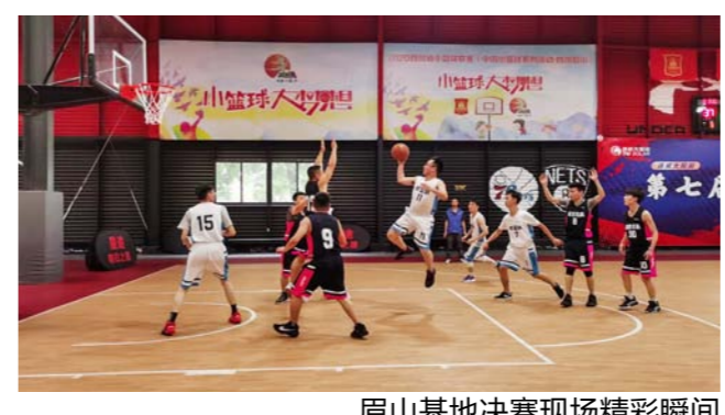
眉山基地决赛现场精彩瞬间