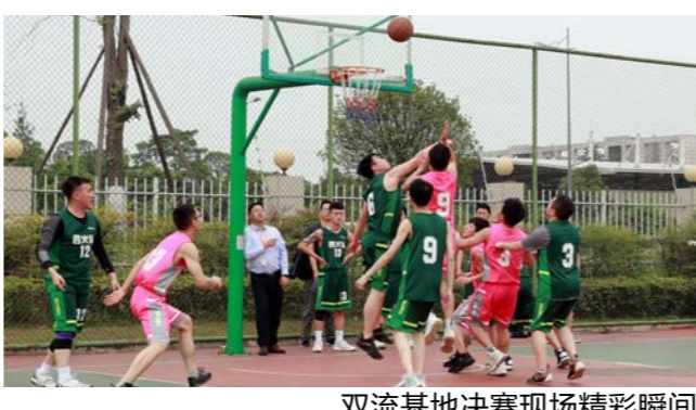
双流基地决赛现场精彩瞬间