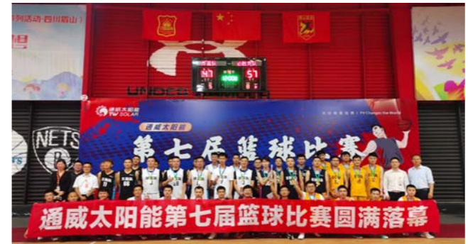
眉山基地合影留念

本报讯(通讯员 王守健 徐忠琴)5月20日,通威太阳能红色聚能家成功举办第七届篮球比赛圆满落幕。本届比赛历经初赛、半决赛和决赛三个阶段,共计30余场次的激烈比拼,诞生出各基地冠军季军队伍,并在当天决赛结束后举行颁奖仪式,通威太阳能各基地厂部负责人出席本次仪式并为获奖队伍颁奖。