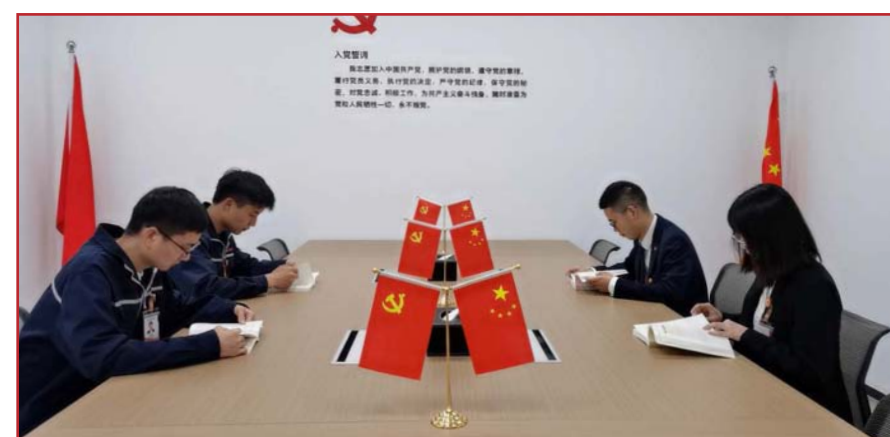
干净整洁的党工办公室

本报讯（通讯员 程鑫宇）4月20日，为更好服务公司员工，为员工切实感受“家”的温馨和温暖，通威太阳能眉山基地工会委员对党工区域硬件设施进行全面完善，建立规划“党工工作阵地”“母婴室”“医疗室”“劳动争议调解室”“心灵驿站”“休闲吧”“读书吧”“职工健身中心”等功能区域，全方位关爱职工，筑建温暖职工之家。总体项目面积约2000平米，由专人负责运行维护，一上线就圈粉无数，项目各个板块不仅丰富了员工业余生活，也使得员工在工作之余及时得到放松减压，受到员工一致好评。