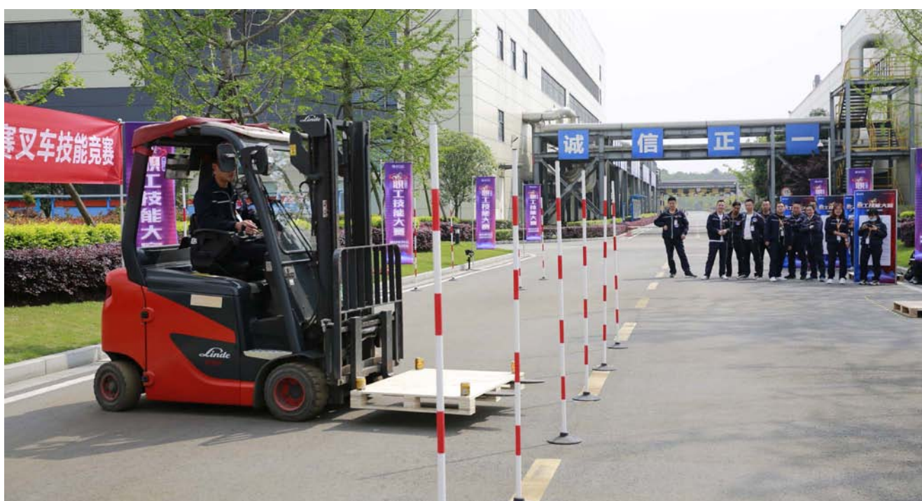
叉车技能竞赛现场