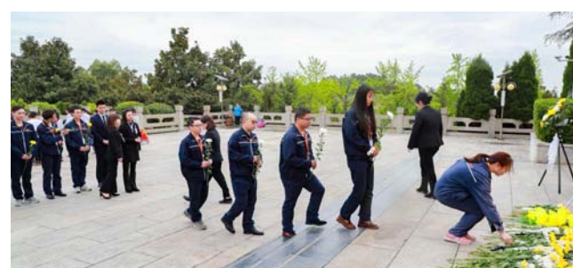
党员们为烈士敬献鲜花