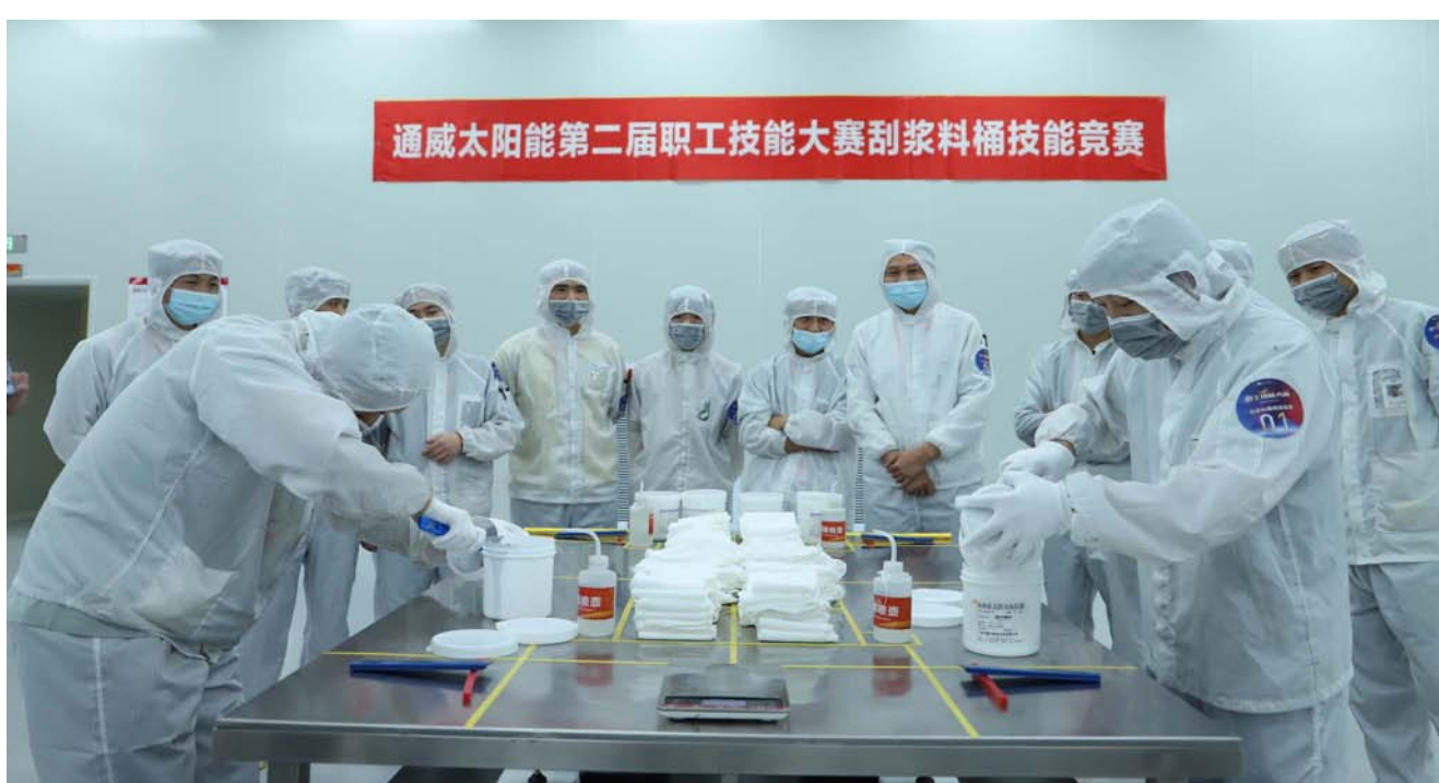
刮浆料桶技能竞赛现场

本报讯（通讯员 程良 张涛 徐志琴）人间四月，万物复苏。4月8日-4月15日，通威太阳能为期一周的第二届职工技能大赛成功举办，本次比赛以“赛技能亮点，展岗位风采”为主题，合肥、双流、眉山三地共计250余名选手积极报名参加，经过叉车、刮浆料桶、电工、电池片检验、消防共五个技能项目的激烈角逐，最终产生了单项冠军、亚军和季军各五名。