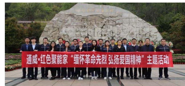
合肥基地合影留念