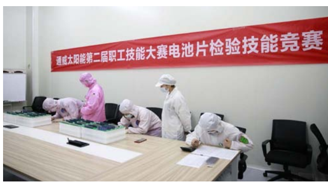
电池片检验技能竞赛现场