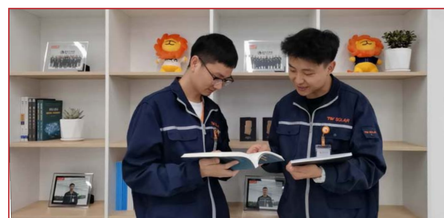
员工挑选自己喜爱的书籍阅读品研