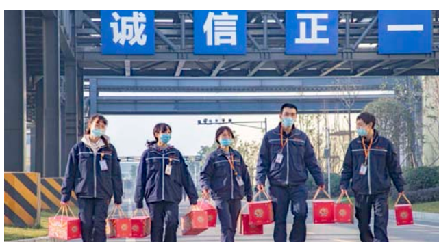
员工领取福利礼包