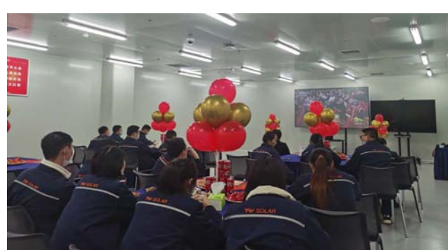
员工们集中看春晚

丰富的福利、可口的餐食、有趣的活动、聚在一起就是“年”,心在一起就“团圆”。“就地过年”是通威太阳能响应政府留在原地过年的倡议,也是自己在这个特别的“春节”能够为家为国所力所能及的“小事”。而对于通威太阳能而言,员工福利是企业文化建设的重要一环,提升员工幸福感和归属感是公司稳定发展、长远发展的“大事”。