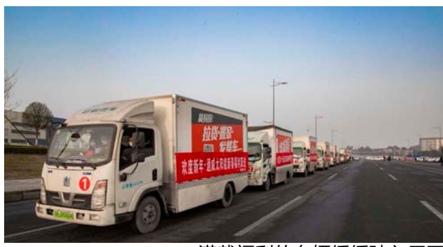
满载福利的车辆缓缓驶入厂区