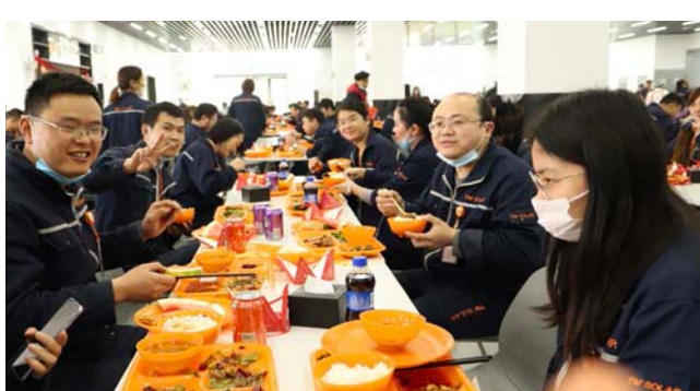
员工们的幸福“年夜饭”

春晚不仅仅是一台晚会,更是中国人关于“年”的特殊情怀,有春晚才有年味。为给留守员工们的这一份年味,带给留守