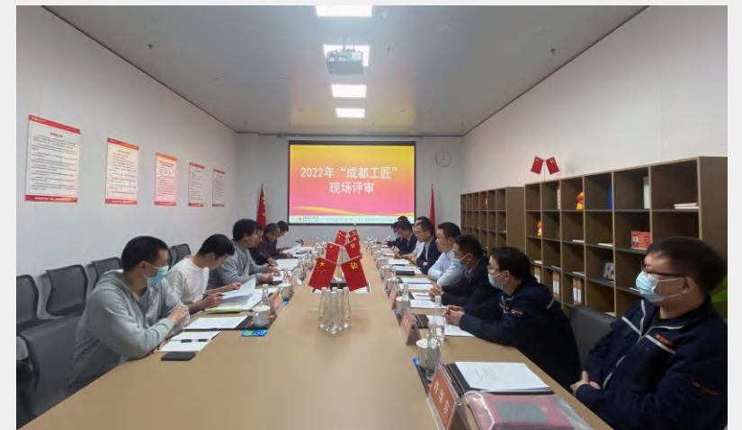
金堂基地评审现场

在今后工作中，红色聚能家将继续大力弘扬劳模精神、劳动精神、工匠精神，着力构建规模结构与产业发展相适应的高素质技能人才队伍，助推公司高质量发展。