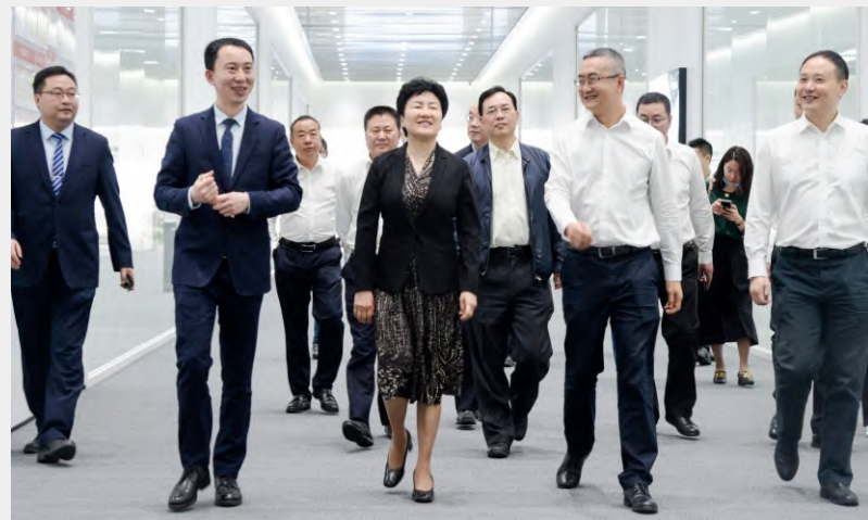
调研组一行参观通威太阳能金堂基地智能制造车间