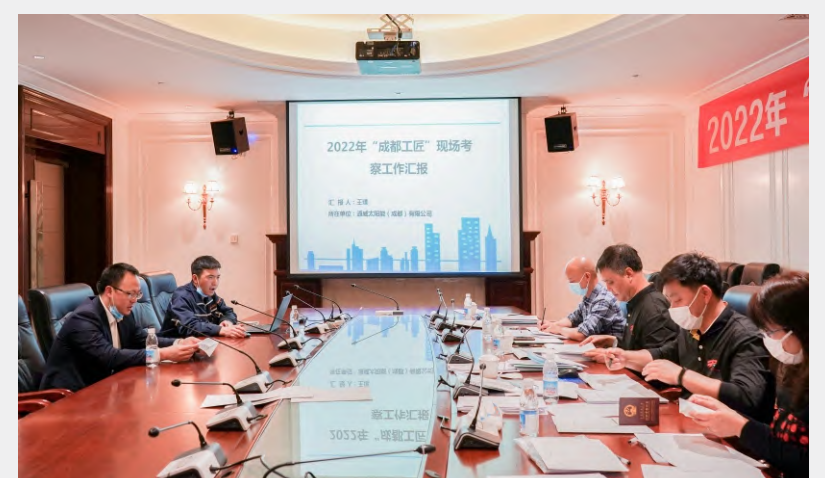
双流基地评审现场