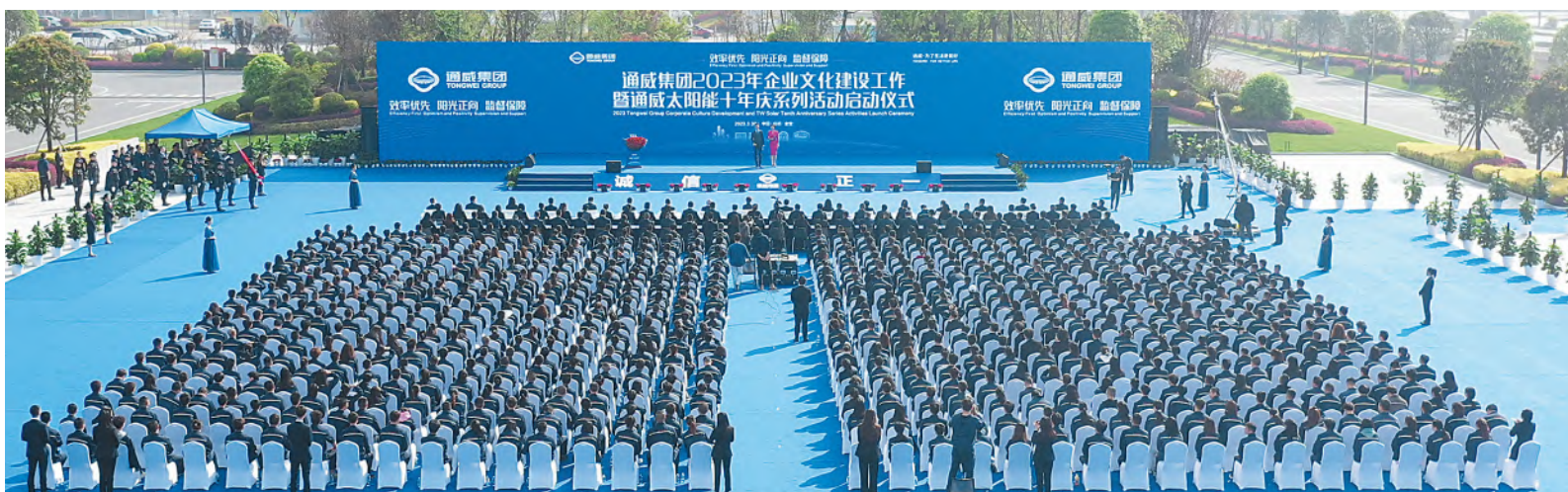
通威集团 2023 年企业文化建设工作暨通威太阳能十年庆系列活动启动仪式在金堂基地隆重举行