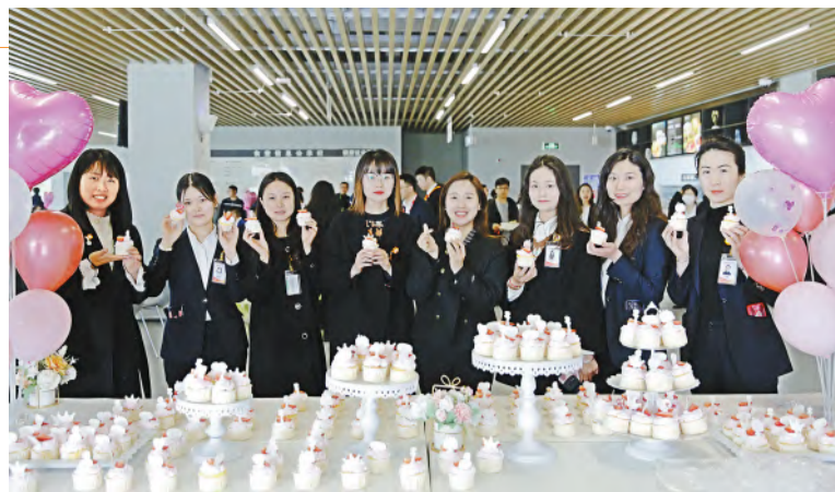
女员工们点赞暖心节日活动

“企业文化不是空中楼阁、不是做表面工程,它从平常的每件事、每句话、每个行为中得以体现,是员工不经意的思考与行为,并植根于每个人的内心。它真正赋予了企业持久发展的方向、奋勇前行的目标、待人行事的作风和创造财富的意义。”在十年发展历程中,通威太阳能始终积极践行通威企业文化,以文化人,以文感人,以文育人。3月,贯彻集团要求,通威太阳能全面启动2023年企业文化建设工作,开启企业文化建设新篇章;在“三八”国际妇女节当天,通威太阳能相继开展系列关爱活动,为广大女性职工送去最贴心的问候与祝福;为关爱员工身心健康,通威太阳能开展2023年第一季度“一盒牛奶”的关爱行动和“关注呼吸 主动健康”主题讲座、心理健康讲座,关爱员工身体健康,提高员工的健康意识。