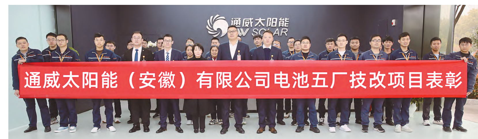
安徽公司开展技改表彰活动