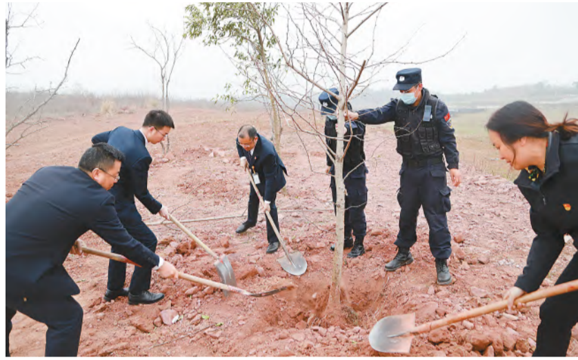
环保月植树活动现场

通威太阳能始终坚持走可持续发展道路,长期致力于打造花园式绿色工厂。草色柳芽新,复耘待后人。本次植树节不仅让大家体会“十年树木,百年树人”的深刻含义,也鼓励通威人为公司稳定健康的不断发展踔厉奋进,更是通威