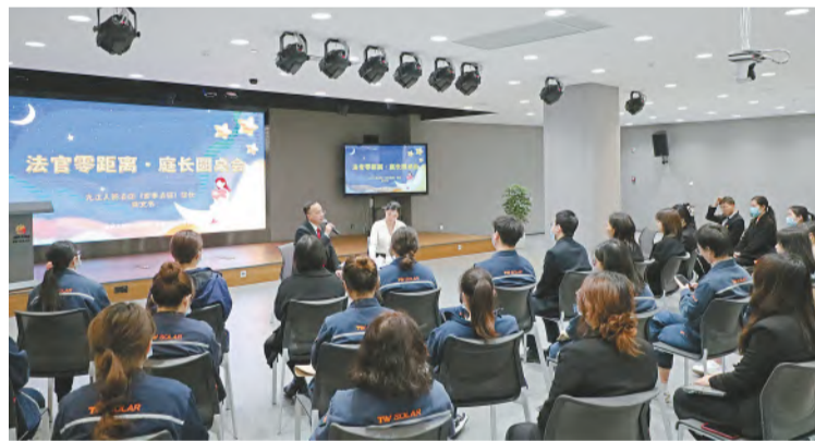
心理健康培训现场,专家答疑解惑