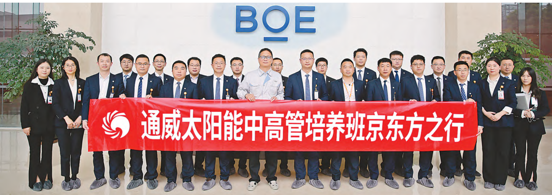
通威太阳能中高管培养班走进京东方参观交流