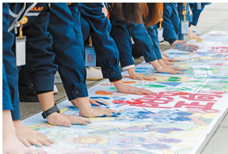
员工们在长卷上郑重按下手印