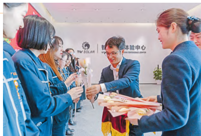
各基地负责人为女员工送上节日福利