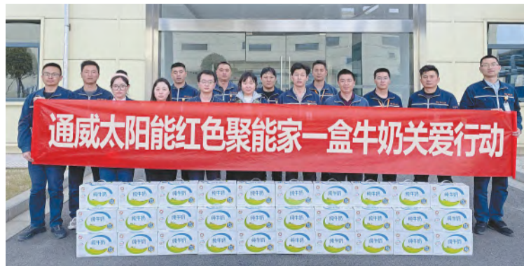
“一盒牛奶关爱行动”合影留念