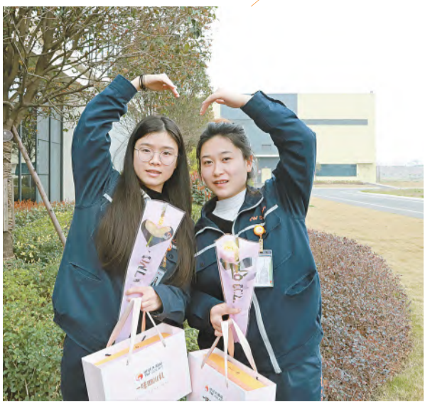
员工为公司暖心举措点赞