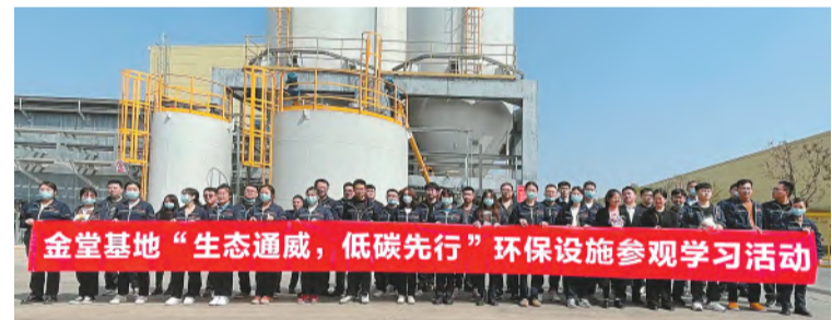
参观学习厂区环保设施

随着“除草护园”行动圆满收官,“蚂蚁森林合种”活动将有序开展,此活动以全员参与,全员协作为主旨,以互联网为平台,倡导员工全面参与植树造林行动。通威太阳能高度重视可持续发展,将企业发展与国家期望、社会需要紧密结合,强化全生命周期的环境管理,严守环境“红线”,以实际行动践行环保理念,推动生态文明建设不断发展。