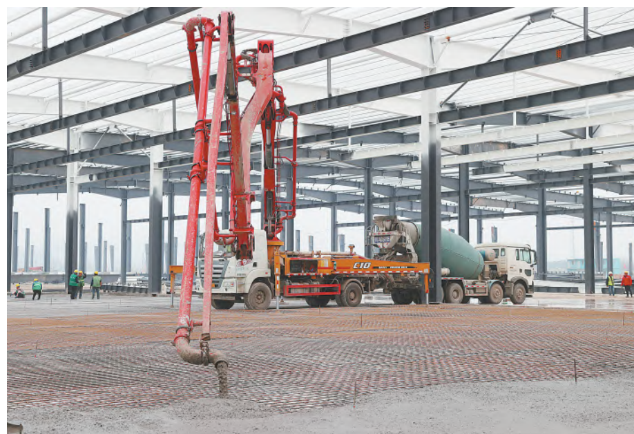
通威太阳能彭山基地建设现场

通威太阳能彭山基地生产车间将采用TOPCon技术路线,高转换效率将持续引领行业发展,为全球绿色发展和能源转型积极贡献通威力量。随着年内彭山项目建成投产,公司产能将超80GW,产能规模始终全球领先,持续夯实全球电池片环节龙头地位。