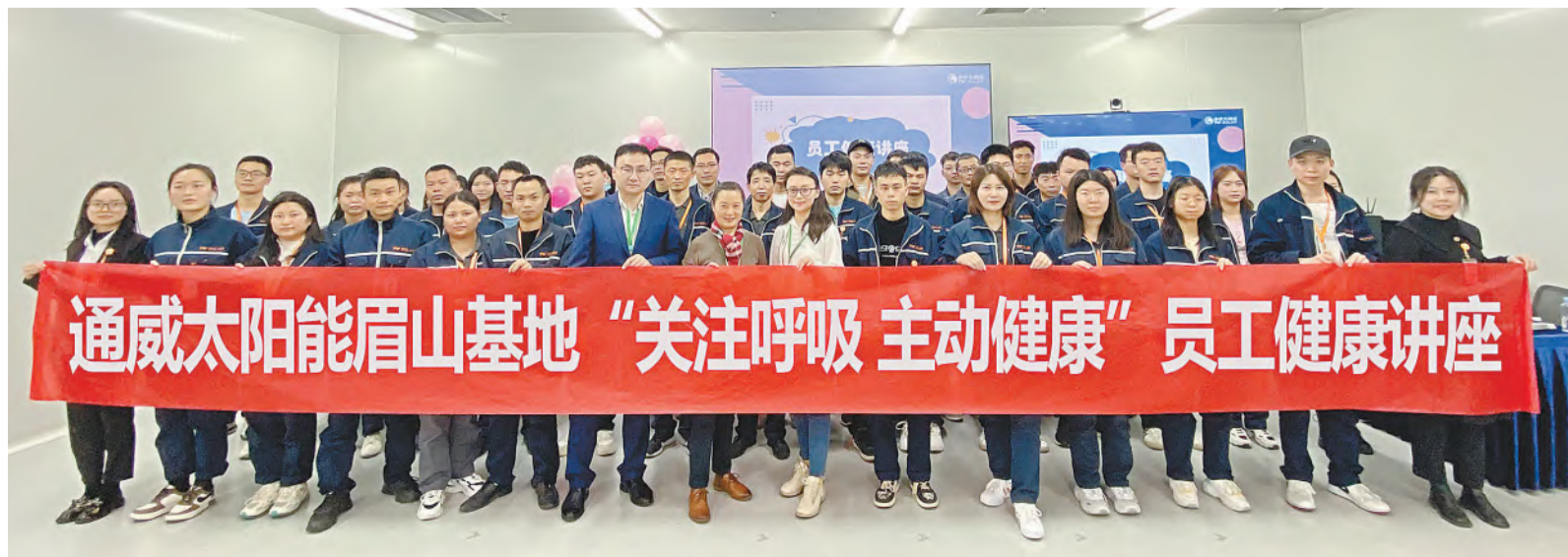
“关注呼吸 主动健康”主题讲座合影留念