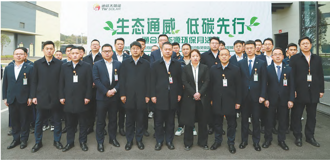
2023年环保月启动仪式现场