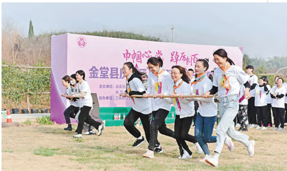
金堂基地荣获金堂县2023年“三八”妇女节趣味运动会第一名

心理健康培训内容涵盖重视员工心理问题和如何识别员工心理问题两个方面。专家指出,在企业管理过程中,员工心理问题是一项需要特别关注的问题。许多员工因为压力、疲劳、工作不畅等原因,常常会产生各种心理问题。如果这些问题得不到及时有效地解决,将会对员工的工作积极性和工作效率产生负面影响,甚至对员工的身心健康或者企业产生不可逆的损害。