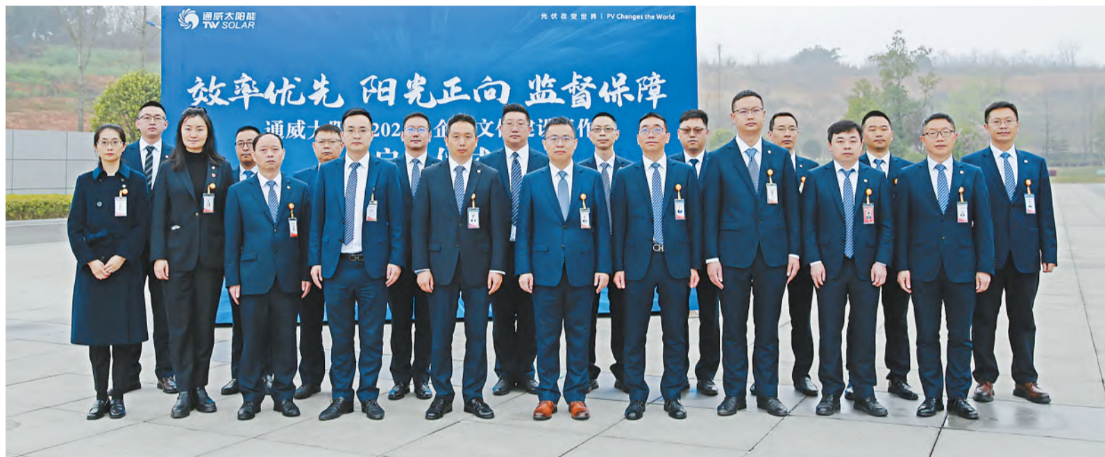
通威太阳能举行2023年企业文化建设工作启动仪式