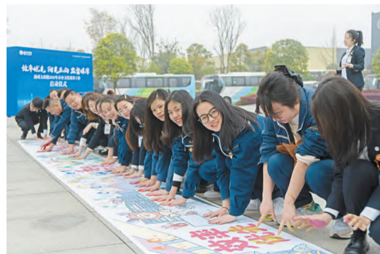
员工们在文化主题画卷上彩泥