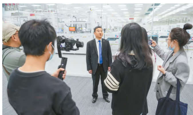
新华社等十余家权威媒体聚焦通威太阳能