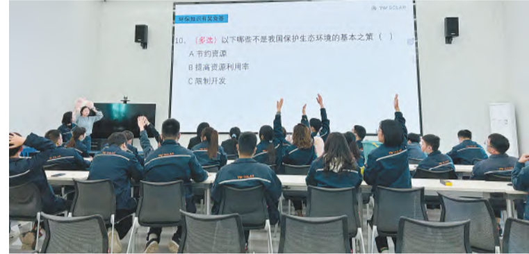
员工踊跃抢答环保知识

保护环境是企业的责任,通威太阳能一直努力践行“打造世界级的清洁能源企业,让太阳能造福人类”的企业愿景,用专业、严谨的态度开展各项环保工作,实现安全环保零事故,保护国家的绿水青山。