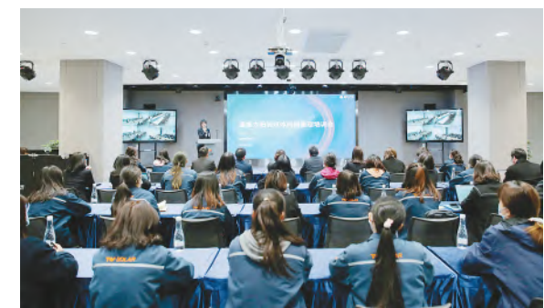
通威太阳能开展媒体舆情管理培训

未来,通威太阳能将持续优化媒体和舆情管理细则,继续加强媒体和舆情工作管理,不断强化全员危机管理意识,切实在通威集团及股份的指导下做好通威太阳能品牌宣传工作,助推公司高质量发展。