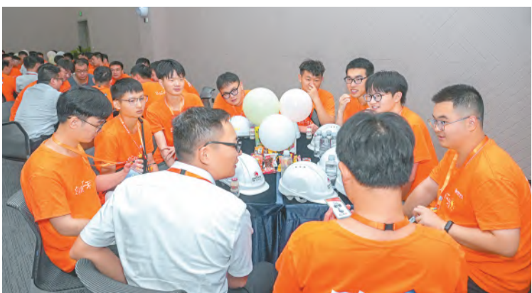
基地启航生欢迎会