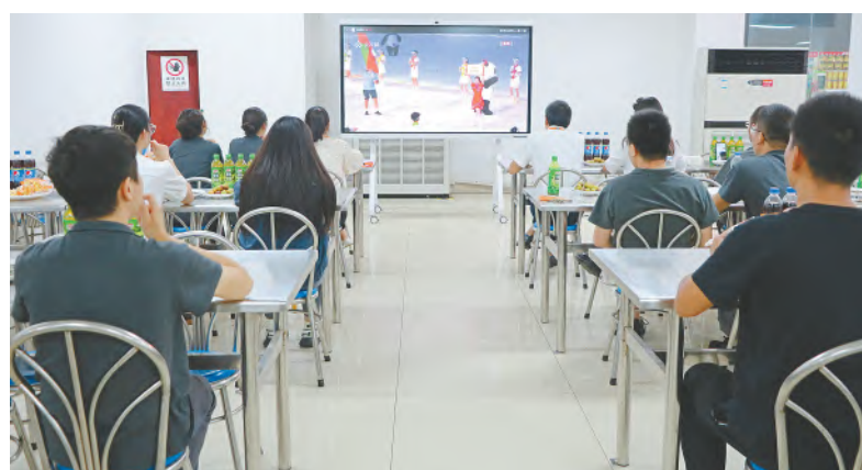
观看大运会开幕式直播