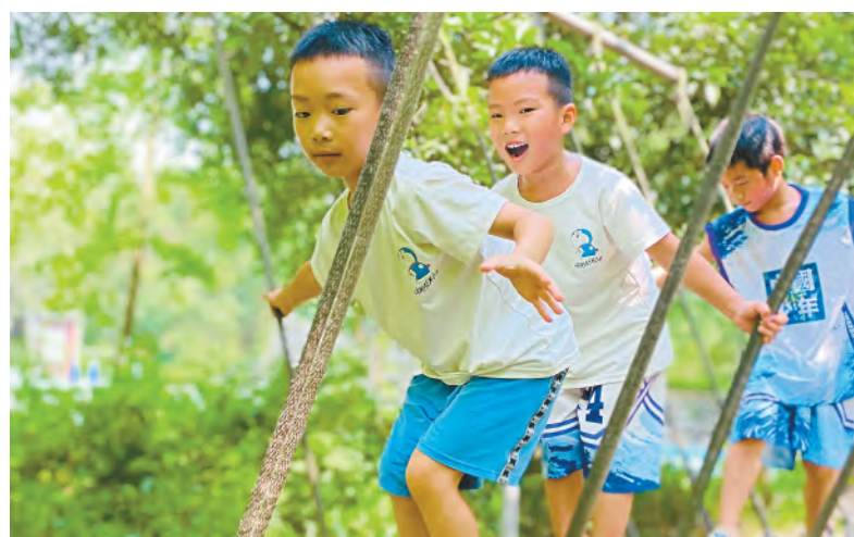
家庭亲子主题活动