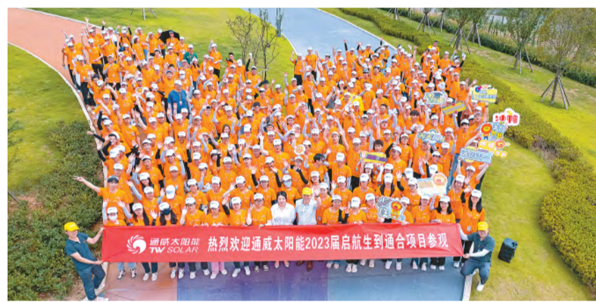
赴各基地参观交流