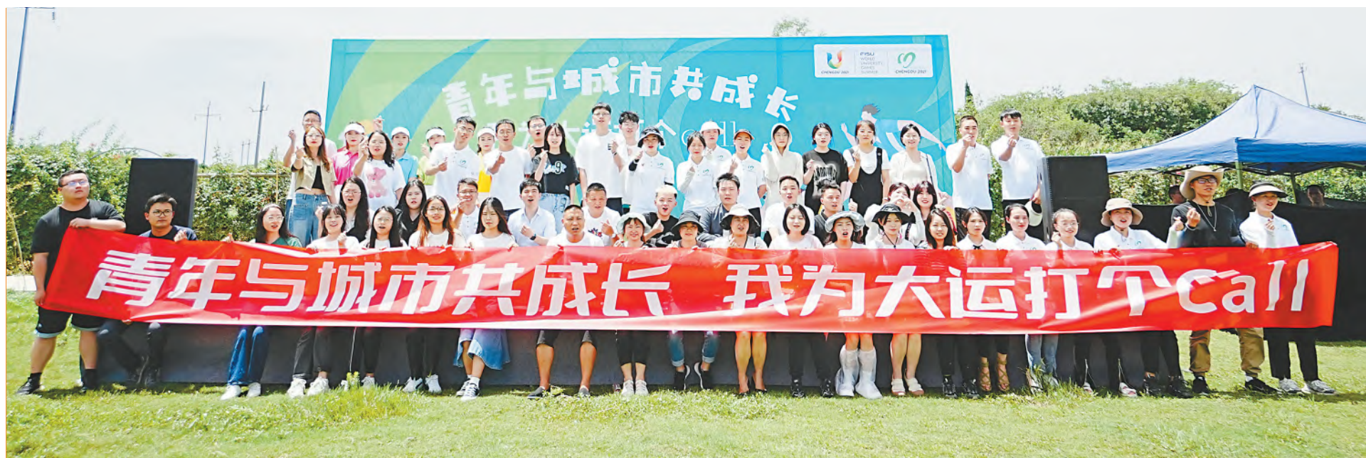
参加大运会主题活动