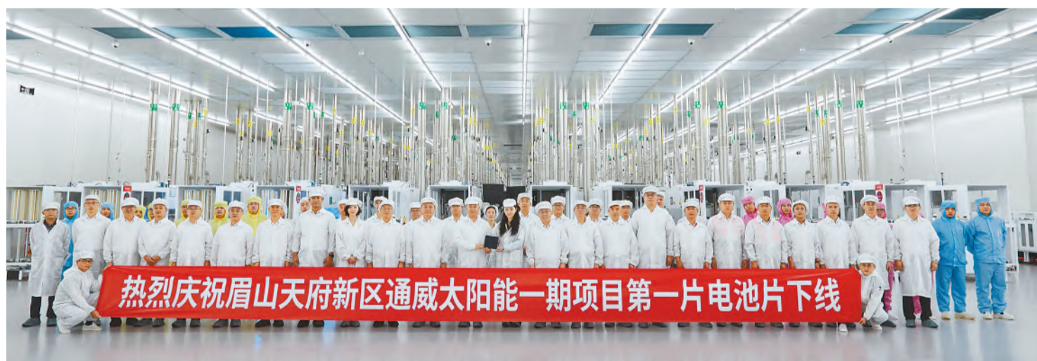
通威太阳能彭山基地一期项目第一片电池片下线

通威太阳能(电池)彭山基地一期高效晶硅电池项目第一片电池片的顺利下线充分体现了通威太阳能在技术革新、品质追求、规模突破等方面的超强劲驱动力,是通威深耕绿色发展实力和提升智能制造水平的又一里程碑。作为全省新能源产业的支撑性项目和眉山天府新区首个“双百亿”项目,通威太阳能(电池)彭山基地将站在新起点,勇担新使命,踔厉奋发,不断夯实全球最大晶硅电池企业龙头地位,为构建清洁低碳、安全高效的能源体系提供坚强保障,为推动全球新能源产业的发展作出更大的贡献。