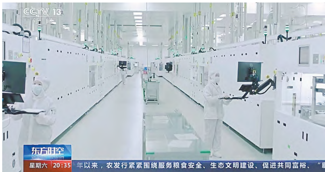
7月15日,央视《东方时空》播出通威太阳能画面