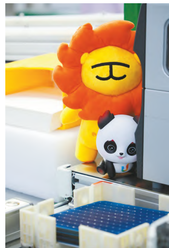
“蓉宝”了解电池片生产过程