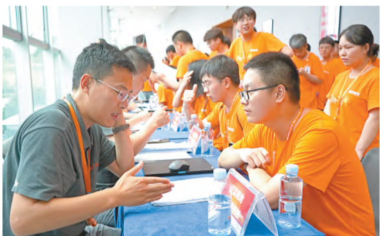
双选会现场,解读岗位职责