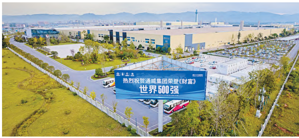
通威太阳能各厂区热烈祝贺通威集团荣登《财富》世界500强