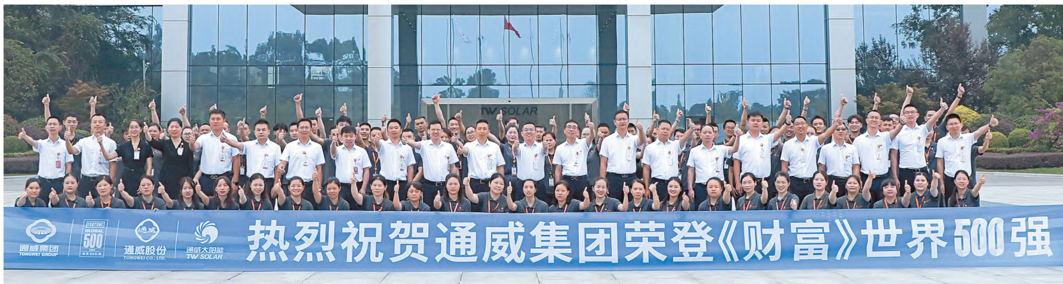
通威太阳能热烈祝贺通威集团荣登《财富》世界500强榜单

如今,我国制造业取得了突飞猛进的进展,从最初的代工生产到现在的自主品牌研发,越来越多的企业正实现从“制造”向“智造”的转变。为积极推动四川“制造”向“智造”转变,通威太阳能在金堂积极打造全球光伏行业首家5G应用基地。通威太阳能以金堂项目为试点,积极开展5G在工业互联网领域的应用,打造金堂项目成为5G+先进制造业典范,并依托通威工业制造场景推进以高效电池无人智能制造路线为主,建设智能化工厂、数字化车间、物流仓储及相关配套设施,积极打造千亿级清洁能源制造基地。