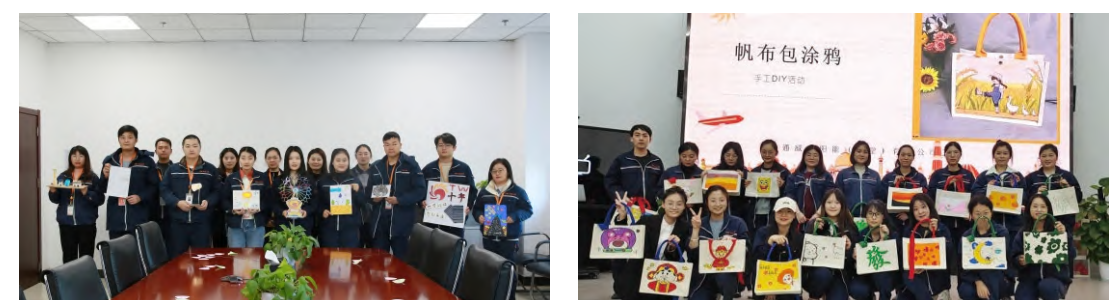
安徽公司参赛选手合影留念