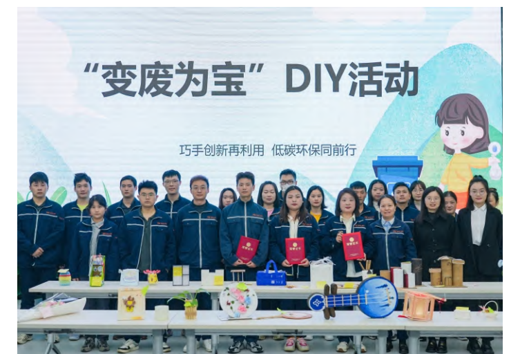
“变废为宝”活动合影留念

为弘扬传播绿色低碳环保理念，帮助大家树立合理利用资源、变废为宝的环保意识，同时培养创新能力，丰富员工精神文化生活，11月10日，通威太阳能金堂基地工会组织开展了一场以“巧手创新再利用，低碳环保同行”为主题的“变废为宝”手工制作评选活动。