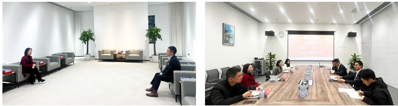
岳主席和姚书记座谈交流