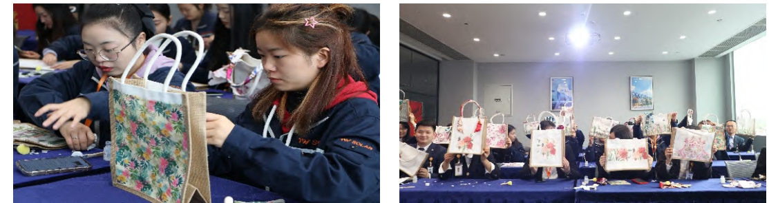
双流基地员工代表认真DIY

11月16日，通威太阳能双流基地工会组织开展一场别开生面的蝶骨巴特帆布包DIY活动。