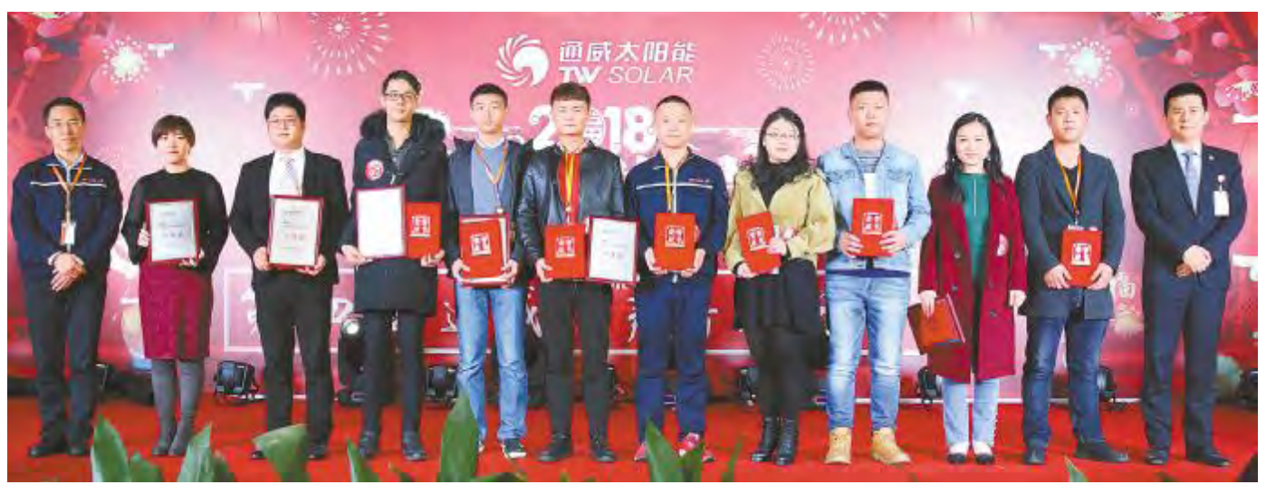
合肥公司参赛选手合影