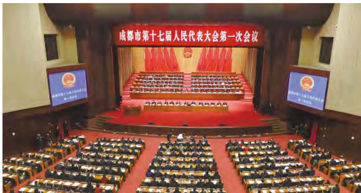
2月25日,成都市第十七届人民代表大会第一次会议开幕

除此之外,成都市政府也将通威太阳能列入由四川省委常委、成都市委书记范锐平担任顾问,成都市市长罗强担任编纂委员会主任委员的2017年卷《成都年鉴》。2017年卷《成都年鉴》全面系统地记载了成都年度自然、政治、经济、文化、社会等方面的基本情况、发展变化及大事要闻。作为成都市重点项目,年鉴中详细介绍了通威太阳能项目进度、产能规模等情况。