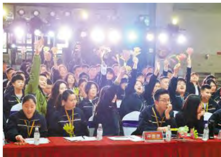
成都公司决赛现场