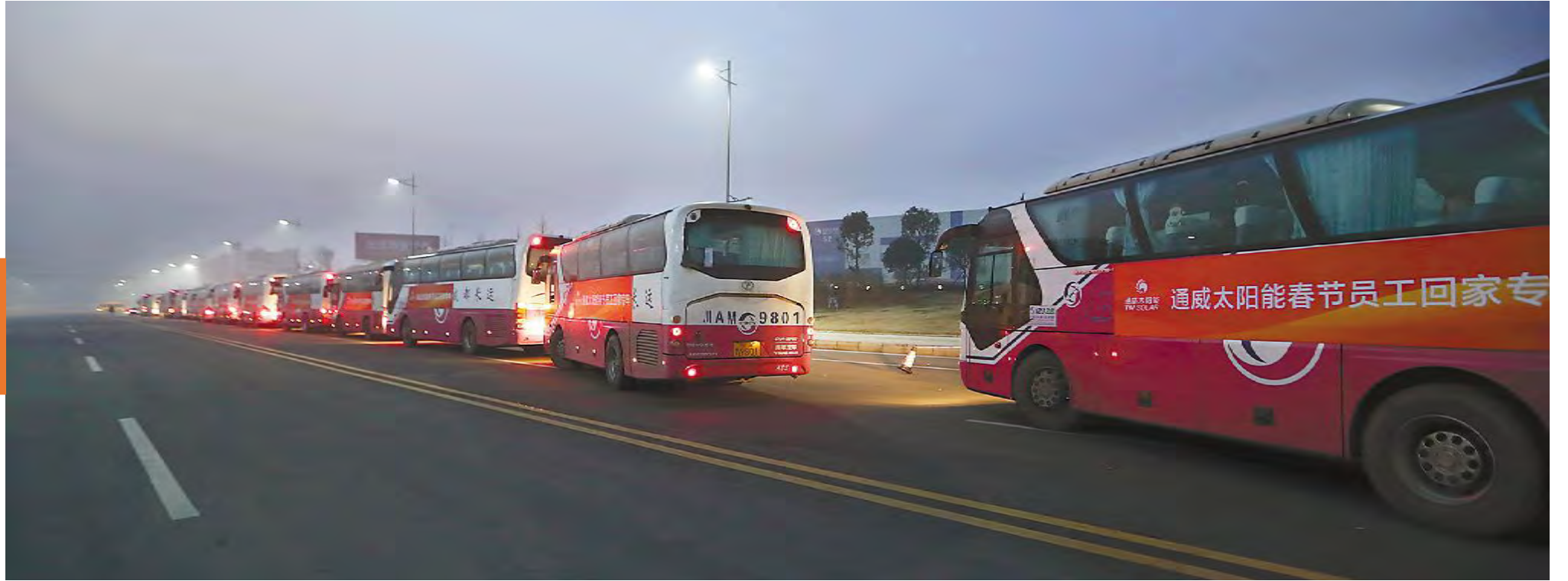
大年三十清晨,合肥、成都两地19条回家专线开启回家路