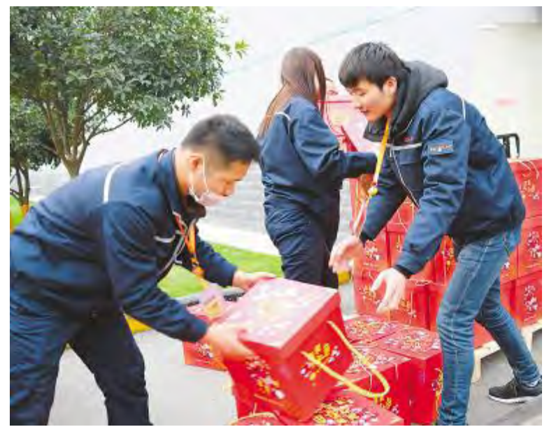
工作人员发放春节大礼包

2017年,公司开展的一系列节日慰问让员工真切地感受到通威大家庭的温暖,在这样殷切的关怀之下,大家都觉得动力十足。2018年,全体员工将带着这份关怀与祝福,戮力同心,共创佳绩!