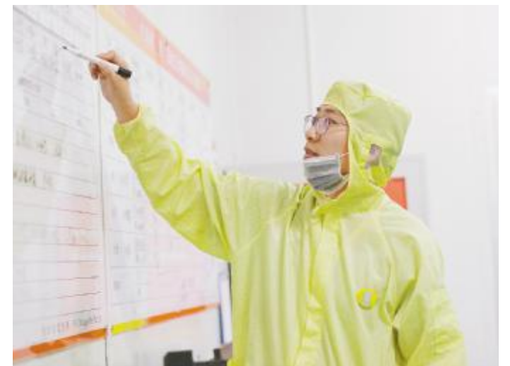
通威太阳能员工国庆期间坚守岗位,谱写爱岗敬业劳动赞歌