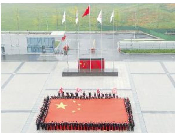
通威太阳能员工向祖国70周年献礼