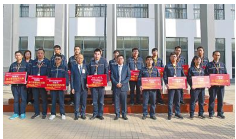
通威太阳能合肥公司2019年第三季度TQM改进项目表彰大会现场

辩论赛决赛的结束也标志着通威太阳能2019年质量月活动圆满落幕。本届质量月通过线上、线下多种形式开展,先后举行了点赞通威点亮质量月、质量知识有奖竞答你来“稿”事、质量辩论赛、TQM改善积分加倍赏等六大活动。通过全员参与,发现和采取更多有效措施提高产品、体系或过程满足质量要求的能力,使质量达到一个新的高度。