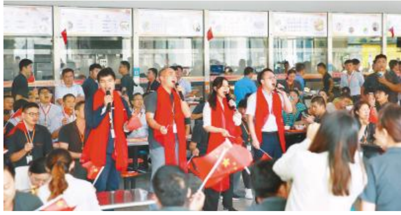
合肥基地员工进行歌唱祖国快闪活动