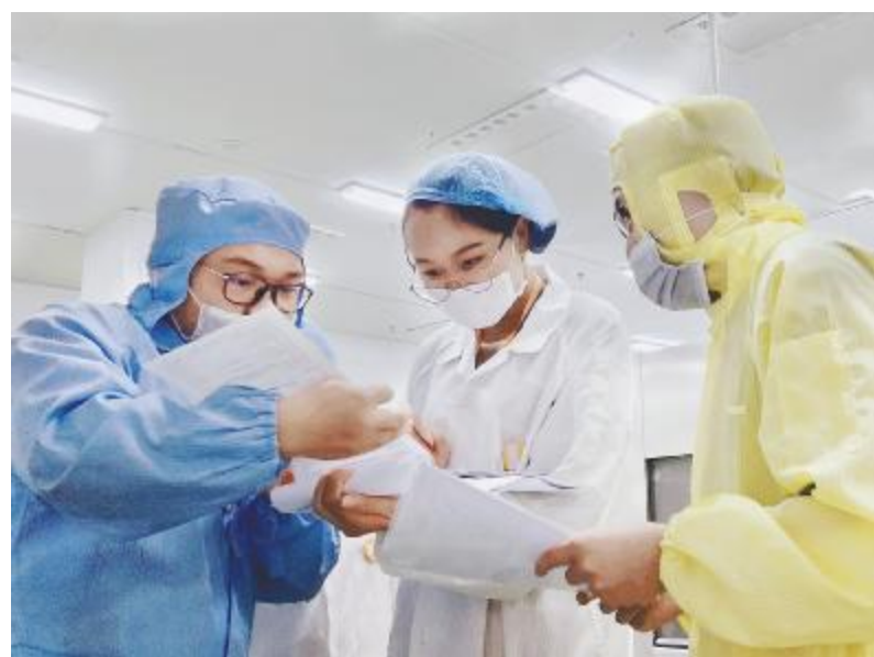
通威太阳能合肥公司2019年季度过程审核现场

10月18日的末次会议上,各厂厂长、部长、经理等管理人员出席会议,对审核中存在的问题和不足制定详实有效的整改措施。本次审核,有利于公司进一步识别并制定措施规避电池加工制造过程中的风险,确保公司质量管理体系持续符合ISO9001:2015标准要求、客户要求以及相关法律法规的要求。