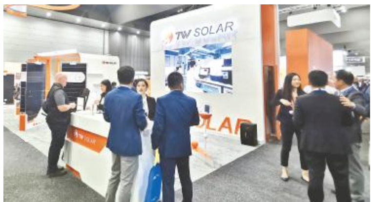
通威太阳能亮相澳大利亚全能源展