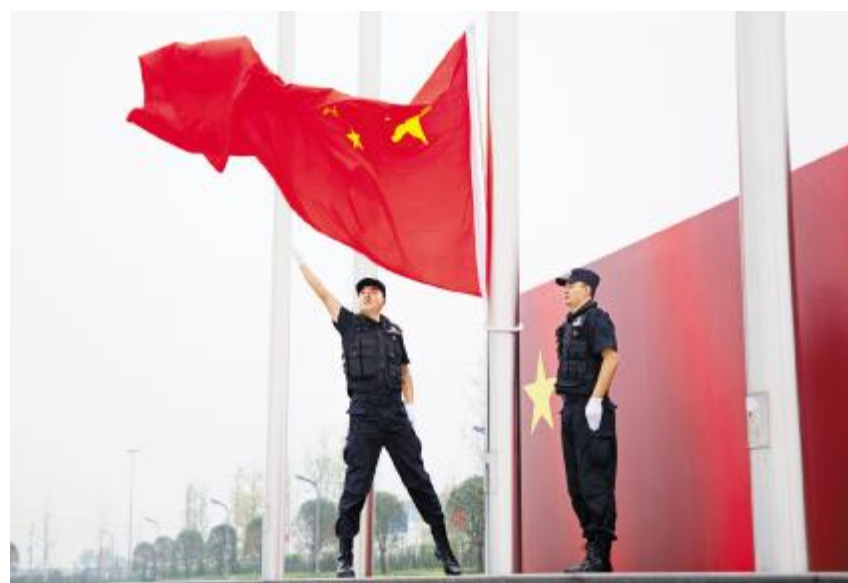
成都基地庄严的升旗仪式