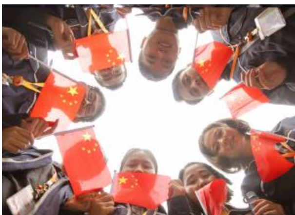
通威太阳能员工与国旗合影

通威太阳能作为国家绿色工厂、智能工厂,一直致力于党工共建的特色发展路径,让党建工建相融相促,引领职工同心筑梦,促进企业和谐发展。此次开展庆国庆系列活动向新中国70周年献礼,利于职工在感受国威的同时,更好的将党工共建融入公司生产经营发展的全过程。员工们纷纷表示要铭记历史,弘扬民族精神,同时立足本职工作,不断提高自我要求,以昂扬向上的工作状态,迎接更为严峻的挑战,为光伏事业贡献力量,永远保持奋斗精神,不忘初心、继续前行。