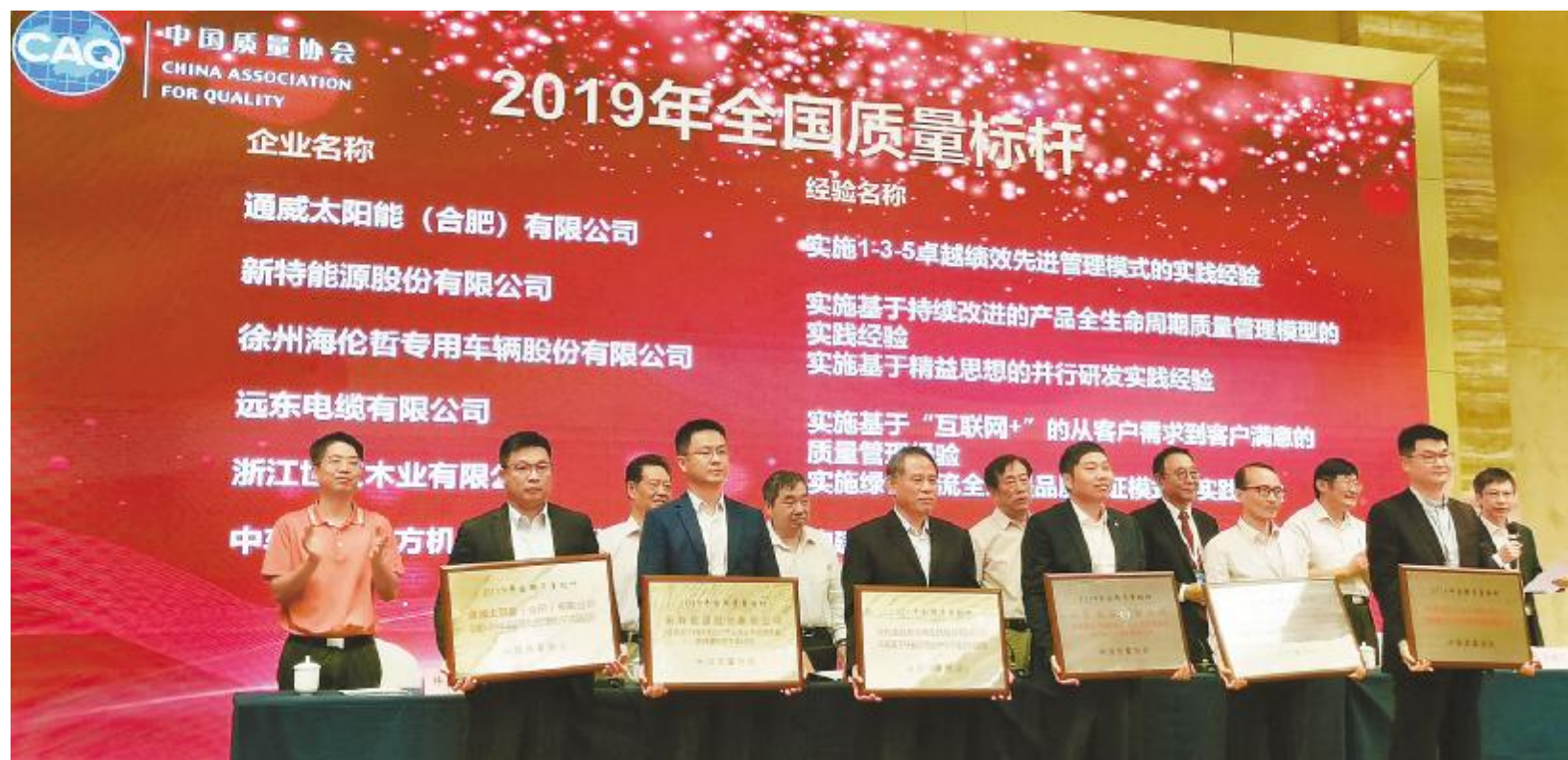
通威太阳能合肥公司荣膺“2019年全国质量标杆”殊荣

质量是兴国之道,更是强企之策。质量是检验产品市场认可度的重要标准,是企业的尊严,也是持续发展的坚强后盾。刚刚过去的全国质量月,通威太阳能开展了包括点赞质量月、全员找隐患、质量征文等一系列活动,全面提升全员质量意识和参与质量建设的积极性。我们同时也要清醒地看到,质量建设是一项长期而艰巨的任务,提高质量不可能一蹴而就,要常抓不懈,而不能浅尝辄止。在通威太阳能,质量建设一直在路上,通过持续不断地开展质量提升工作,最终在行业内树立了“通威口碑”。