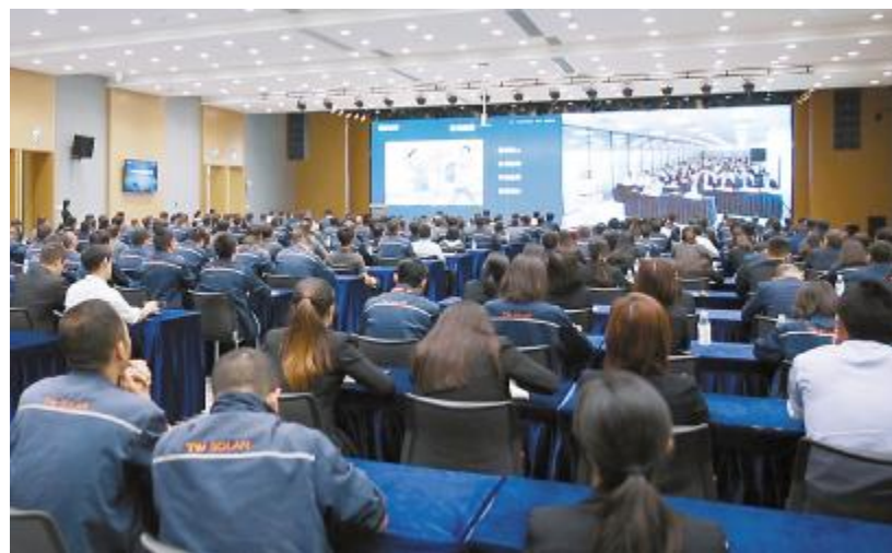
成都基地文化沙龙现场

员工熟知企业文化内容,践行企业文化制度,进一步推动公司文化建设向更优发展。经由企业文化沙龙所汇聚、分享、传播的故事,将不断推动企业文