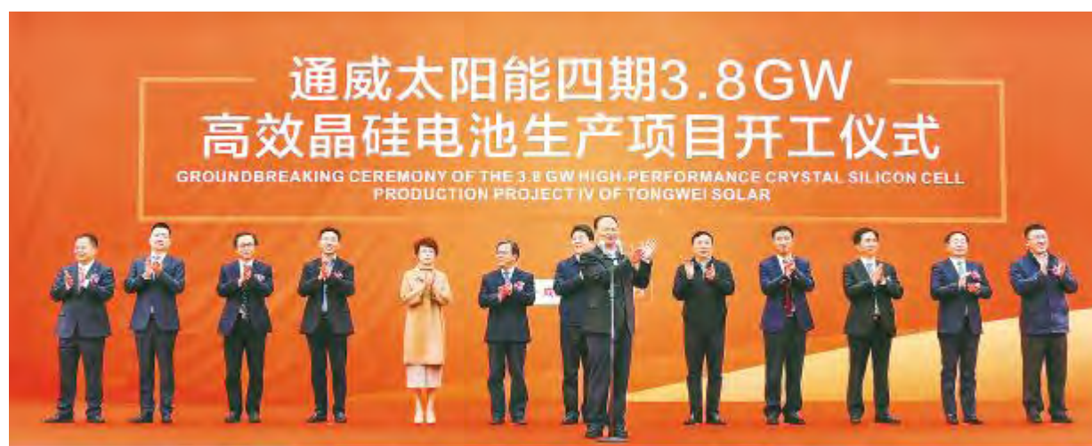
通威太阳能成都四期 3.8GW 高效晶硅电池项目开工

3月23日,通威太阳能成都四期3.8GW 高效晶硅电池项目开工仪式在通威太阳能成都基地隆重举行。成都市人民政府副市长曹俊杰,成都市政协副主席、双流区委书记韩轶,四川省地质矿产勘查开发局党委书记、副局长张明全,双流区人大常委会主任陈琳,双流区政协副主席李德龙,成都市投促局副局长张平,双流区政府副区