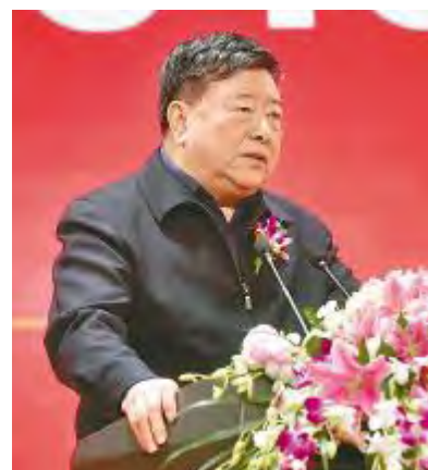
原国务院参事、中国可再生能源学会第七届、第八届理事长石定寰致辞

成都市政协副主席、双流区委书记韩轶,原国务院参事、中国可再生能源学会第七届、第八届理事长石定寰,中国光伏行业协会副理事长兼秘书长王勃华,通威集团董事局刘汉元主席相继致辞。