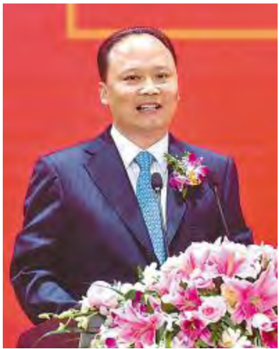
通威集团董事局刘汉元主席致辞

刘汉元主席致辞表示,从通威太阳能成都一期项目开工到今天四期项目开工,四年时间,成都项目以每年生产能力翻一番的速度向前推进,并且实现快速达产、满产满销、盈利经营,创造了中国乃至全球光伏行业历史上里程碑式的经营业绩,不断刷新世界纪录。汽车电动化、能源消费电力化、电力生产清洁化已经成为全球发展的共识。随着规模的扩大、成本的降低,光伏发电成为未来可再生能源主要来源的路径已非常清晰。2019年“两会”政府工作报告中提出,实现绿色发展是当务之急、是经济高质量发展的必然要求、是各种污染防治的根本之策,从政府工作报告的高度明确了雾霾治理、能源转型、生态环境改善的方向和路径。