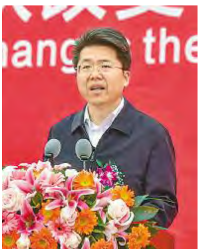
成都市人民政府副市长曹俊杰致辞

曹俊杰副市长在致辞中向通威太阳能成都四期项目的开工表示热烈祝贺。向长期以来为成都发展做出重要贡献的通威集团表示衷心感谢。当前,成都正深入贯彻习近平总书记来川视察重要讲话精神,紧扣省委省政府、市委市政府推动经济高质量发展的决策部署,以产业功能区建设为抓手,创新要素供给,加快构建产业生态圈和创新生态链,高质量建设现代产业基地。特别是为大力推进绿色经济等特色优势产业发展,成都正加快研究制定光伏产业发展规划,研究设立光伏产业投资基金,研究制定关于加快光伏产业发展的若干政策措施,加快培育一批万亿产业、千亿园区、百亿企业,力争到2022年,全市绿色低碳制造业实