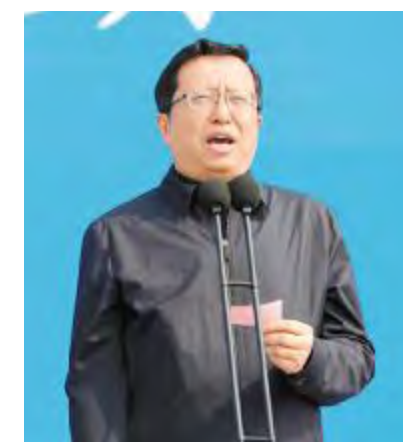
眉山市委书记慕新海宣布项目开工

慕新海书记向四川省委汇报了本次眉山重大项目开工情况,并表示,本次眉山市集中开工建设项目共计44个,总投资330亿元,包括全球最大高效晶硅电池项目等多个在全国乃至全球具有较强影响力、引领性的优质项目。