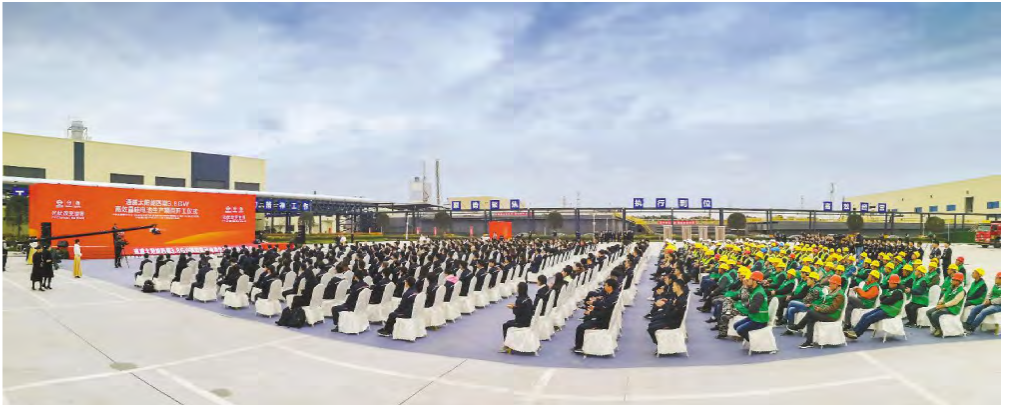
通威太阳能成都四期 3.8GW 高效晶硅电池项目开工仪式现场

仅相隔4天,3月27日,通威太阳能眉山10GW晶硅电池项目正式启动建设。眉山项目将打造全球智能化程度最高、量产转换效率最高、节能环保的绿色工厂,眉山基地将继成都基地后,又一次成为全球10GW级的最大高效晶硅电池基地。未来2-3年,通威太阳能电池产能规模将超过30GW,进一步夯实全球最大的晶硅太阳能电池企业地位。