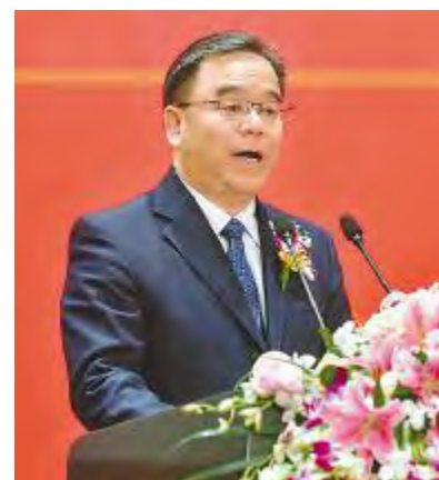
成都市政协副主席、双流区委书记韩轶致辞

大会还为长期以来支持、帮助通威太阳能发展,为通威太阳能提供优质产品及服务的供应商进行了颁奖,28家供应商分别获得“最佳服务奖”、“卓越品质奖”、“成本贡献奖”,隆基绿能科技股份有限公司、天津环欧国际硅材料有限公司、保利协鑫能源控股有限公司等10家供应商被授予