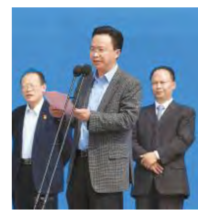
甘孜州常委、常务副省长、组织部部长刘吉祥致辞

甘眉合作唇齿相依、多赢共生,通过近7年的联动发展,甘眉工业园区位居全省4大藏区飞地园区经济总量之首,成为四川省首批新型工业化产业示范基地、高新技术产业化基地、太阳能光伏产业基地,通威太阳能眉山10GW高效晶硅电池项目等重大工业项目的落地开工,标志着园区发展再次迈出关键一步,充分体现了企业家对两地未来发展的信任支持,必将为两地经济高质量发展再添新动力、再注新活力。