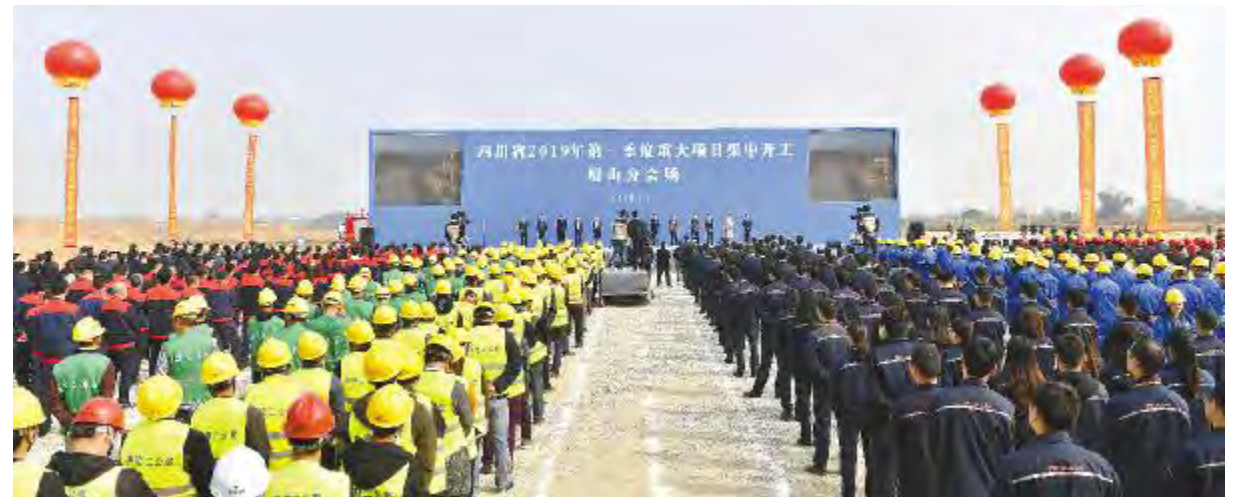
通威太阳能眉山 10GW 高效晶硅电池项目开工仪式现场

近年来,成都市委、市政府大力支持民营经济发展,营造了良好的国际化营商环境,让在蓉民营企业吃下定心丸、安心谋发展。双流区委、区政府更是让我们民营企业感受到尊重、重商、亲商的浓厚氛围和实实在在的成效及变化,更加坚定了通威进一步加大在双流投资的热情和信心。今天,通威将再新增投资20亿元,正式启动四期工程,计划今年内投产。今年底,通威电池总产能将超过20GW,将连续3年成为全球产能规模和出货量最大的太阳能电池企业,全球市场占有率有望达到15%。