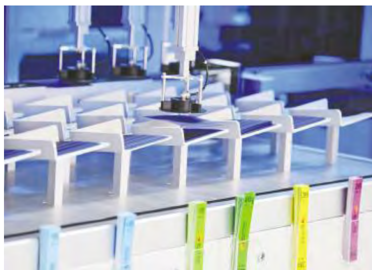
每一片电池片经过严格的测试分选后归类

通威太阳能成都公司始终秉承“追求卓越,奉献社会”的企业宗旨,积极、全面、持续地推进卓越绩效管理,并在文化引领、战略导向、顾客与市场、技术创新等方面有突出表现。此次成功斩获首届