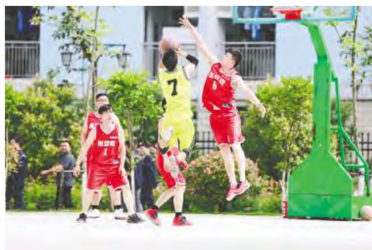
合肥公司比赛现场