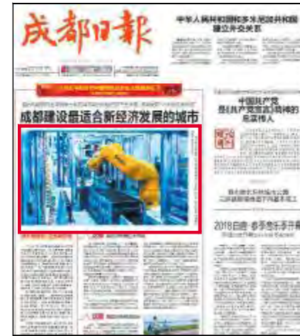
《成都日报》头版头条聚焦通威太阳能

威太阳能作为成都市“无人经济”、高端制造的代表获得了全景式的展现。香港卫视报道画面节目重点展现了通威太阳能无人产线,并指出,在生产领域,成都已经布局了堪称“超级工厂”的通威太阳能无人生产线——世界首条工业4.0高效电池生产线。在这座“超级工厂”