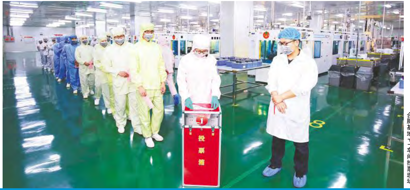
合肥基地生产车间投票现场