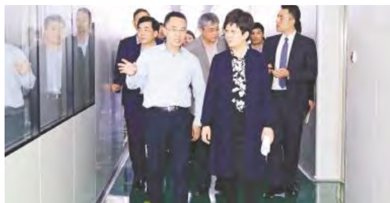
凌云市长一行深入车间调研

走在产业前沿,而通威太阳能作为合肥新能源产业建设的排头兵更有责任与担当,同时在新项目的建设要注意施工安全和生态环境保护。凌云市长强调,服务好企业、服务好企业家是政府的重要职责。各级政府和部门要经常深入企业走访调研,充分了解企业的痛点和难点,有针对性地制定出台相关扶持政策。合肥市相关部门将全力以赴服务通威太阳能的发展,给予重点帮助和支持,希望通威太阳能再接再厉,再创佳绩!