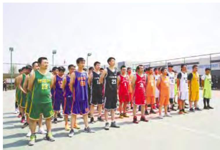
成都公司开赛仪式现场

4月26日,烈日当空,合肥公司的6支队伍迎来首次交锋,现场也同样地紧张激烈。截止4月28日,电池一厂、二厂,厂务部代表队分别赢得1个胜场,决赛将于5月8日举行,是电池二厂代表队第四次捍卫合肥公司第一名,还是其他代表队打破他们的垄断?我们拭目以待!