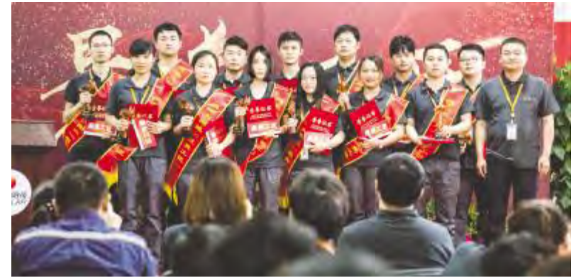
合肥基地获得“最美工匠”荣誉员工合影留念

此次“最美工匠”评选是将工匠精神、创新意识以及通威太阳能企业文化的有机结合。活动的举办在两地公司形成了比学赶超的良好氛围。