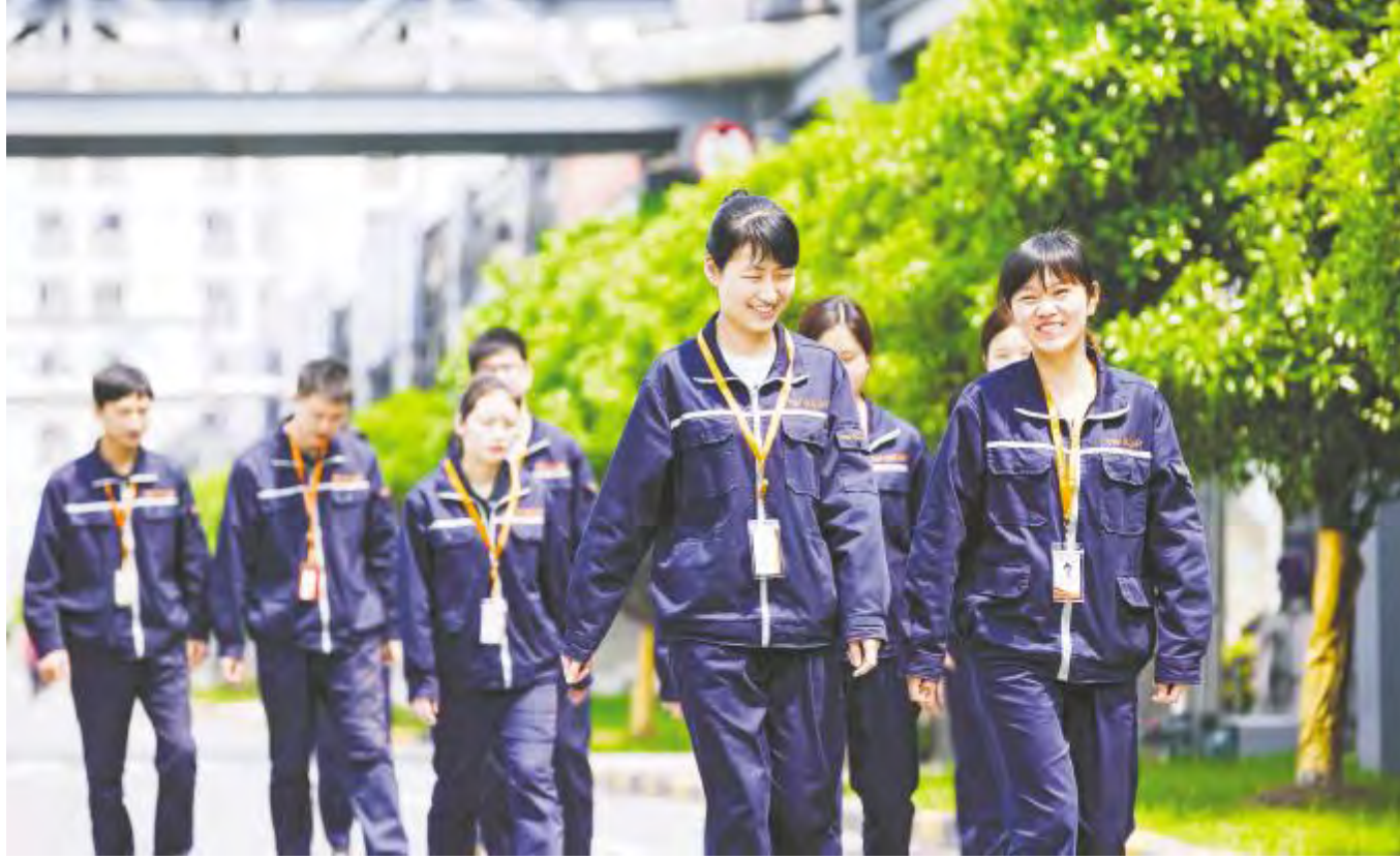
热情似火的青年在通威太阳能挥洒着自己的青春汗水

在通威太阳能,4500名青年正为实现“光伏改变世界”的梦想,在各自岗位奋战拼搏,初心不改。