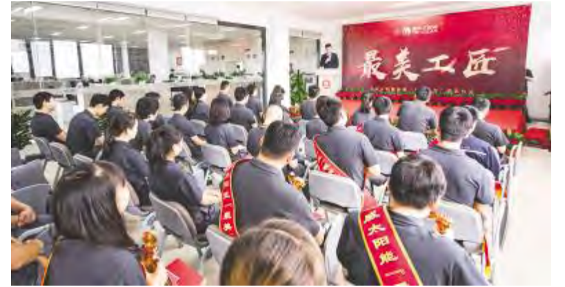
成都基地“最美工匠”评选颁奖仪式现场

此次“最美工匠”评选活动全面面向一线员工,从活动当日开始分组开展票选统计工作,最终评选出两地各10名来自各体系、各部门一线岗位的“最美工匠”,并于五四青年节当天分别在两地举行隆重的颁奖活动。