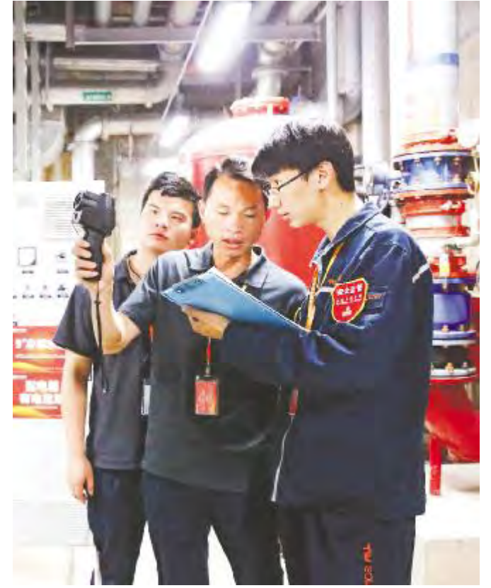
成都基地安全检查人员正在用红外热成像仪测试设备温度