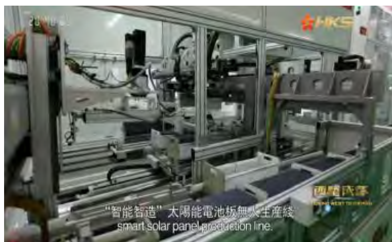
香港卫视报道画面