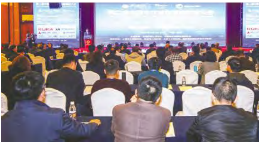
第二届中国光伏绿色智能制造大会现场

奖项的获得不仅是对通威太阳能管理体制的充分肯定,更是对公司在光伏绿色智能制造方面所做出的杰出贡献的充分认可,进一步提升了通威太阳能的品牌影响力和美誉度。未来,通威太阳能将进一步完善一体化运营管理,提高企业综合竞争力,提升产业发展的质量与效益,不断朝着“打造世界级太阳能光伏企业和世界级清洁能源公司”的目标砥砺前行!同期获奖单位还有天合、协鑫、晶科、正泰、腾辉等行业优秀企业。