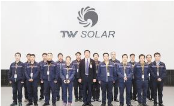
最佳学习成长部门——成都电池一厂设备部