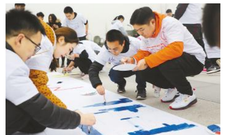
供销团队共绘通威太阳能蓝图