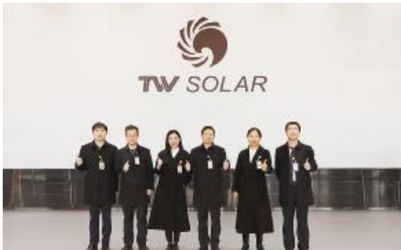
遵章守纪模范部门——成都投资发展部