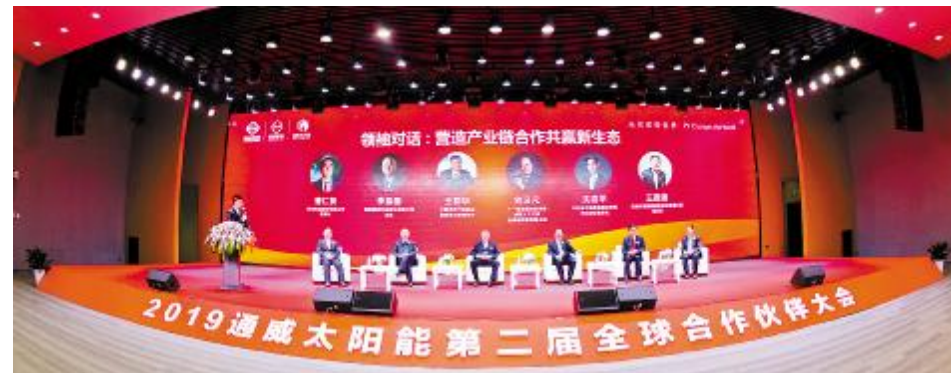
2019年3月26日,2019通威太阳能第二届全球合作伙伴大会隆重举行