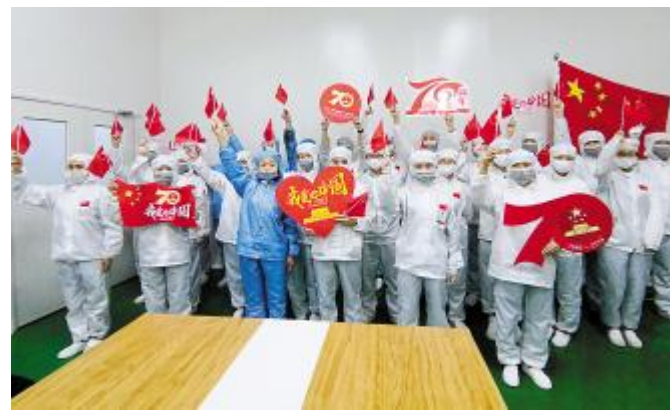
2019年10月1日,通威太阳能开展庆祝建国70周年系列活动,员工与国旗合影