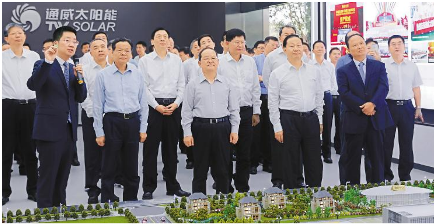
2019年4月26日,四川省委书记彭清华,广西壮族自治区党委书记、自治区人大常委会主任鹿心社莅临通威太阳能调研