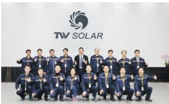
安全生产先进部门——成都电池一厂设备部