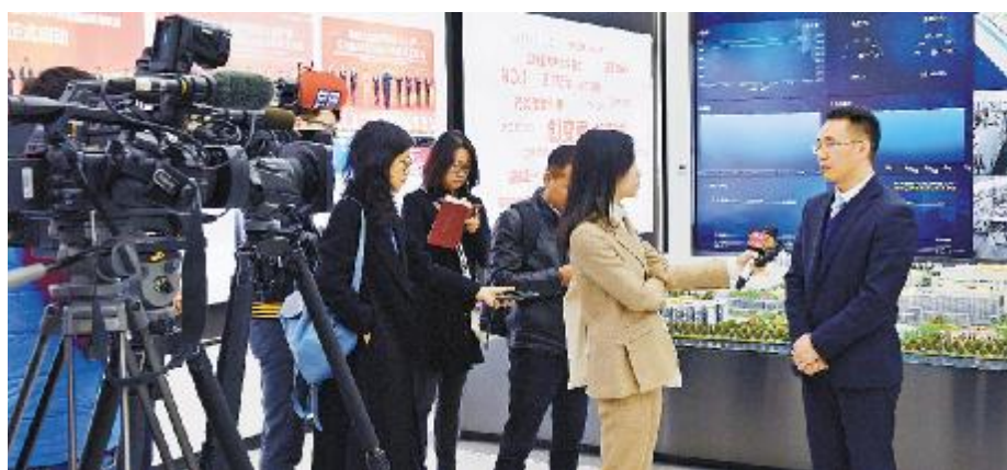
2019年11月18日,主流媒体聚焦通威太阳能成都四期项目投产

2019年12月8日,英国、意大利、西班牙、澳大利亚、印度、日本、越南7国知名能源媒体赴通威太阳能成都基地参观、座谈交流,就通威太阳能发展历程、竞争优势、智能制造等方面深入交流,向全球展现了通威太阳能的“智能制造”风采。