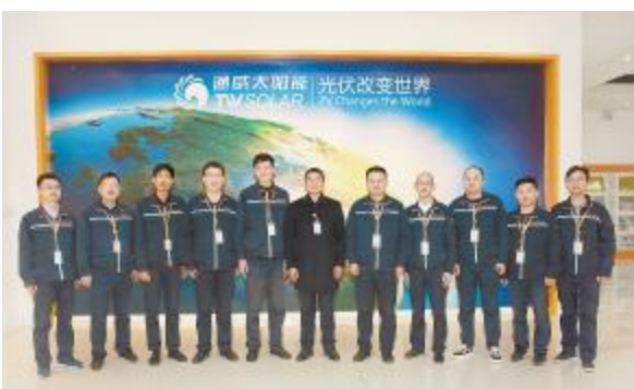
安全生产先进部门——合肥电池一厂生产部