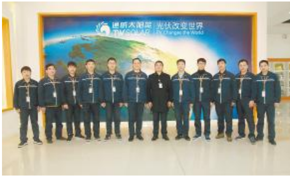
最佳学习成长部门——合肥电池一厂设备部