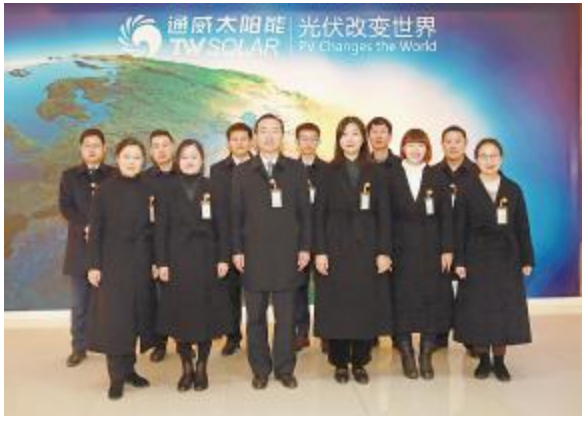
遵章守纪模范部门——合肥行政部