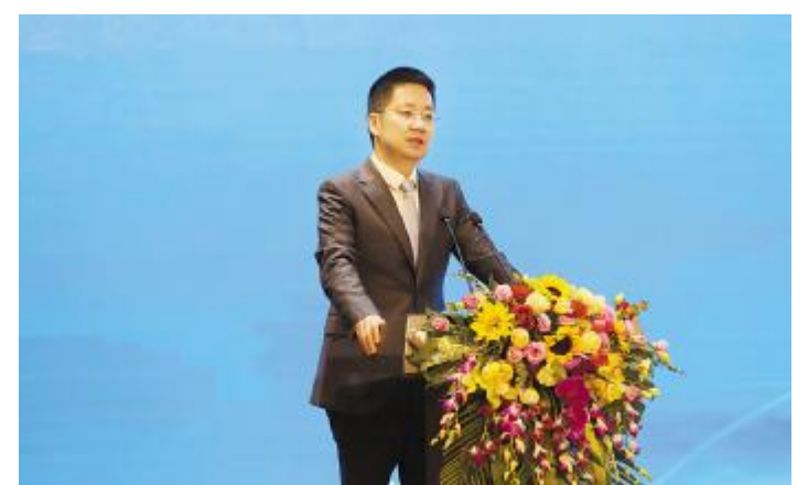
通威股份董事长谢毅讲话