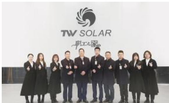
最佳成本贡献部门——成都招标部