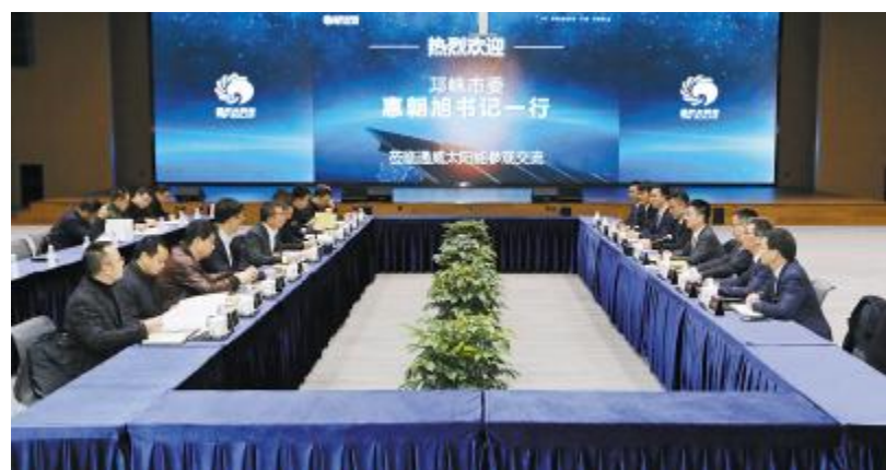
邛崃市委书记惠朝旭一行莅临通威太阳能成都公司调研