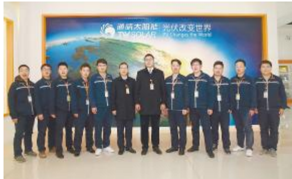
最佳成本贡献部门——合肥电池四厂工艺部