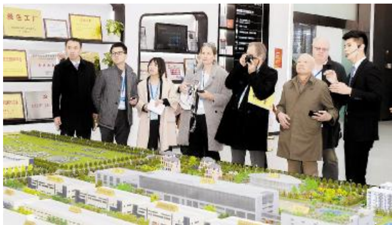
全球能源媒体团听取通威太阳能发展情况介绍