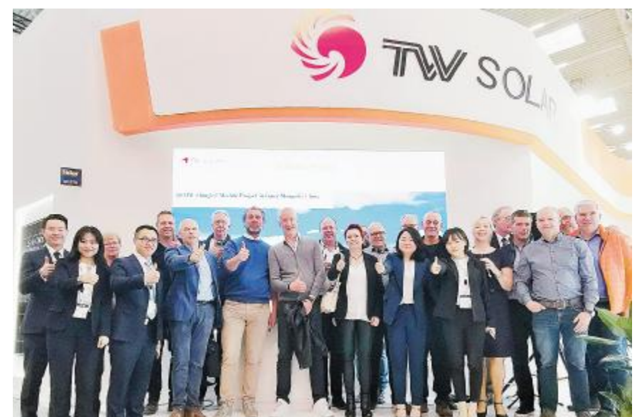
2019年5月15日-17日,通威太阳能精彩亮相慕尼黑国际太阳能光伏展

通威太阳能出色的研发创新实力也获得社会各界高度认可。2019年9月12日,2019年(第二十届)成都市科学技术年会隆重举行,通威太阳能成都公司作为2019年成都市院士(专家)创新工作站最终入选企业之一应邀参加,并在会上接受了主办方授牌,标志着通威太阳能院士(专家)创新工作站正式建站。此外,公司还荣获了2018年安徽省百强高新技术企业、四川省技术创新示范企业等系列殊荣。