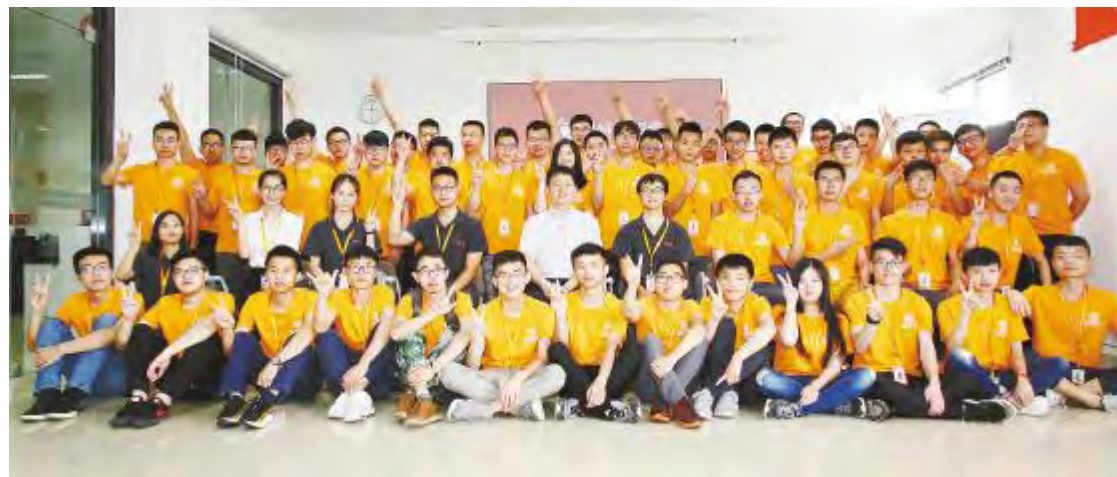
通威太阳能 2018 年“启航工程”培训项目正式启动

在向外引进优秀人才的同时,内部人力资源培养选拔不可忽视,建立企业内部后备人才梯队管理机制势在必行。通威大学光伏学院深化校企合作机制,通过启航工程、订单班、夏令营等形式,做好公司人才储备,保证了企业人力资源的延续性。