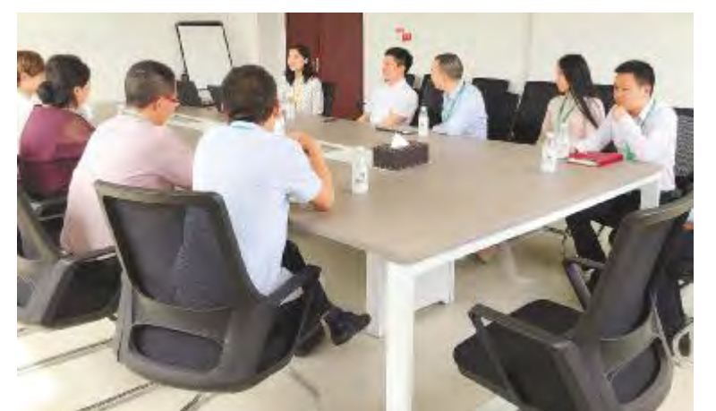
新千里装饰集团人力资源团队莅临通威太阳能成都基地交流学习

光伏学院始终坚持加强与标杆企业的交流学习,既解决眼前问题,也储备前瞻能力,于当下提升管理水平、于未来开阔眼界以致致远。未来,光伏学院将持续积极对接优质企业资源,为公司的快速发展打好人才保卫战。