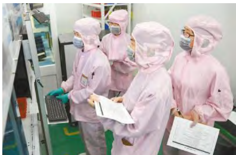
实际操作技能考核现场,员工操作设备机台