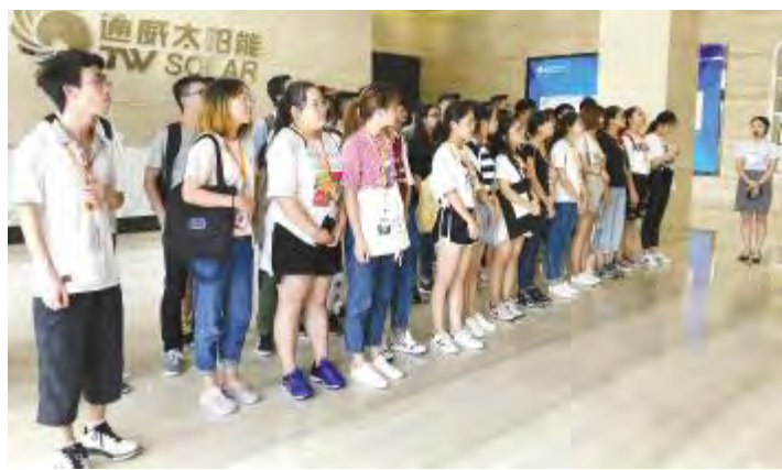
西南石油大学夏令营学员参观 S2 车间