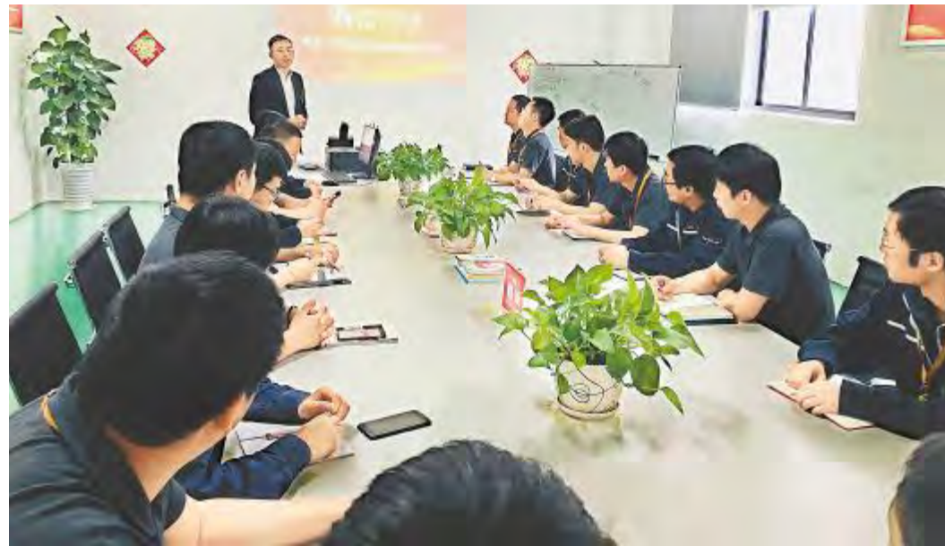
岗位晋升培养项目开班仪式现场

班组长优秀管理案例分享不仅提升了员工积极思考、自主创新的能力,更为公司沉淀出更多优秀的学习资料。光伏学院将继续探索,每月定期组织此类类型的分享会,加快建设学习型组织,促进公司的发展。