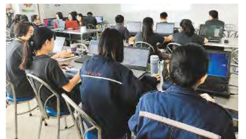
光伏学院开展摄像及后期制作学习活动