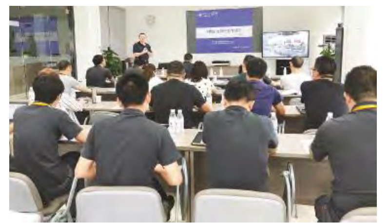
通威太阳能中高管 MBA 研修班第四期授课现场

此外,光伏学院还开办了电工技能提升班等,旨在培养员工一技多能,拓宽员工职业发展通道,释放员工工作压力,让员工以更好的状态投身到工作中。