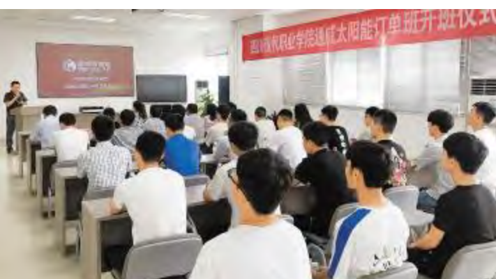
四川现代职业学院通威太阳能订单班开班仪式现场

结合公司全新发展时期对人才的要求,取长补短,完善培训体系,2018 年“启航工程”培训项目分为 2 周集中培训、10 周岗位实习、12 周定向培养三个阶段,合肥、成都两地将分 5 批次完成 300 余位应届生的培训,光伏学院希望通过系统科学的培养让应届毕业生快速认知自我、认知公司、融入工作、提升技能、胜任岗位,为公司的快速发展储备技术型人才。