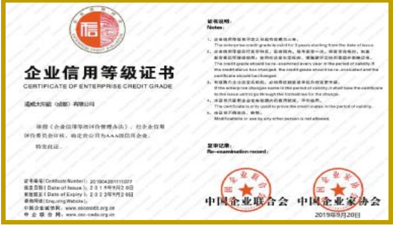
通威太阳能“AAA 级信用企业”证书

选。建站后,通威太阳能将进一步贯彻落实创新驱动发展战略,围绕公司发展急需解决的重大关键技术难题,团结科技工作者,依托院士专家资源,深入开展科技攻关和学术交流,大力培养创新型科技人才,加快科技成果转化,不断提高自主创新能力,不断提升企业竞争力,为成都建设全面体现新发展理念的城市做出新的贡献。