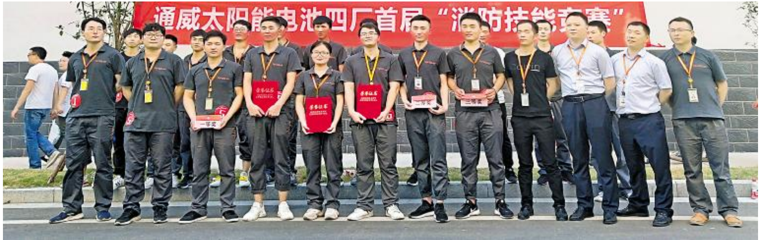
合肥公司电池四厂首届“消防技能竞赛”成功举办

赶,用速度与技巧完成全部比赛。整个活动现场气氛热烈,各部门员工在比赛中的出色表现,赢得了现场观众的阵阵喝彩声。最终,设备部5组以总用时30秒斩获冠军,设备部6组用时31秒荣获亚军,生产部3组获得季军。 通过此次比赛,进一步增强员工的消防意识,夯实员工的消防知识,筑牢消防常识的学习根基,让选手通过竞赛互相学习,找到差距,提高实际应用消防知识的能力。