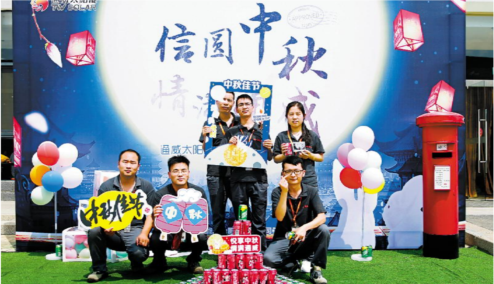
合肥基地员工们在中秋活动现场合影留念