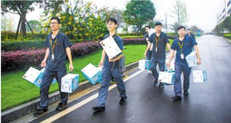
成都、合肥基地员工兴高采烈领取中秋节礼品

集赞领奖活动更是瞬间刷爆了朋友圈,将通威特色的中秋祝福和欢乐传递给了更多的人,受到了员工的广泛欢迎。 除了“信圆中秋 情满通威”传统佳节活动,公司工会、行政部还为全体员工准备了精心挑选的中秋大礼包。除了传统的月饼,还有各种各样精美的小食品。大礼包满载着对全体同仁的节日问候与祝福,被纷纷派发到大家手中。中秋节当天,两地食堂还为员工准备了免费的月饼、酸奶、银耳汤、木耳红枣羹等特色美食,并组织了欢乐有趣的现场游戏和抽奖礼券,让大家虽在忙碌中,也能感受到浓浓的节日氛围和通威大家庭的温暖。