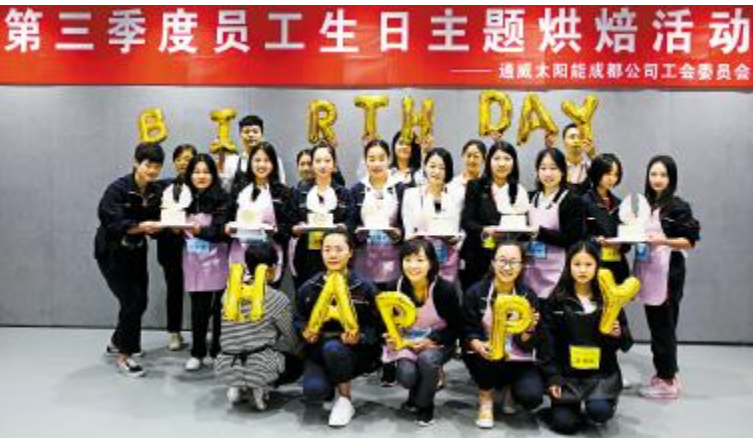
成都公司第三季度员工生日主题烘焙活动合影留念

生日,活动氛围一次次被推向高潮,欢声笑语回荡在整个活动现场。 此次活动承载了公司对员工辛勤劳动的真挚情感,让每一位在职员工切身感受到公司大家庭的温暖,增强员工的企业归属感。现场寿星们一个个欢快的笑脸,让彼此在忙碌的工作之余,也能拥有难忘的生日庆祝时刻,体现了公司工会的人文关怀,对员工无微不至的关心。最后,现场寿星们填写了生日会问卷调查,希望今后更多的员工能以喜爱的活动形式参与其中,更好的融入到集体的温暖与祝福中。