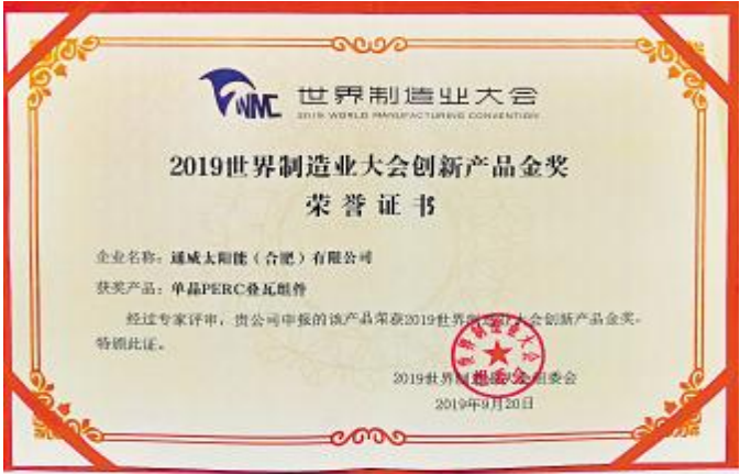
通威太阳能单晶 PERC 叠瓦组件荣获“2019 世界制造业大会创新产品金奖”称号

2013 年,通威太阳能以合肥基地为起点进军光伏领域,发展至今,电池片产能、产量均排名全球第一,逐步发展成中国乃至全球光伏新能源产业的核心参与者和主要推动力量,是中国实业稳健发展、不断超越的典型和缩影。未来通威太阳能还将坚定不移地发展绿色能源,向着“打造世界级清洁能源公司”的目标阔步迈进。