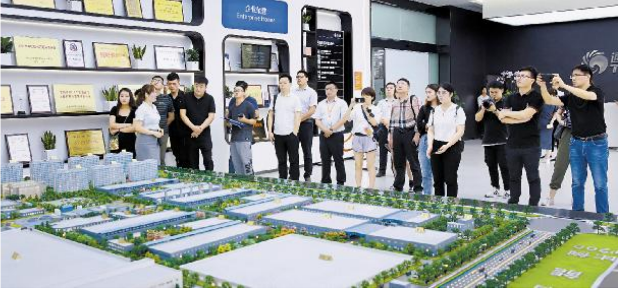
主流媒体走进通威太阳能合肥公司智能制造车间

9 月 19 日,合肥晚报以《通威助力合肥打造“光伏第一城”》为题,在版面头条大幅深度报道了公司