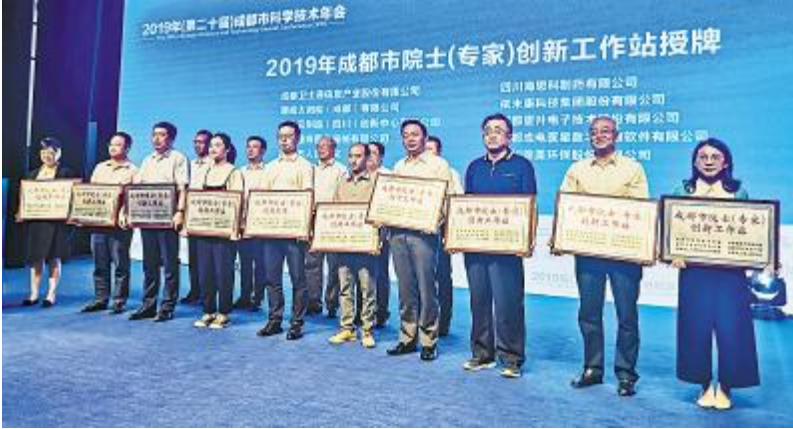
通威太阳能入选“2019 年成都市院士(专家)创新工作站”

金秋九月,丹桂飘香,第二个丰收节如期而至,各地庆祝丰收节大丰收。对于通威太阳能而言,九月是一个丰收的季节,通威太阳能顺利入选 2019 年成都市院士(专家)创新工作站,通威太阳能成都公司获评“AAA 级信用企业”称号,发展成果受到社会各界的高度认可与肯定。