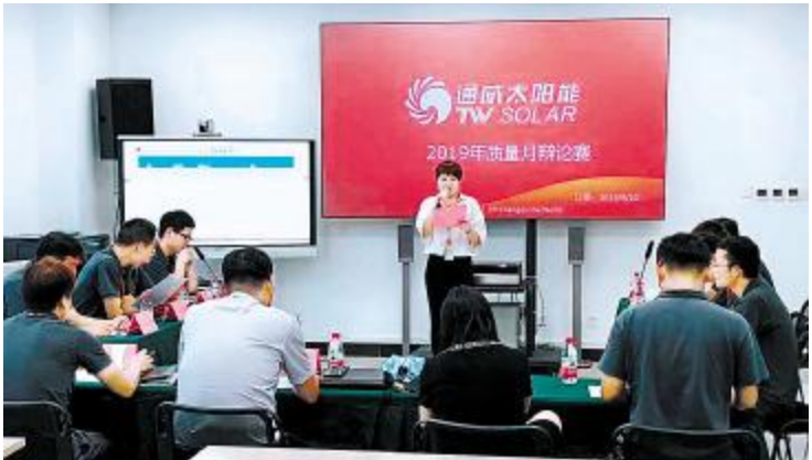
质量辩论赛初赛现场