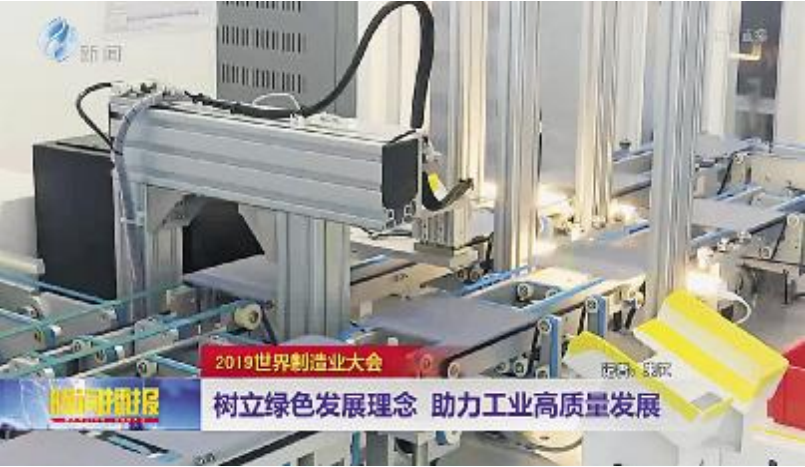
合肥电视台《晚间播报》深度聚焦通威太阳能

此外,海外网、东方网、今日头条、搜狐网等国内主流媒体也竞相将目光锁定这座“超级工厂”,纷纷聚焦通威太阳能在光伏领域取得的亮眼成绩。