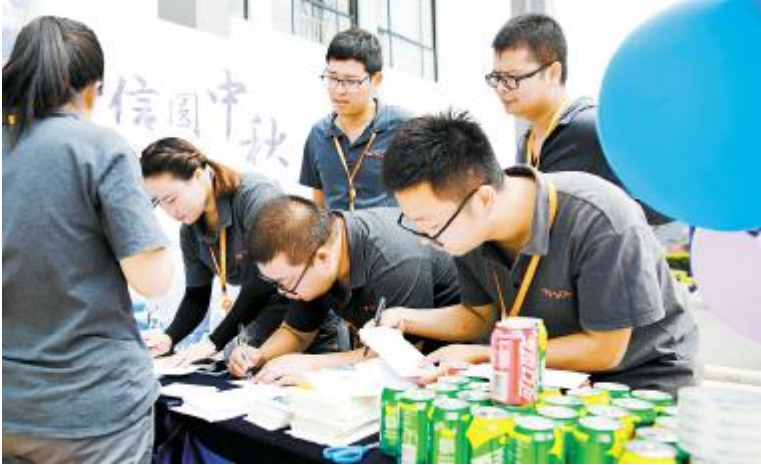
员工们手写一封封祝福的书信