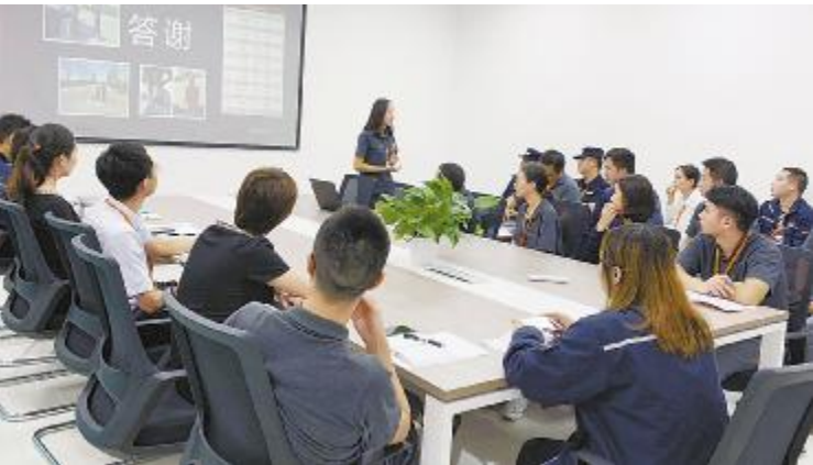
企业安全文化工作坊现场

工的不安全行为明显减少。工作坊中各员工也纷纷提出自己的意见和建议,为后期企业安全文化活动更有效的开展建言献策,共同为提升全员“防危重安”意识而努力。 企业安全文化是安全管理的重要组成部分,通过开展各项企业安全文化活动,潜移默化地把安全理念、安全意识灌输到每个员工的脑海中,在公司内形成一种积极向上的企业安全文化氛围。