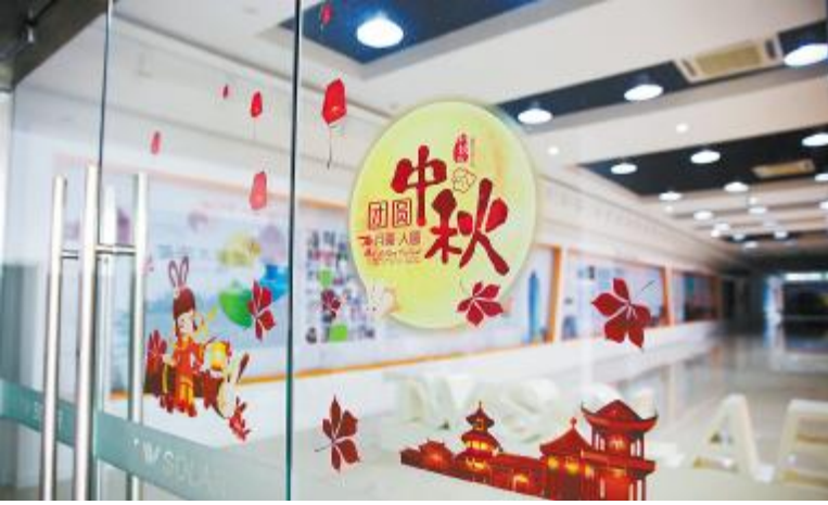
合肥基地浓浓的节日气氛