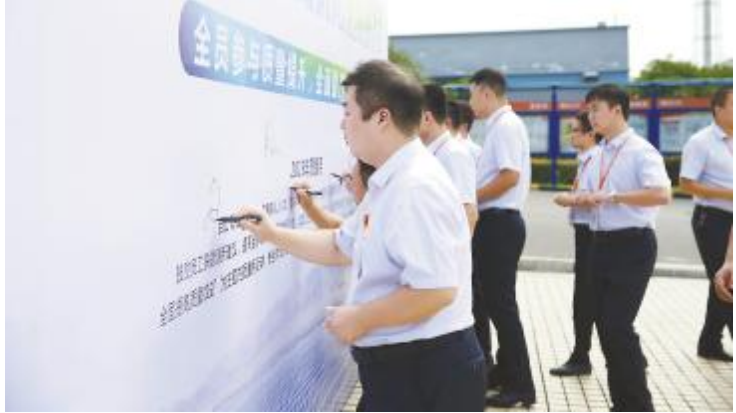
通威太阳能 2019 年质量月活动启动仪式现场

与此同时,公司还开展了“全员找质量隐患”活动,通过积分礼品奖励的形式,鼓励全体员工化为辛勤的“啄木鸟”,把身边的质量隐患的“蛀虫”找出来,把质量安全网“织”的更密实。