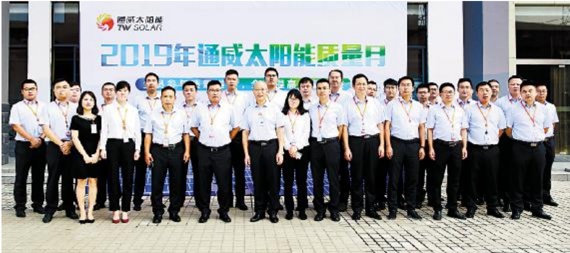
通威太阳能 2019 年质量月活动正式启动合影留念

通威太阳能始终秉承“质量立企、质量兴企、质量强企”的质量方针,并贯穿公司生产、经营、管理的各环节。本届质量月活动的开展将进一步深入推进全面质量管理,积极引导全员、全过程、全方位的质量提升,开创高质量发展新局面。