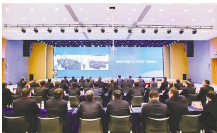
通威太阳能2020年度厂长述职会现场