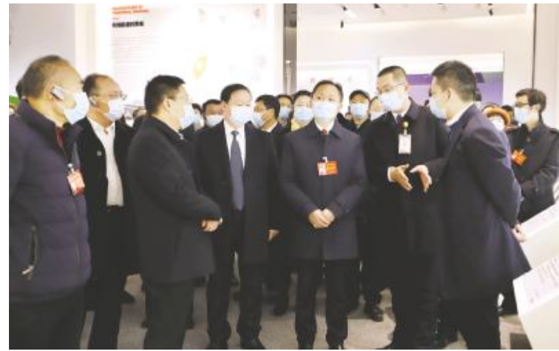
眉山市两会代表团参观通威太阳能智能制造体验中心

参观过程中,代表团与公司相关负责人亲切交谈,就光伏行业发展前景及眉山基地发展现状进行深入交流,并表示,通威稳健、快速发展,辉煌成绩令人钦佩,希望通威太阳能继续保持优势,创造更大行业价值,助推行业健康可持续发展。