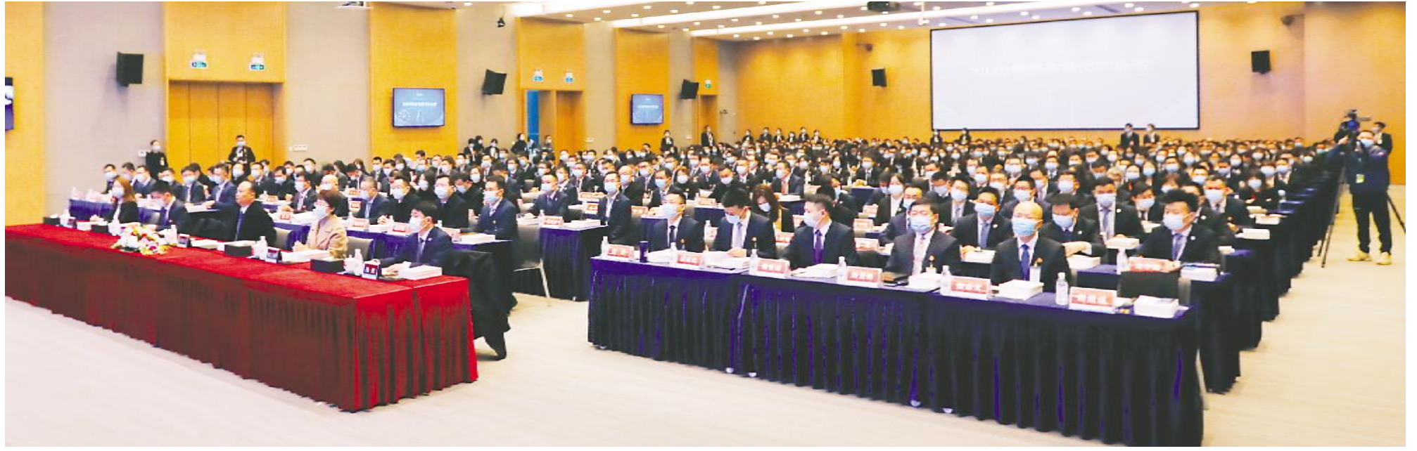
通威太阳能2020年度高管述职会现场

年终述职会的成功举行,为各体系、部门相互交流、相互启发、相互借鉴、相互学习搭建了平台,促进各体系更好地回顾总结工作业绩、谋划工作新篇、落实年度计划,推动业务发展取得更好的成效,从而更好地达成组织的战略目标。在新的一年里,通威太阳能团队上下将继续戮力同心、齐头并进、稳步向前的同时,再创新的业绩与辉煌!