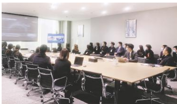
通威太阳能电池采购部2020年度述职会现场

2021年,通威太阳能产能规模将进一步扩大,通威太阳能生产体系将进一步强化对标管理、指标提升、安全生产,生产上,成本、品质、指标继续保持行业第一,努力实现连续8年重大安全0事故、重大环保0事故。