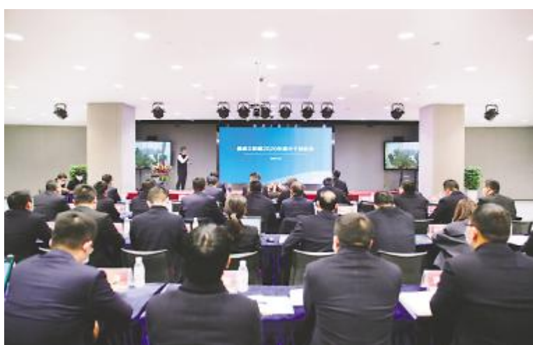
成都基地中干年终述职会现场