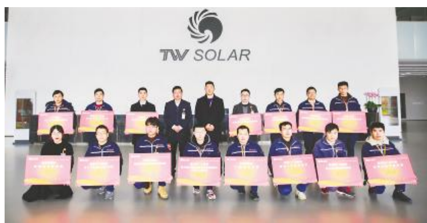
成都基地2020年第四季度TQM颁奖仪式现场