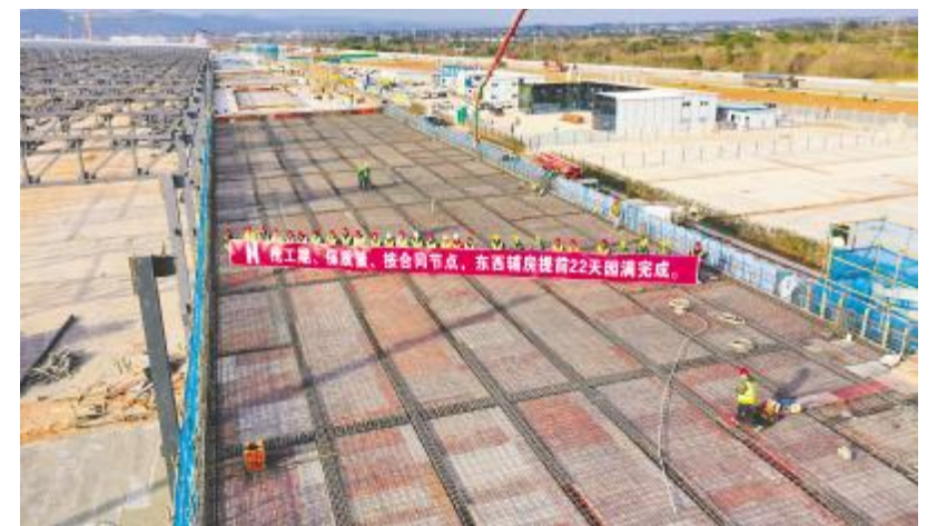
金堂基地一期项目A1车间土建工程提前22天完成封顶