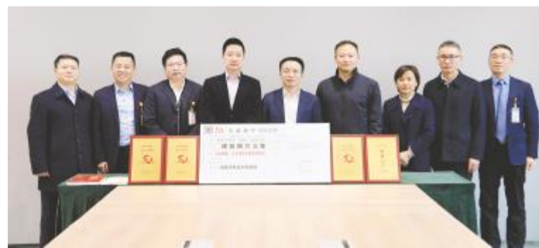
鲜荣生书记为通威太阳能成都基地颁授奖牌

座谈中,鲜荣生书记介绍了全区发展情况及未来发展规划,并现场办公解决公司关心问题。鲜荣生书记表示,双流持续优化营商环境,为企业提供个性化定制服务,实现“解决一个诉求、形成一套制度、破解一类问题”,从根本上为企业排忧解难。通威作为成都本土真正原创力工业企业,希望公司坚持科技创新,在“十四五”期间一如既往地支持双流发展,政企双方继续优化沟通机制,在更广领域、更深层次开