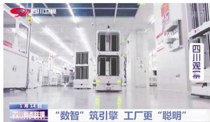
四川卫视《四川新闻联播》播出通威太阳能工厂画面

威太阳能有效带动产业链上下游企业生产恢复,受到中央电视台等主流媒体聚焦点赞,荣获“成都市抗击新冠肺炎疫情先进集体”荣誉称号。此次表彰是对新冠疫情以来通威抗疫防疫和复工复产工作的高度肯定。在错综复杂的国际国内经济形势下,在经济社会转型升级的关键阶段,通威将继续锐意进取、真抓实干,为加快体现新发展理念的城市建设、促进经济社会高质量发展做出新贡献!