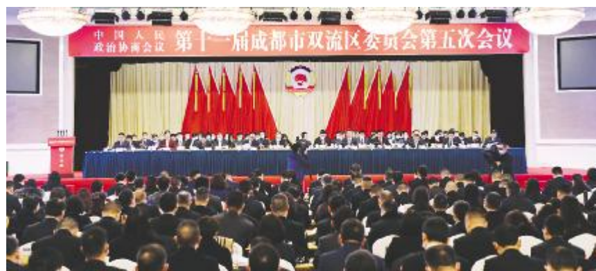
政协第十一届成都市双流区委员会第五次会议开幕大会现场

流的时代价值,加速攻坚城市功能品质提升。要以建设践行新发展理念的航空经济之都为统揽,努力把双流打造成为新时代企业最容易做生意的地方,市民获得感、幸福感、安全感增长最快的地方,干部人才心齐气顺、只争一流的地方!希望区政协在“十四五”期间一如既往地支持双流发展,最大限度增进理解、凝聚共识,为重塑双流荣光画出最大的同心圆,凝聚最大的正能量!