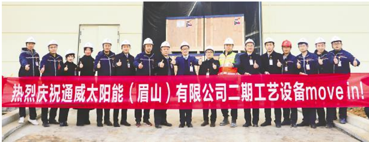
眉山基地二期项目工艺设备进场合影留念