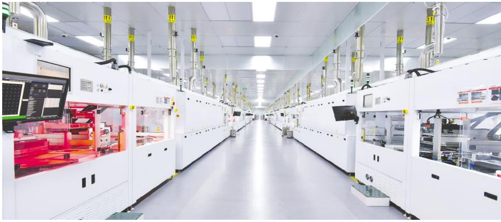
通威太阳能智能制造生产车间