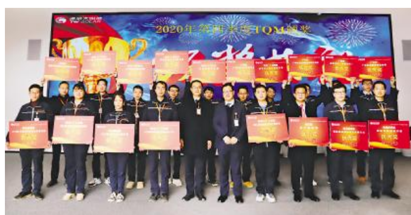
眉山基地2020年第四季度TQM颁奖仪式现场