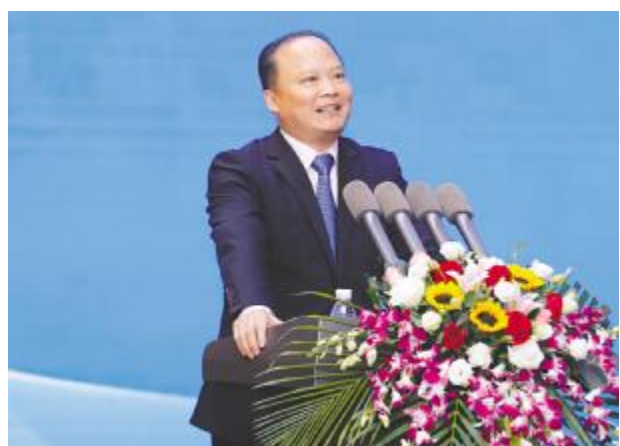
刘汉元主席作重要指示