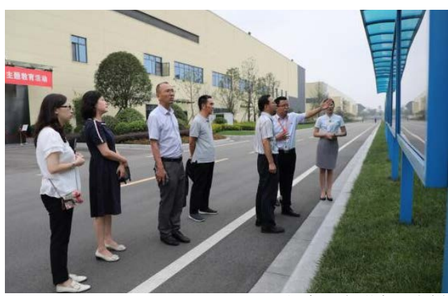
调研组一行查看党群宣传专栏

调研组一行首先在党群宣传专栏听取了“通威·红色聚能家”特色品牌打造情况,详细了解了成都公司党群体系建设及党建工作开展情况。 在A1车间,调研组一行听取了通威太阳能发展历程、产业规模、发展规划等相关情况介绍,姜文彬书记对通威太阳能的发展势头及规模给予高度评价。 最后,姜文彬书记表示,此次“党建进万企”活动走访服务,不仅是实地了解公司党建工作开展情况,更是听取企业意见诉求,着力解决相关问题。希望通威太阳能成都公司党委继续加强党建引领,凝聚职工群众力量,充分发挥党组织战斗堡垒作用和党员先锋模范作用,以高质量党建促企业高质量发展,充分展示通威太阳能的竞争力和发展活力。