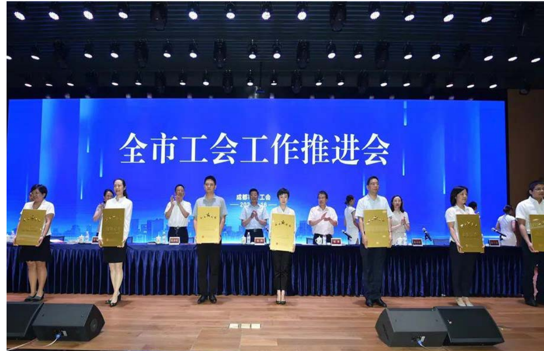
通威太阳能成都公司工会委员会获评市五星级

本报讯(通讯员 熊桂波)7月16日,2020年成都市工会工作推进会在通威太阳能成都公司举行,成都市委常委、统战部部长、市总工会主席吴凯,四川省总工会党组成员、副主席苗勇,双流区委书记鲜荣生,市总工会党组书记、常务副主席张余松,市总工会党组成员、副主席高永虹,市总工会党组成员、副主席黄蓉蓉出席,各区(市)县、产业工会负责同志及获评成都市四、五星级工会代表参会,通威集团党委书记、通威股份董事长谢毅热情接待。 吴凯常委一行现场观摩了“通威·红色聚能家”党群建设阵地,详细了解了通威太阳能职工权益保障、职工关爱、职工发展等各项工作开展情况,对通威太阳能工会委员会和职工之家建设成绩表示赞赏,对公司工会取得五星级工会荣誉表示肯定。 谢毅董事长对吴凯常委一行表示欢迎,并预祝全市工会工作推进会成功召开。谢毅董事长表示,在抗击新冠疫情过程中,省、市、区各级工会为政府员工服务和疫情防控提供了切实的指导和帮助,双流区委区政府送来口罩、消毒液等急需紧缺防疫物资,解决了公司燃眉之急。广大通威太阳能员工冲锋在前、加班加点,公司未发现疑似及确诊病例并率先实现复工复产,夺取了战疫情、保生产双胜利。 会议中,举行了获评四、五星级企事业单位工会授牌仪式,通威太阳能成都公司工会委员会作为成都市首批五星级工会领导受授牌,并作为先进代表进行经验分享发言。 苗勇副主席表示,通威有威、工会有为,通威太阳能工会建设成绩显著、效果突出。他指出,工会要不断加强基层工会凝聚力、吸引力,高位奋进、再创辉煌,助推成都继续在基层工会建设上当好“全省主干”和“领头羊”。 吴凯常委指出,全市各级工会要紧紧围绕省委十一届七次、市委十三届七次全会决策部署,再创服务大局、服务职工的亮眼实绩。 据悉,自2015年10月成立以来,通威太阳能成都公司工会委员会通过精心培育具有通威特色的工会建设载体,建立健全职工“思想之家、和谐之家、温暖之家、学习之家、活力之家”,成功打造“通威·红色聚能家”党群共建品牌,以亮眼成绩先后荣获“四川省模范职工之家”“四川省五一巾帼标兵岗”等诸多荣誉。此次全市工会工作推进会在通威太阳能成都公司召开,是对公司工会工作的极大肯定和鼓舞,通威太阳能成都公司工会委员会将珍惜荣誉、再接再厉,继续发挥引领示范作用,树立全市乃至光伏行业工会工作标杆,实现工会建设与公司发展高效协同。