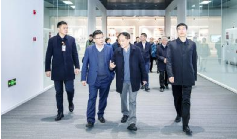
四川省政协副主席赵振铎调研通威太阳能眉山基地