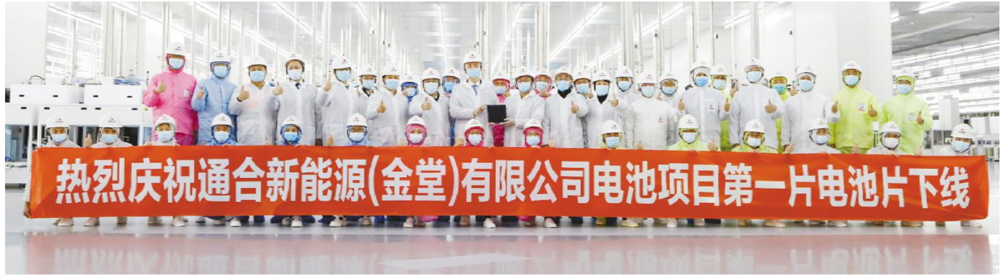
2021年11月10日,通合新能源15GW高效电池项目第一片电池片顺利下线