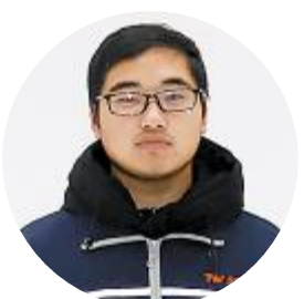
党会泽 岗位能手 金堂公司电池质量部