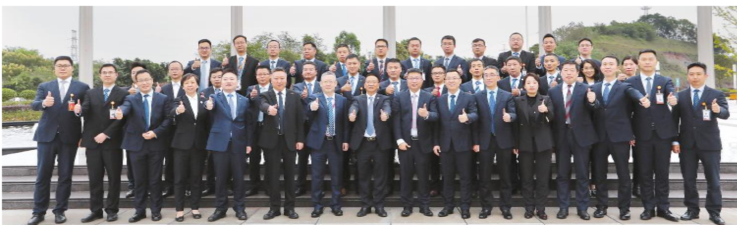
2021年10月16日,通威太阳能与永祥股份开展对标学习交流合影留念

目前,5G的高带宽、低时延、抗干扰在金堂基地厂区得到大力应用,基地5G室内IGV规划数量超1000台,其中一期已上线220台,网络时延低至20ms,正逐步实现IGV、工业机器人和PLC等工业设备全面互联。此外,室外无人叉车也在稳步推进之中。随着5G商用的进一步开展,智能化应用已经在通威太阳能金堂基地逐步开展,真正实现物料供应管理、生产监控与设备管理互联化、智能化。