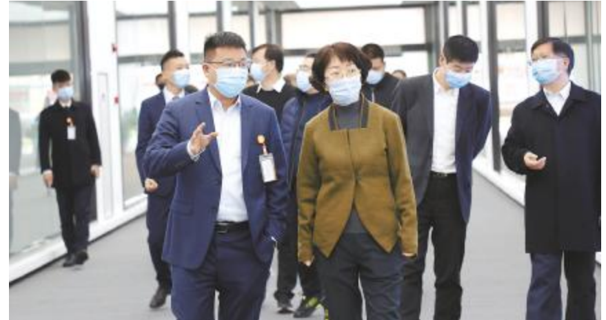
人社部职业能力建设司副司长王晓君调研通威太阳能双流基地