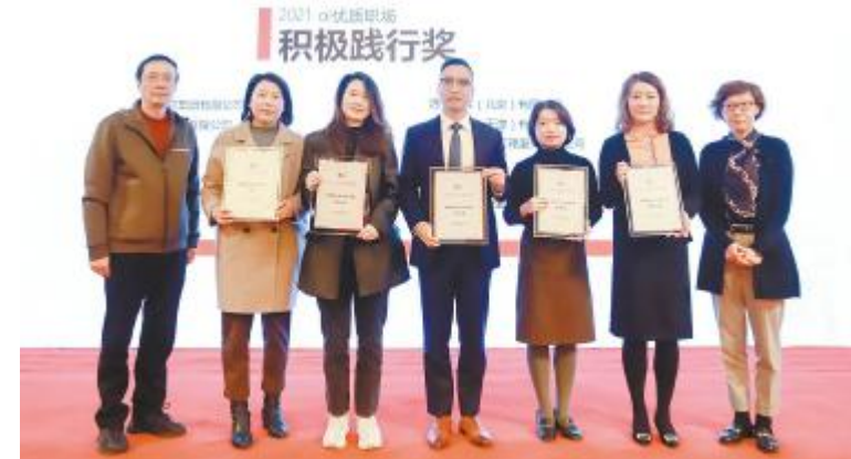
通威太阳能代表接受“2021 αi 优质职场积极践行奖”荣誉授牌

自通威太阳能眉山基地项目启动以来,受到社会各界的广泛关注,此次作为“国有企业眉山行”活动考察点位,充分彰显了通威太阳能强劲的发展实力。未来,通威太阳能将一如既往地严格落实国家绿色发展战略,加强同各企业间的联系,在可持续发展的道路上,携手各企业共同进步,共同助推四川经济高质量发展。