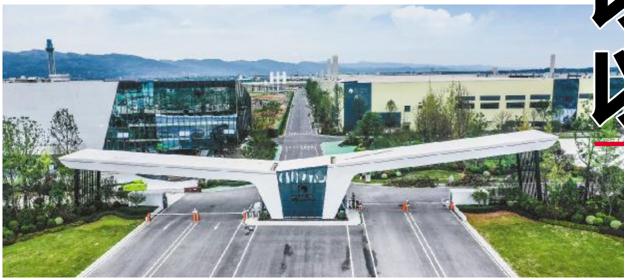
通威太阳能绿色工厂