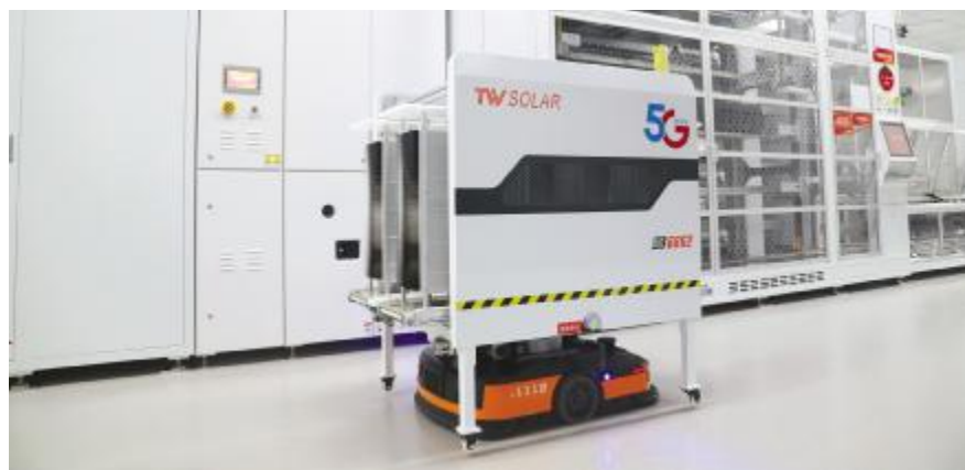
通威太阳能金堂基地5G智慧生产车间