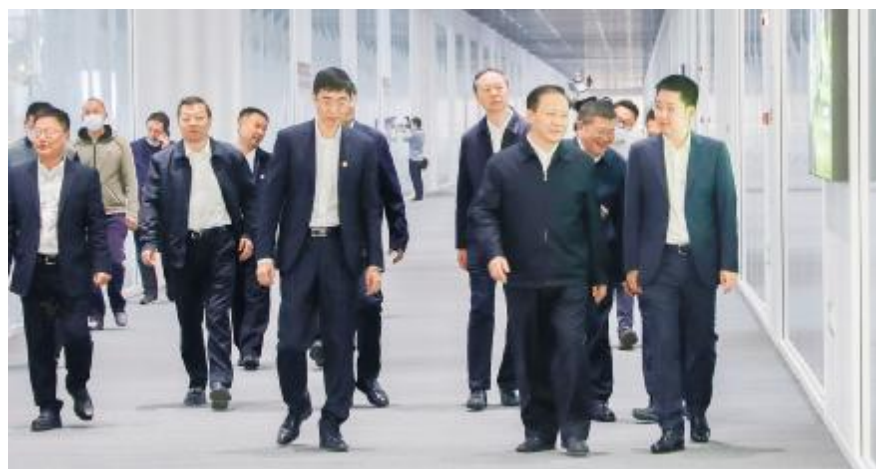
2021年3月29日,四川省委书记彭清华莅临通威太阳能眉山基地调研