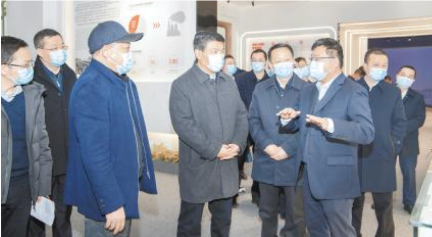
四川省政府副省长罗强调研通威太阳能眉山基地

四川省政府副省长罗强、四川省政协副主席赵振铎、人社部职业能力建设司副司长王晓君调研通威太阳能