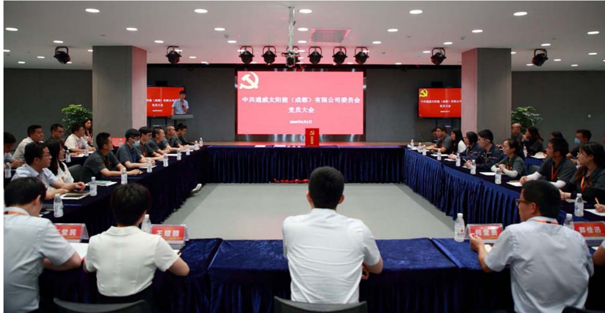
大会举手表决并通过第一届党委委员

本报讯(通讯员 徐璐璐)为进一步加强通威太阳能党建工作,发挥党组织的战斗堡垒作用,搭建贯彻落实党的路线、方针、政策宣传的主要桥梁,经中共成都市双流区委非公经济组织和社会组织工作委员会批准,中共通威太阳能成都公司支部委员会正式升格为中共通威太阳能成都公司委员会(以下简称“通威太阳能成都公司党委”)。