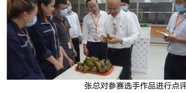
张总对参赛选手作品进行点评

本报讯(通讯员 刘凡 钟燕)端午佳节将至,在微风习习、龙舟竞渡、糯米飘香节日氛围里,为弘扬中华民族传统文化,通威太阳能成都、合肥、眉山三地工会组织开展了端午系列主题活动,表达对员工的关怀,同时感谢为公司发展而不辞辛劳坚守岗位的员工。