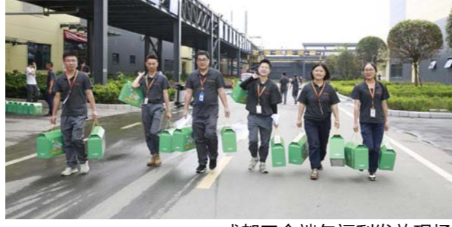
成都工会端午福利发放现场