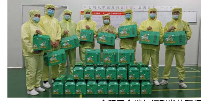
合肥工会端午福利发放现场