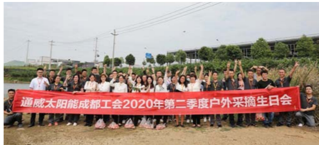
成都工会合影留念