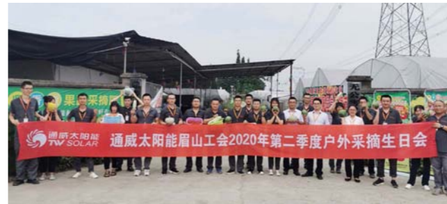
眉山工会合影留念

本报讯(通讯员 张瑜 徐璐璐)缤纷初夏,各地果蔬已迈入最佳采摘期,为丰富员工业余文化生活,提升员工幸福指数,进一步推进奋斗者关爱文化落地,6月12日,通威太阳能成都、眉山工会同步举行2020年第二季度户外采摘生日会活动,为第二季度的100余名寿星们送上了别样的生日祝福。