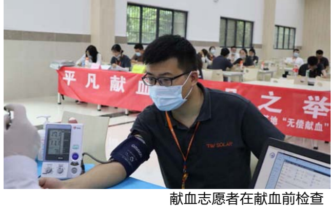
献血志愿者在献血前检查

本报讯(通讯员 程良)受新型冠状病毒肺炎疫情影响,近期合肥市献血量减少,血液采集困难,通威太阳能合肥公司积极配合合肥市中心血站,向身体条件允许的职工发出无偿献血倡议。6月10日,无偿献血活动在通威太阳能合肥公司举行,200余名员工踊跃报名参加。