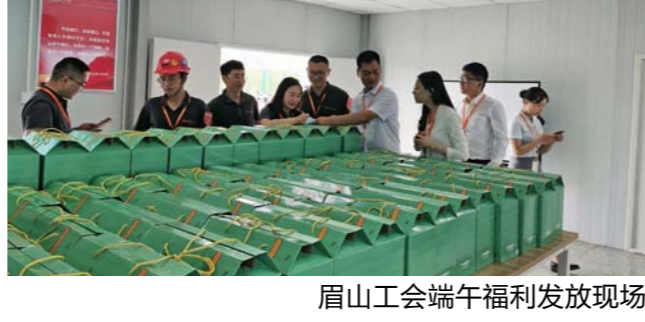
眉山工会端午福利发放现场