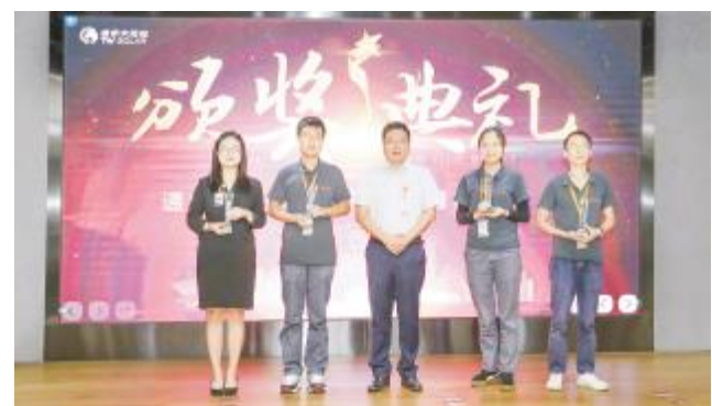
成都基地质量月辩论赛合影留念

本次质量月辩论赛,体现了员工的团队协作能力,锻炼了员工的心理素质,思维应变能力,不仅锻炼了辩手的辩论能力和团队之间的合作能力,展现了员工的时代风采,全面提高质量效益的主题,同时也有利于推动质量效益的全面提高。