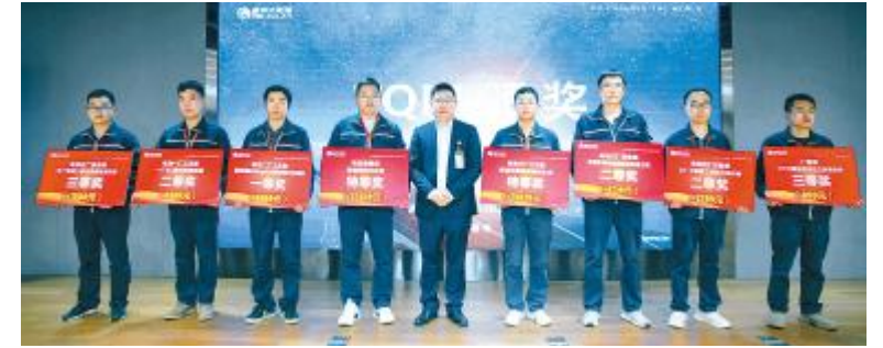
成都基地质量月颁奖仪式现场

通过本次质量方针再宣贯及多层次、多形式质量月活动的开展,通威太阳能从上至下,都充分体现出通威人对质量的卓越追求和在质量强国梦的路上从未停止的步伐。未来,通威太阳能将持续响应国家质量发展纲要号召,深入学习贯彻落实通威集团董事局刘汉元主席关于质量方针要求,大力弘扬质量文化,为保卫蓝天白云,绿水青山贡献力量。