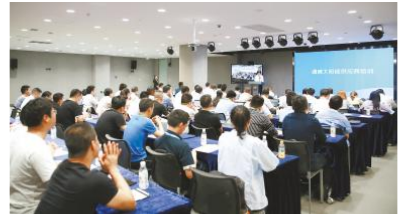
通威太阳能 2020 年供应商培训大会成都基地现场

培训围绕供应商管理的“目的、原则、内容”为核心,对全生命周期管理的相关板块做了系统性、全方位的分析 and 讲解,展示了通威太阳能供应商管理特色。质量部SQE从“管”与“控”的角度,分析了当前通威太阳能质量管理现状,在明确公司质量要求的同时,也提出了各项切实有力的质量保障措施。