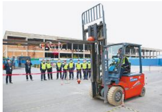
通威太阳能合肥公司叉车技能竞赛现场

2020年,通威太阳能将用“通威速度”、“通威效率”攻坚克难,用力争朝夕的精神描绘“通威画卷”,心怀希望、激情满怀,勇担责任、脚踏实地,敢想敢闯、敢干敢拼。继续大力弘扬工匠精神,着力打造一流的通威太阳能专业技能队伍,以更加坚决的执行力,不畏挫折压力,敢于拿下山头,不断追求卓越,一路向前,为打造成为世界级清洁能源企业而努力奋斗!