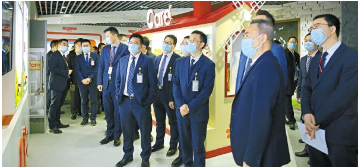
通威太阳能中高管团队走进好主人公司