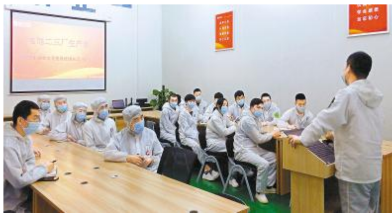
合肥公司生产体系员工开展“贯彻刘汉元主席讲话精神”主题学习沙龙现场

就是每一个员工都以公司的利益为出发点,坚决执行公司的每一项决策,严格执行公司的制度、流程,服务好内部客户,巩固竞争优势,确保领先地位的重要意义。正如在通威太阳能学习刘主席讲话的专题学习会上,谢毅董事长指出的那样:公司各部门要以问题为导向,树立全局意识,解决问题或者推动问题解决,通过领悟刘主席讲话,学习好主人经验,通威太阳能全体员工要振奋精神、高效执行,助力公司持续高质量发展! 以谢毅董事长的深刻解读为指引方向,通威大学光伏学院将持续深化公司企业文化建设工作,不断创新企业文化建设模式,助力各体系持续开展以执行力为核心指导思想的2020年度企业文化建设,并指导和督促各部门设计快速推动工作的计划和监督方式,以实现公司提升效能,平稳度过市场危机,持续行业领先。