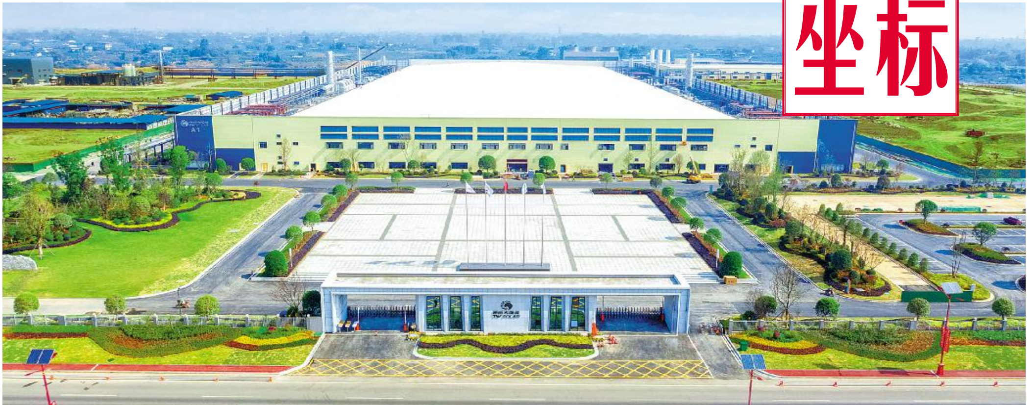
通威太阳能眉山公司厂区