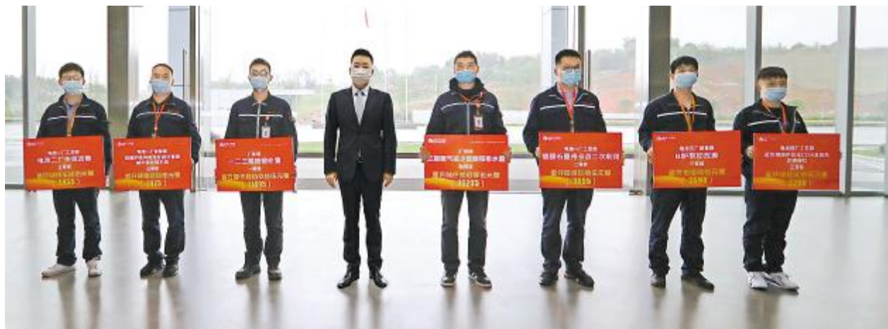
通威太阳能合肥、成都两地2020年第一季度TQM颁奖仪式现场