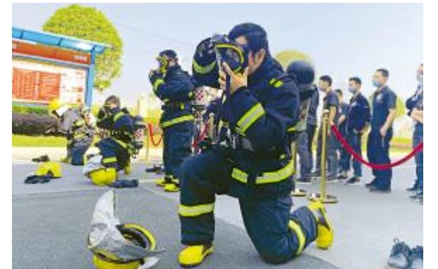
通威太阳能成都公司消防技能竞赛现场