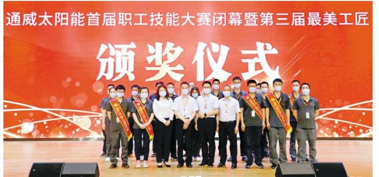
通威太阳能成都公司首届职工技能大赛暨最美工匠选拔赛颁奖仪式现场