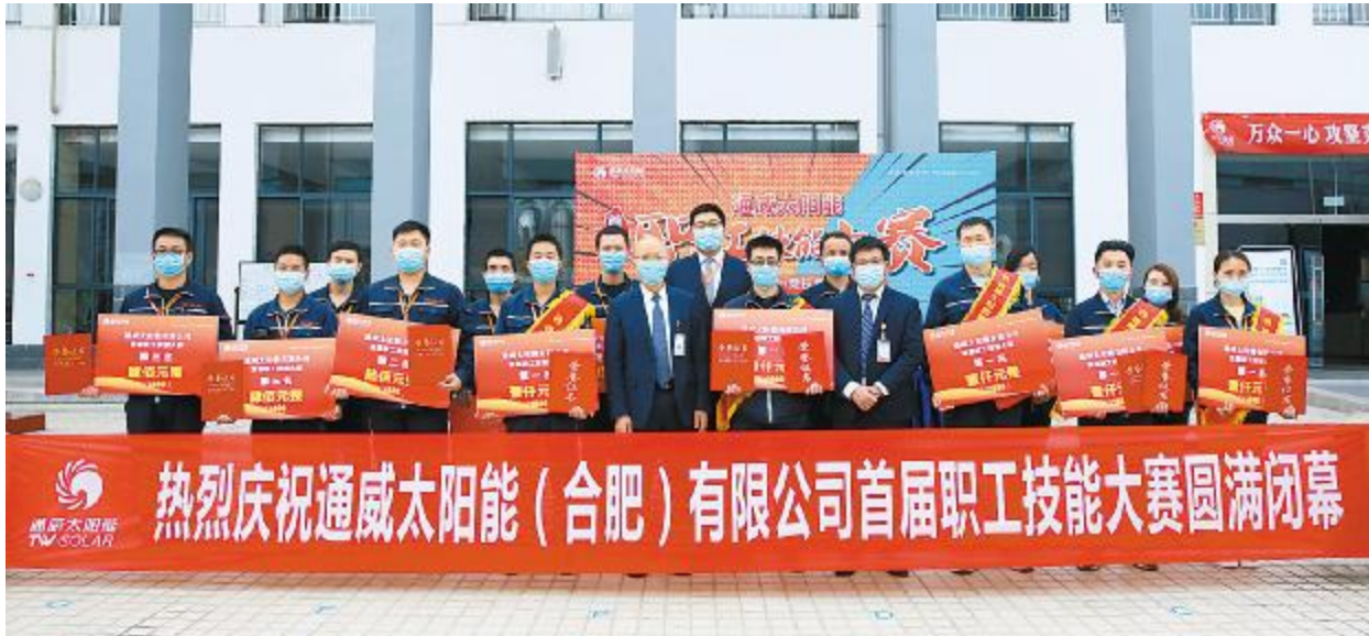
通威太阳能合肥公司首届职工技能大赛暨最美工匠选拔赛颁奖仪式现场