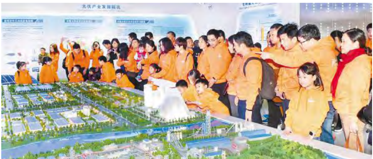
“通威·梦想·家”第三届家庭同乐日活动中,员工及家属参观通威体验中心

在朗读比赛中,102位来自公司各岗位的朗读者们或铿锵激昂、或满怀深情,将无声的文字用真挚的情感诉说。《通威集团企业文化故事集》中的感人故事、《那些年,我们在一起的日子》中的精彩文章都备受选手们的青睐,独具风格的原创作品也在现场赢得阵阵掌声。