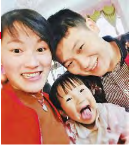
第三届“最美家庭”摄影比赛参赛作品