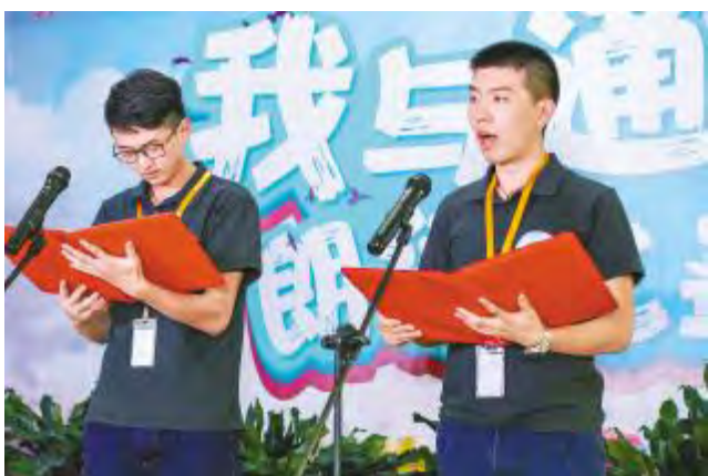
“我与通威”朗读比赛

2017年是建设企业文化2.0时代的关键一年,面临全球光伏市场竞争的新形势、新机遇、新挑战,通威太阳能公司继续发扬把通威文化琢磨透,学好用好的精神,积极开展文化相关活动,对内讲好通威故事,传播好通威文化,凝聚好员工共识。