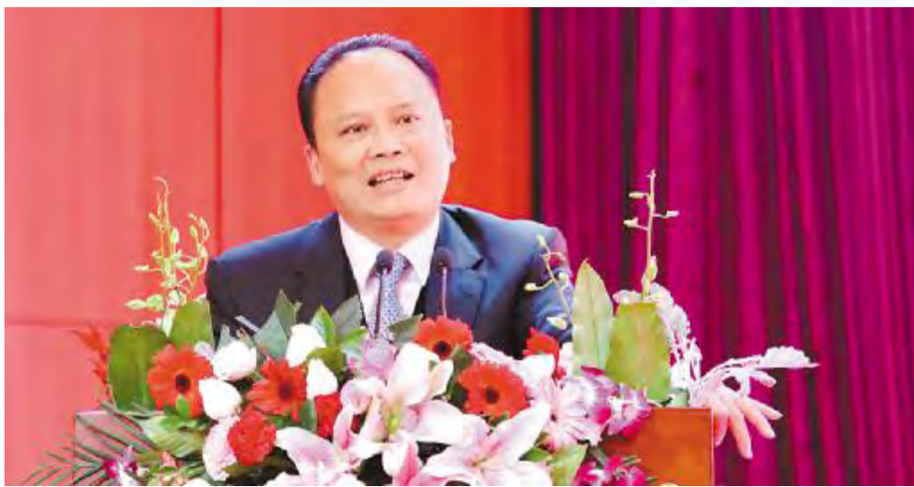
十一届全国政协常委、通威集团董事局刘汉元主席作重要指示