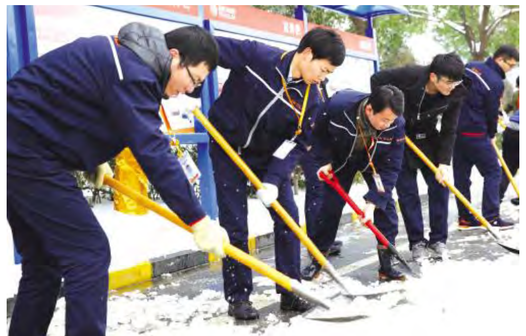
车间人员清扫主干道道路积雪

突发情况。各部门生产车间于班前、班后会多次宣贯出行安全及注意事项,安排各生产经理联合生产班长在雨雪天气定时巡检车间外围配电柜等动力设施是否存在积压变形等隐患。通威太阳能合肥公司倾百人之力保障厂区两千余人的工作、出行安全,清扫积雪3万平方米,出动应急除雪车16台次,播撒融雪剂3吨,及时清理厂区积雪,保障了全厂员工的正常工作及生活、出行,将安全生产进一步落实、强化。