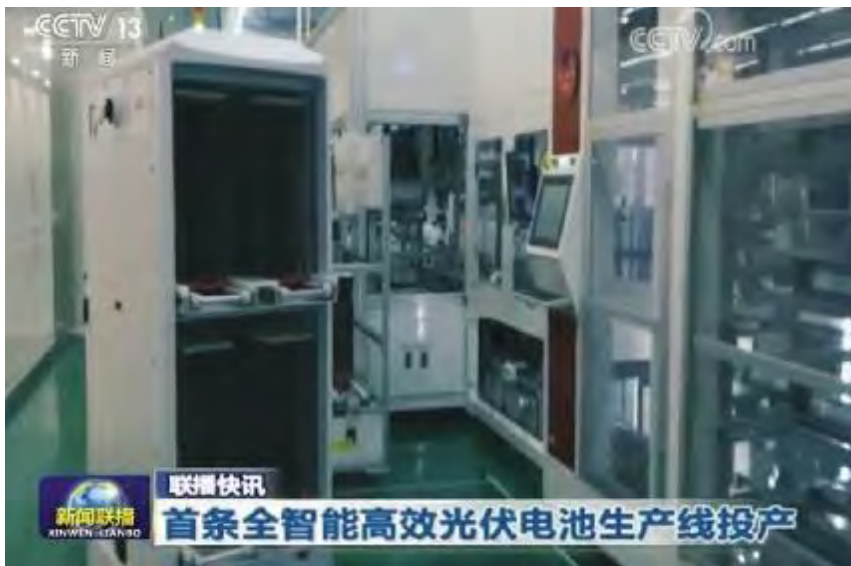
《新闻联播》播出通威太阳能世界首条工业4.0高效电池生产线投产画面