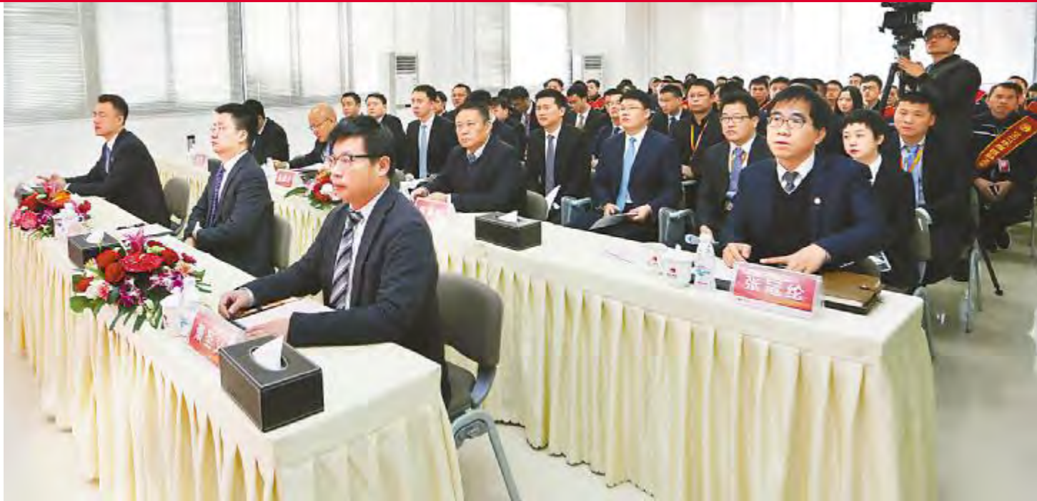
通威太阳能成都公司表彰大会现场