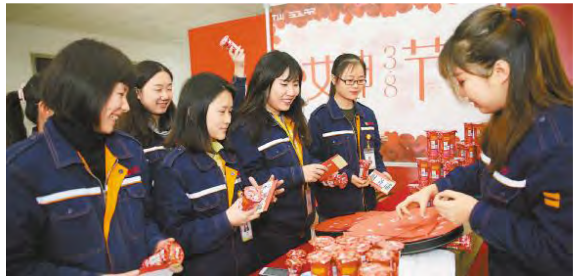
妇女节中,温情满满的礼品派发现场