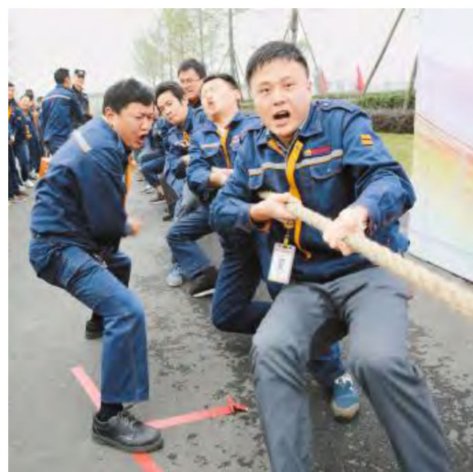
拔河比赛中,员工们斗志昂扬

今年以来,通威太阳能相继开展了“我与通威”朗读比赛、拔河比赛、篮球友谊赛以及沙拉、月饼试吃等活动,为员工提供了相互交流与竞技的平台,展现自我风采的机会,丰富了员工的业余生活,增强了员工凝聚力与责任感。