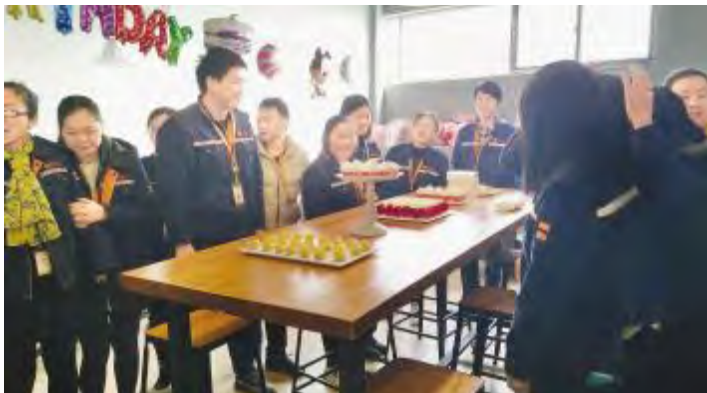
2017年员工生日会活动

通过以“家”文化建设系列活动,员工在家人团聚、共享天伦的同时,通威的家属们也进一步了解了通威的发展和亲人工作的意义,提升了员工的归属感,增强了从员工“小家庭”到通威“大家庭”的凝聚力,为公司发展提供有力的精神动力和文化支撑。有了通威家人们的坚强后盾与支持,通威太阳能在未来的发展中必将再创辉煌。