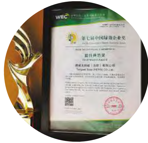
通威太阳能获“中国绿效企业奖·最佳典范奖”

中国绿色低碳发展、取得绿色效益的发展型企业进行评选,通过专家评审、社会调研、调查问卷等严格的评选环节,选出对以低碳理念履行社会责任的最佳表现者。作为中国新能源事业的重要推动者,通威太阳能始终践行绿色节能理念,秉承追求卓越、奉献社会的宗旨,在不断追求产品卓越性能及质量的同时,更积极履行作为企业公民的社会责任,注重产品的节能减排和绿色环保。据悉,同期获奖的企业有伊利集团、恒安集团、中国平安等十余家国内知名企业。