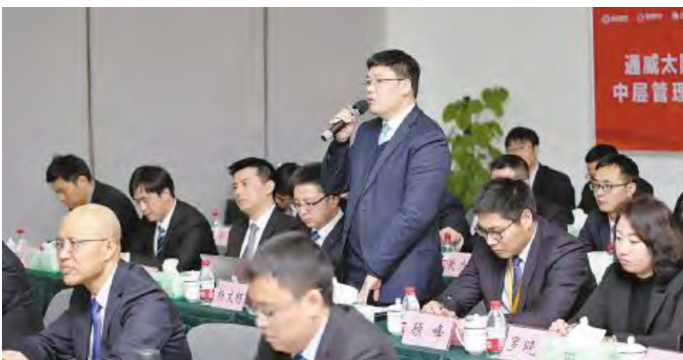
2017年度述职大会现场,管理干部踊跃发言

“2018年大家铆足干劲儿,好好干!”谢董事长勉励大家,面对更加复杂的市场环境,一定要坚定信心,以平稳的心态、昂扬的热情在2018年强化内控,强化管理,从自我做起,以一流的行业水平及高效的管理能力直面更为严峻的挑战!