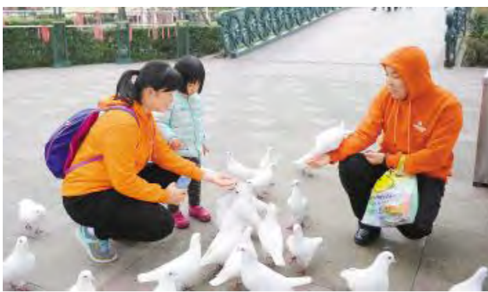
家庭同乐日活动中,员工及家属在国色天香游玩

通威太阳能公司提倡以企为家,高度重视“家”文化建设,积极构建以关爱员工为核心价值的关爱文化,开展了家庭日、员工生日会、家书送祝福、“最美家庭”摄影比赛等一系列活动。