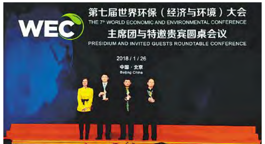
通威太阳能精彩亮相第七届世界环保(经济与环境)大会

标和人才结构等方面的综合评估。这一殊荣的获得,是对公司研发和技术创新能力的充分肯定,更是对公司持续发展的一种鞭策和激励。未来,通威太阳能将朝着“全力打造世界级太阳能光伏企业和世界级清洁能源公司”的目标不断砥砺前行!据悉,获得本次“国家高新技术企业”还有阿里巴巴、中铁二局等国内知名企业。