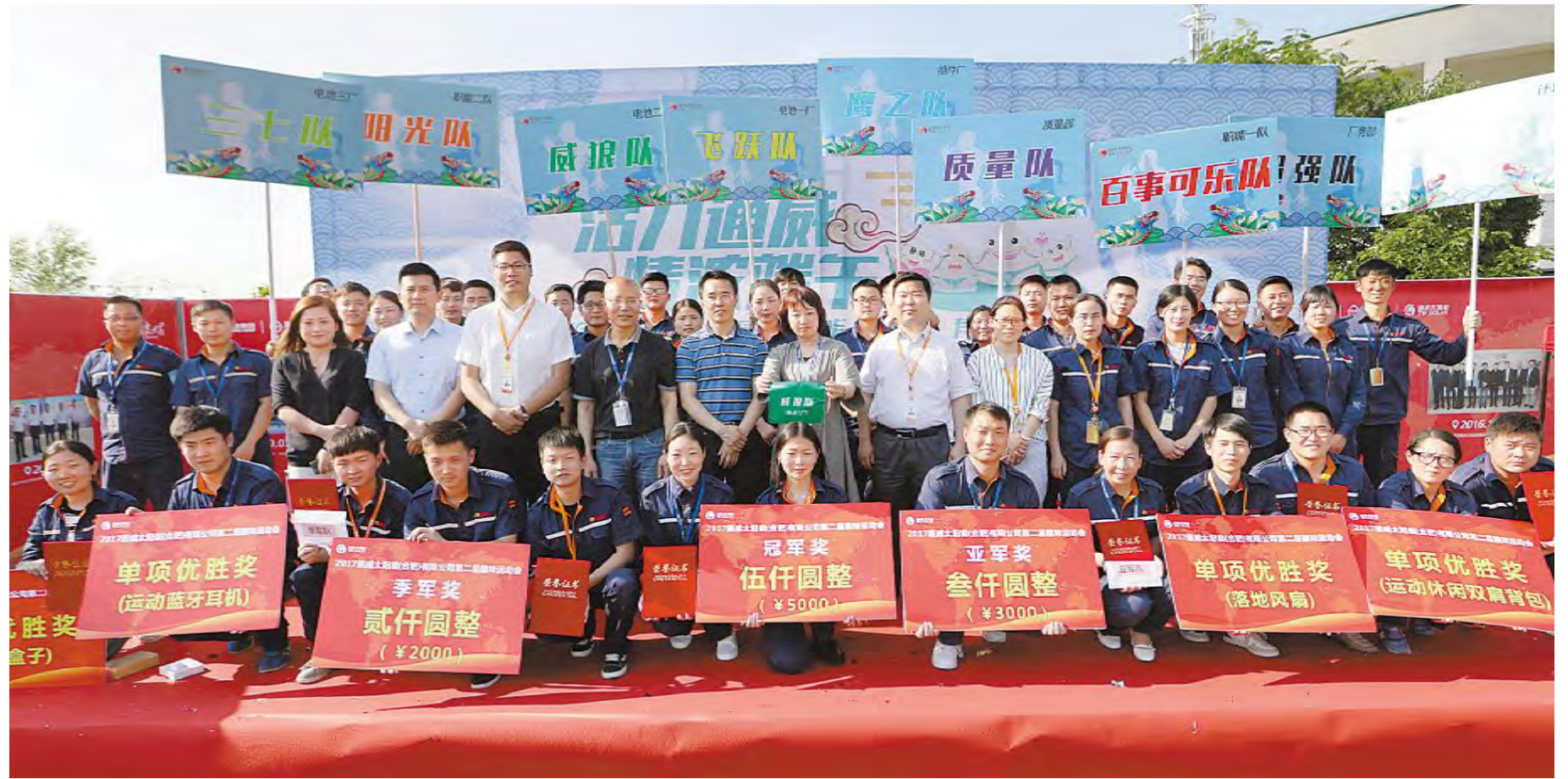
通威太阳能“活力通威 情浓端午”趣味运动会参赛团队合影