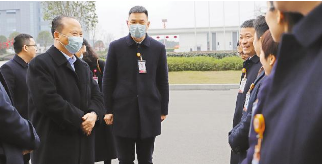
刘汉元主席视察通威太阳能眉山基地,并与中高管团队亲切交流