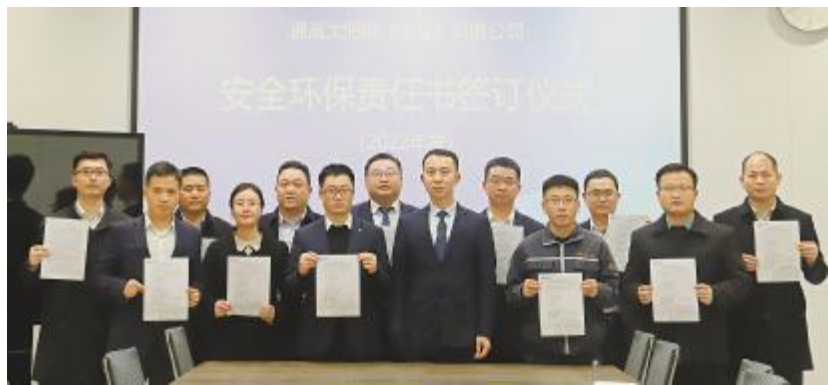
金堂基地安全生产委员会签订2022年度安全环保责任书