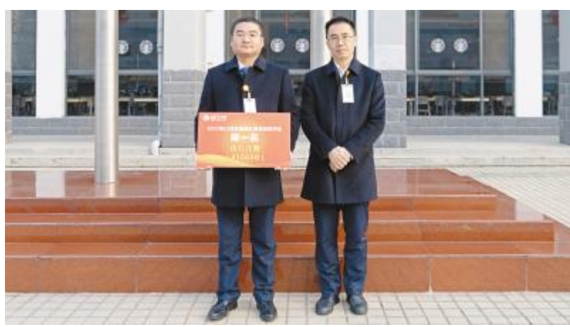
“争先创优”中,合肥基地电池一厂荣获多晶团队第一名