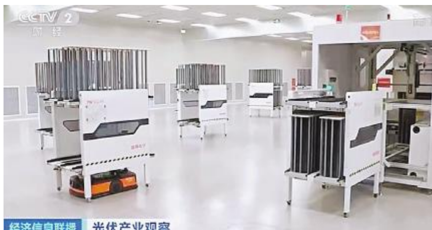
央视财经频道《经济信息联播》播出通威太阳能眉山基地生产画面