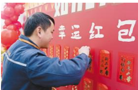
如意吉祥的红包贴满墙