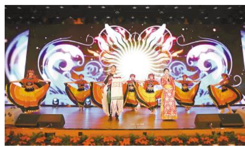
歌曲《不要怕》展现出多姿多彩的少数民族文化