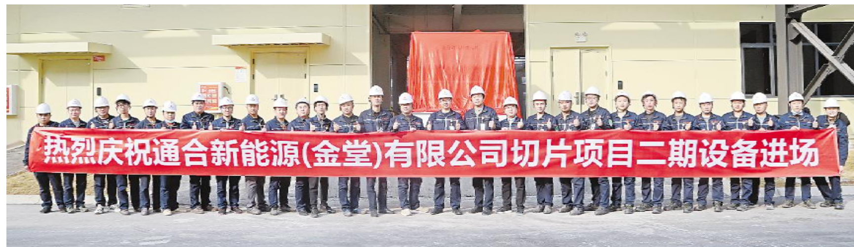
通合新能源切片项目二期设备进场