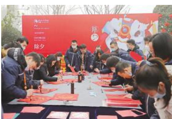
一句句美好的新春祝福跃然纸上