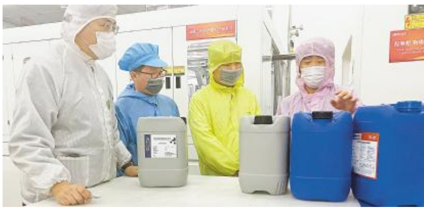
合肥基地开展2022年度首次PFMEA联合巡检

金牛辞旧岁,灵虎迎新春。又是一年春好处,通威太阳能全体干部员工铆足干劲,全面高效推进项目建设、人才队伍建设、安全生产建设等工作,为实现2022年新目标全力奋进。