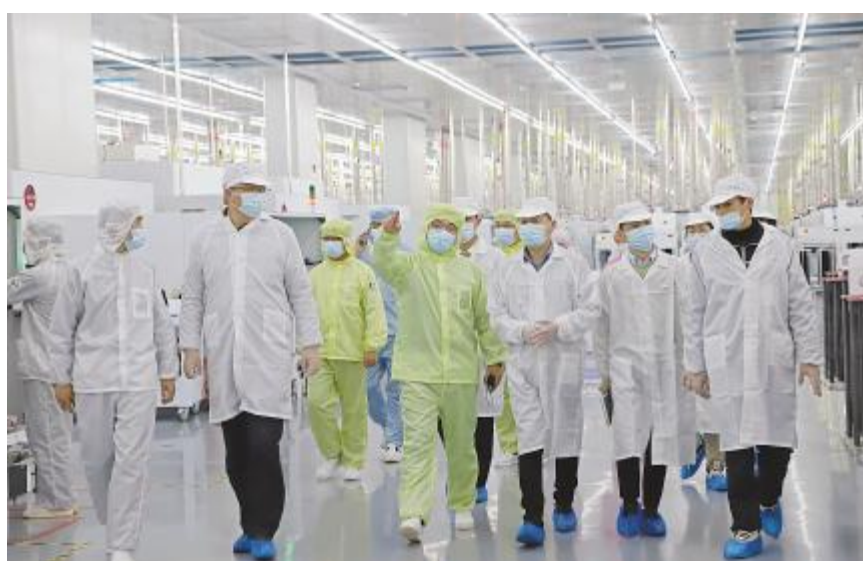
晶科能源审核组莅临通合新能源开展供应商新基地导入审核工作