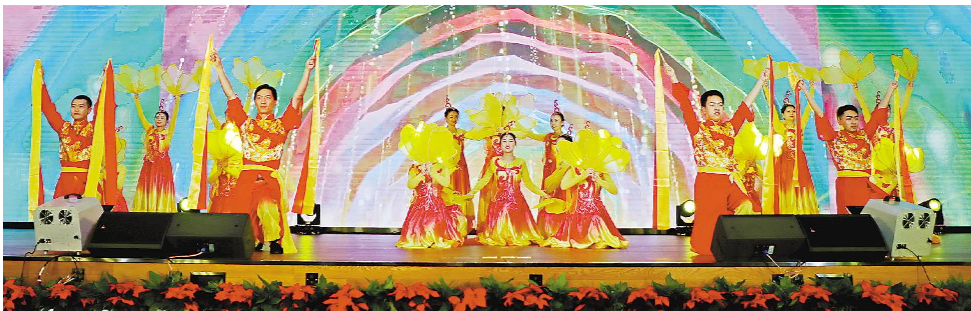
舞蹈《盛世花开》,迎来幸福吉祥年