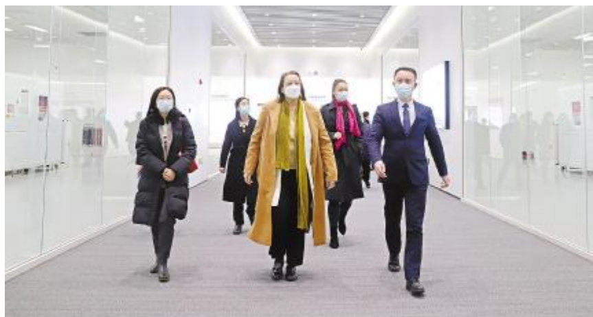
瑞士驻成都总领事馆总领事高凯琳参观金堂基地智能制造生产车间

调研组纷纷表示,希望通威太阳能持续发力,继续做好绿色发展工作,坚定不移走创新驱动发展之路,发挥好行业龙头引领作用,吸引带动更多绿色制造企业集聚发展,助力区域协调发展,为实现碳达峰、碳中和目标贡献力量。