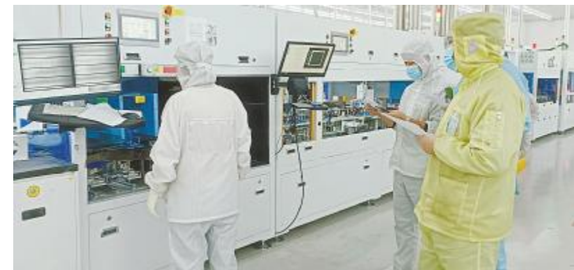
2021年终员工综合技能评定,眉山基地实操现场

截至目前,已在五年内共计组织开展9次评定,获评总人数已远超10000人。值得一提的是,本次评定在各基地各部门的大力支持下,从等级评定标准、试题结构及比例、参评条件、津贴分值全方面进行了升级,进一步激发了员工不断提升和参与评定的积极性,员工纷纷表示,公司各项人才发展机制越来越完善,既充分考虑了员工的发展诉求,也契合了公司“拓宽职业通道、提升技能水平”的政策导向。