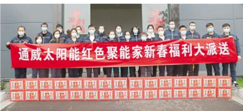
新春福利派送现场合影留念