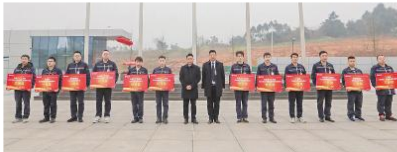
2021年第四季度TQM颁奖仪式双流基地合影留念

2022年,通威太阳能将按月持续开展“争先创优”团队评比,将对标文化落实到基层工作中,持续不断降本增效,为了经营目标达成不懈奋斗,全力助推公司高质量发展,在电池片赛道书写新的辉煌!创造新的奇迹!