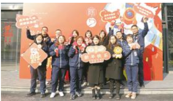
员工共同留下新春合影