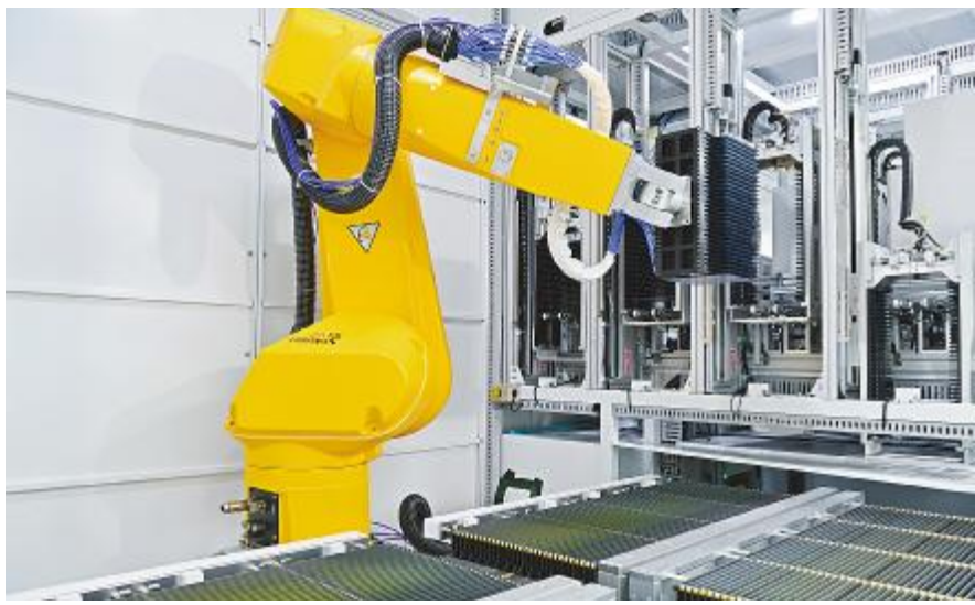
通威太阳能智能制造生产线

1月19日,光伏产业权威分析机构PV InfoLink正式发布2021全年电池片出货排名,通威太阳能总出货量稳居榜首。这是公司自2017年首次荣登榜首以来,连续五年蝉联电池片出货量排名第一,充分彰显了通威太阳能高质量稳健发展的强劲实力。