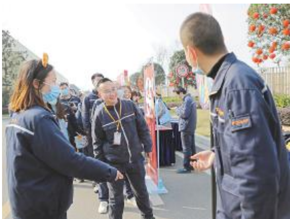
幸运大转盘转出福气

此外,为了让坚守岗位的员工过一个安心年,春节期间员工食堂为全体员工提供人均每日近百元标准免费就餐。“年味深处即是家,一桌好菜就是年”,腊味、肘子、红烧肉、烤鸭、蹄花、小炒鸡等菜品美味升级,丰富的年夜饭让他乡如故乡,大家团聚在一起,互相致以新春问候,浓厚的新春氛围中传递了公司节日的关怀。温情满满的新春特别活动、丰盛的新春菜单、多样的新春福利等一系列举措让浓浓年味暖人心,通威太阳能致力于以人文关怀提升员工幸福感和凝聚力,让坚守不再孤单。此心安处,便是吾乡。