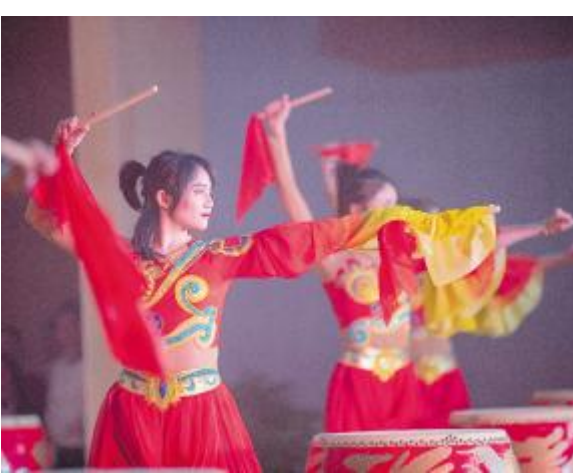
铿锵有力的开场舞蹈《雕龙鼓舞》