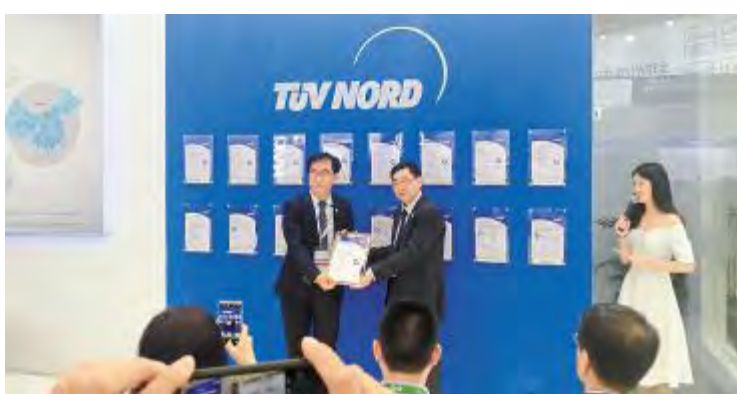
2018 年 5 月 28 日,通威太阳能获全场首张叠瓦新标准认证证书