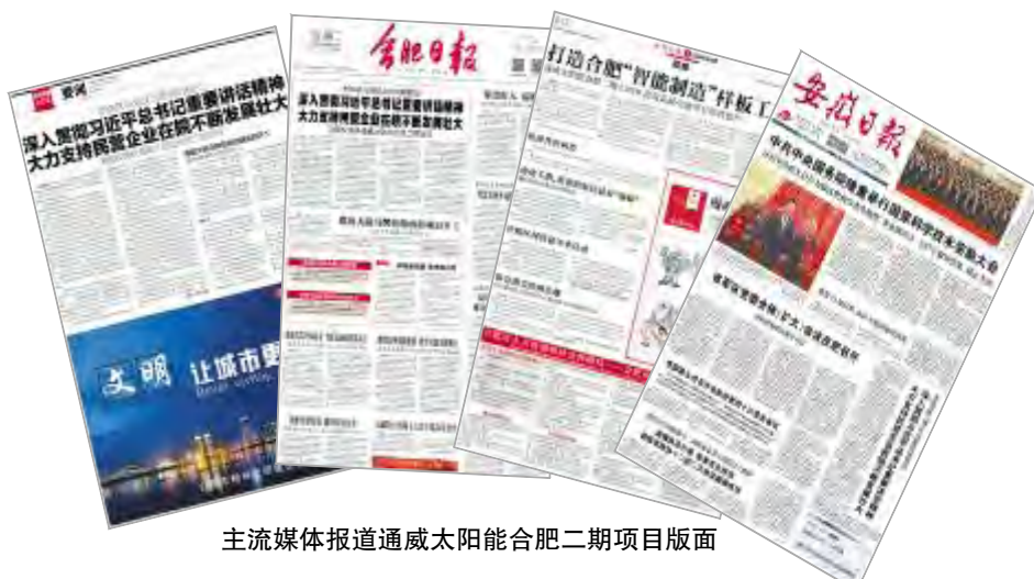
主流媒体报道通威太阳能合肥二期项目版面

1月8日,安徽卫视《新闻联播》播出安徽省委书记李锦斌与刘汉元主席座谈专题报道。1月9日,《安徽日报》在头版推出题为《李锦斌与刘汉元座谈时指出 深入贯彻习近平总书记重要讲话精神 大力支持民营企业在皖不断发展壮大》报道,并指出,支持民营企业在皖不断发展壮大是党委、政府义不容辞的责任。安徽将坚定不移贯彻习近平总书记中央经济工作会议、民营企业座谈会上的重要讲话精神,积极解决融资难融资贵问题,真正把支持政策落实好。刘汉元主席表示,习近平总书记民营企业座谈会上的重要讲话,给广大民营企业企业家吃下了定心丸。安徽发展潜力巨大,通威集团将继续加大高效晶硅电池、光伏发电、“渔光一体”等项目推进力度,为安徽生态文明建设、经济高质量发展贡献力量。1月10日,《合肥日报》、《合肥晚报》、《江淮晨报》也纷纷