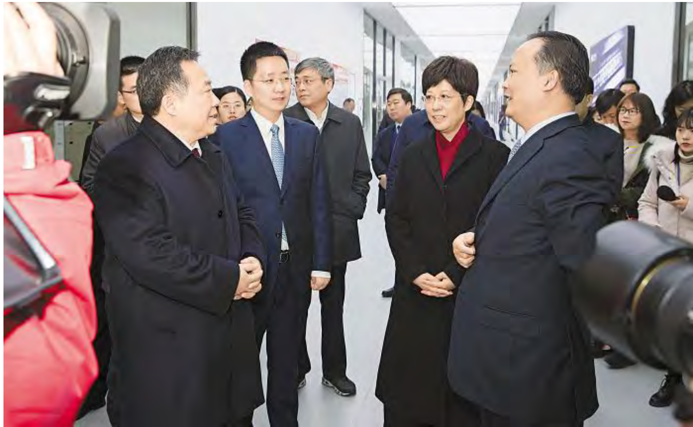
安徽省委常委、合肥市委书记宋国权,合肥市委副书记、市长凌云调研通威太阳能合肥二期项目

2019年1月8日,新年伊始,万象更新。中国光伏产业发展再传捷报,通威太阳能合肥二期2.3GW高效晶硅电池项目主体工程已全部完成,项目正式进入“投产倒计时”。2019年,通威太阳能再开工8GW高效晶硅电池项目,进一步巩固全球晶硅电池企业龙头地位。