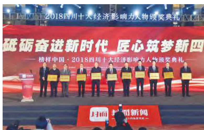
通威太阳能成都三期项目投产入选“2018四川十大经济影响力事件”

通威太阳能也将积极推动制造业转型升级,大力推进数字经济发展,充分发挥试点企业典型引领作用,构建全面管控体系,推进管控落地,提升运营效率,提高产品质量的可追溯性。