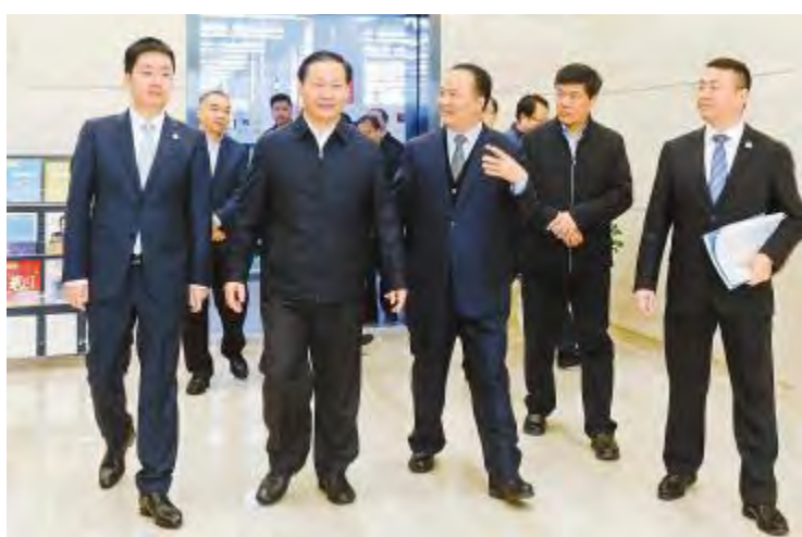
2018 年 11 月 14 日,四川省委书记彭清华调研通威太阳能成都公司