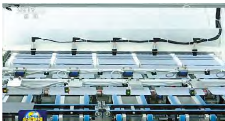
2018 年 11 月 21 日,通威太阳能作为四川优秀民营企业代表,三期项目再获央视《新闻联播》聚焦