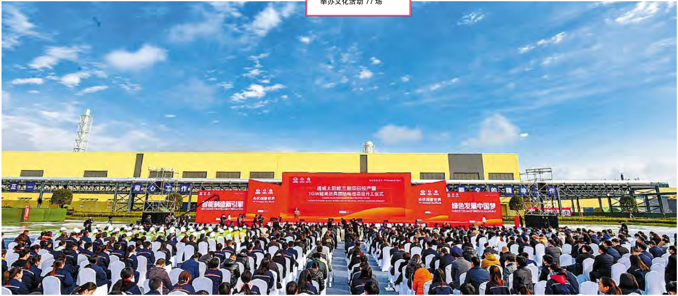
2018 年 11 月 18 日,通威太阳能三期项目 1GW 高效异质结电池项目开工仪式隆重举行

绿色发展的理念、勇于创新的精神、青春朝气的团队、智能制造的先锋,回顾通威太阳能 2018,一个个关键词展示着通威太阳能一年来发展取得的成绩与荣光,成绩的取得离不开刘主席