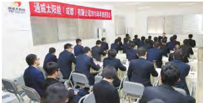
成都公司述职大会现场

本报讯(通讯员 雍宗虹)1月9日、11日,通威太阳能2018年度述职大会暨2018年度总结大会分别于合肥、成都两地公司顺利召开,通威太阳能董事长谢毅及高管团队现场出席两地会议。