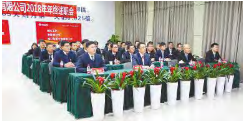
合肥公司述职大会现场