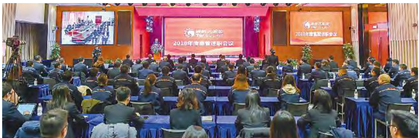
通威太阳能 2018 年度高管述职会议现场

会议由集团人力资源部部长杨继成主持。通威太阳能副总经理周华、副总经理张忠文、首席财务官周丹、成都基地总经理萧圣义、合肥基地总经理谢泰宏分别汇报了各自分管体系2018工作总结及2019年目标计划。