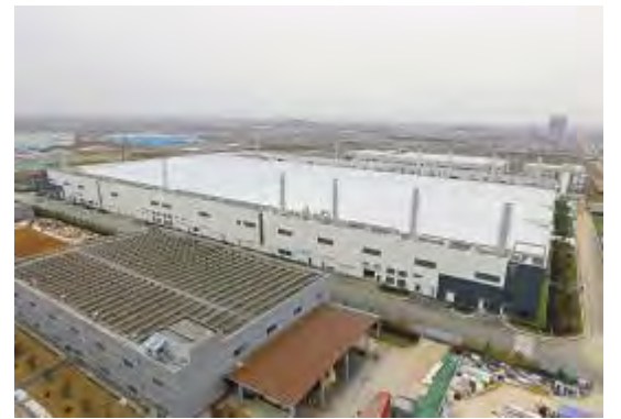
2019年1月8日,通威太阳能合肥二期项目主体工程建设完工