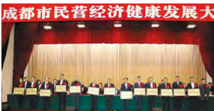
2018 年 11 月 24 日,成都市民营经济健康发展大会隆重召开,通威太阳能成都公司荣获“成都市百强民营企业”荣誉称号