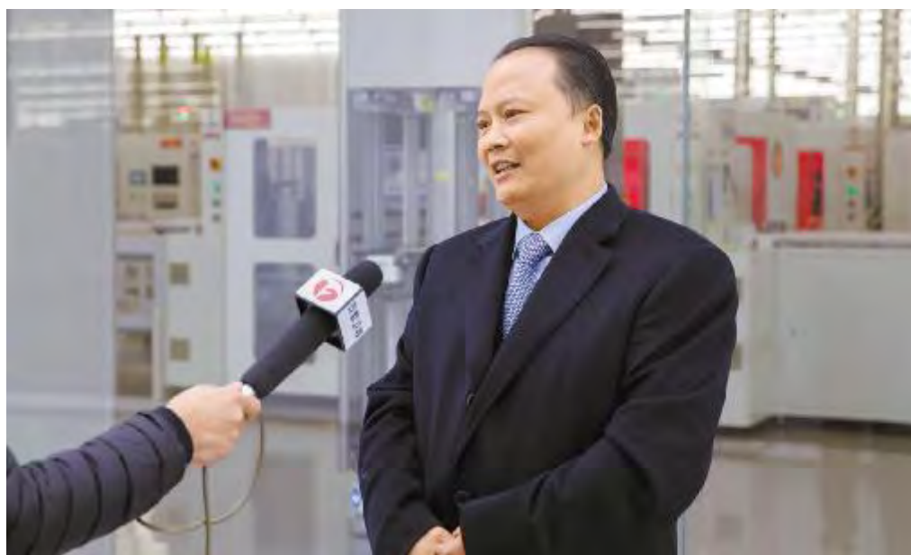
安徽卫视《新闻联播》专访刘汉元主席

通威太阳能在成都、合肥两大晶硅电池生产基地,目前产能总规模超过13GW,已成为全球最大的晶硅电池生产企业。