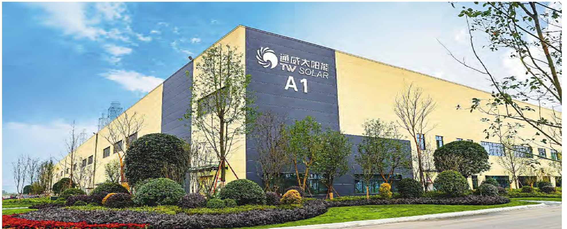
通威太阳能成都三期A1车间