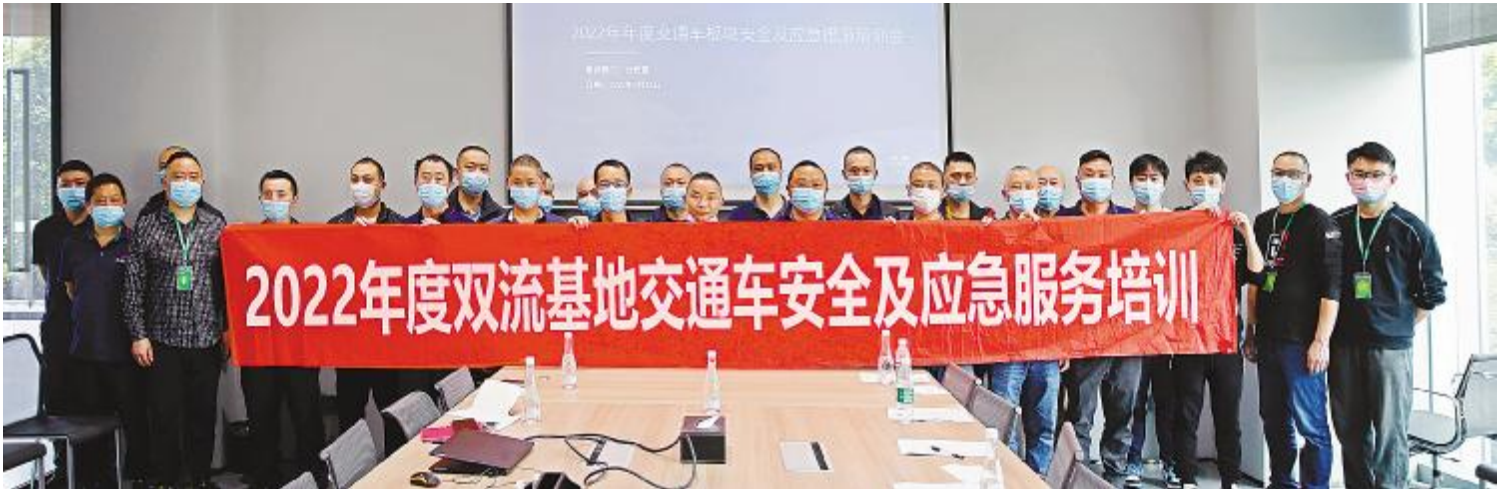
交通车安全及应急服务措施培训合影留念