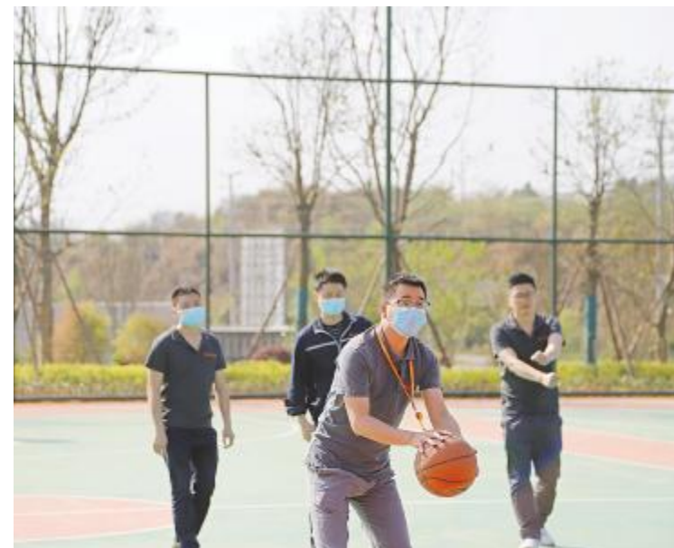
趣味投篮赛参赛选手花式投篮