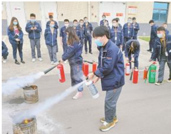
新员工消防实操培训