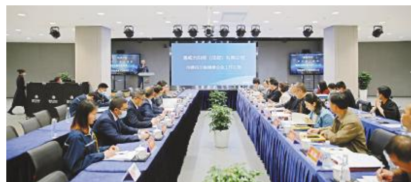
四川省健康企业评审现场

通威太阳能双流基地将始终把员工健康安全放在首位,有效落实各项健康工作,定期开展职业健康体检、福利健康体检及开展健康评估,持续开展行政服务满意度调查,从员工的吃、住、行等多方面做到真正关心、关爱员工,提高员工健康意识、健康素养,提升员工归属感、认同感、获得感,为公司实现高质量发展提供坚实动力。