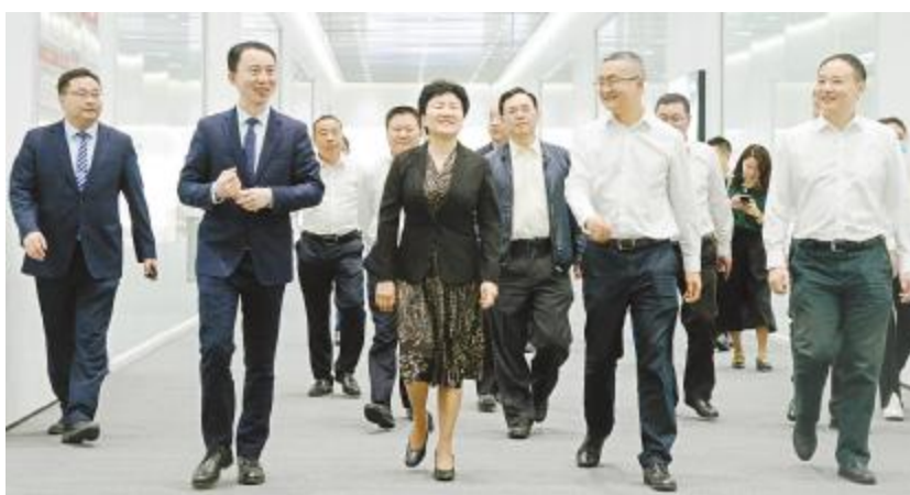
成都市人大常委会党组书记、主任包惠调研金堂基地

本次电池项目二期第一片下线作为通合新能源发展历程中又一里程碑,标志着通合新能源在建设智能化、数字化工厂、光伏绿色小镇上的重大进步,同时也将进一步扩大公司高效太阳能电池片产能规模,提升产品技术水平、自动化水平等核心竞争力。未来,公司将定位清晰,始终秉持可持续发展理念,紧抓绿色发展机遇,为实现“光伏改变世界”的使命砥砺前行!