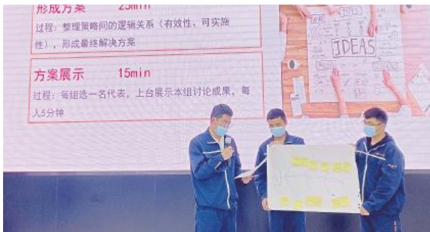
技术沙龙研讨会学员进行方案展示