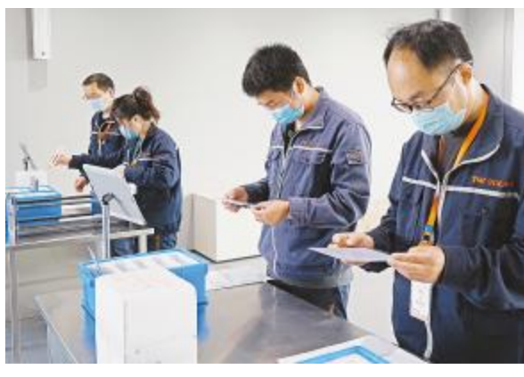
第三届半导体芯片制造工企业技能等级认定证书实操现场