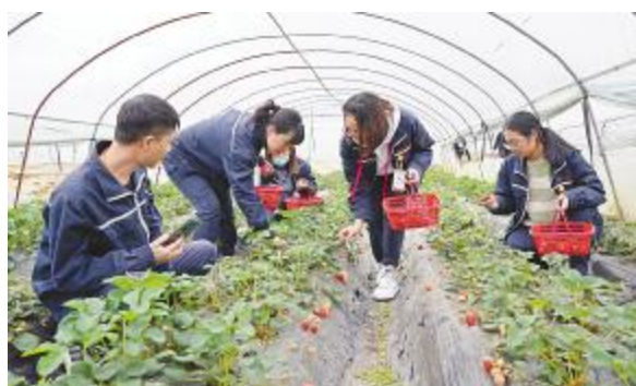
双流基地草莓采摘现场