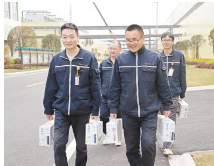
员工幸福地拎着工会发放的牛奶