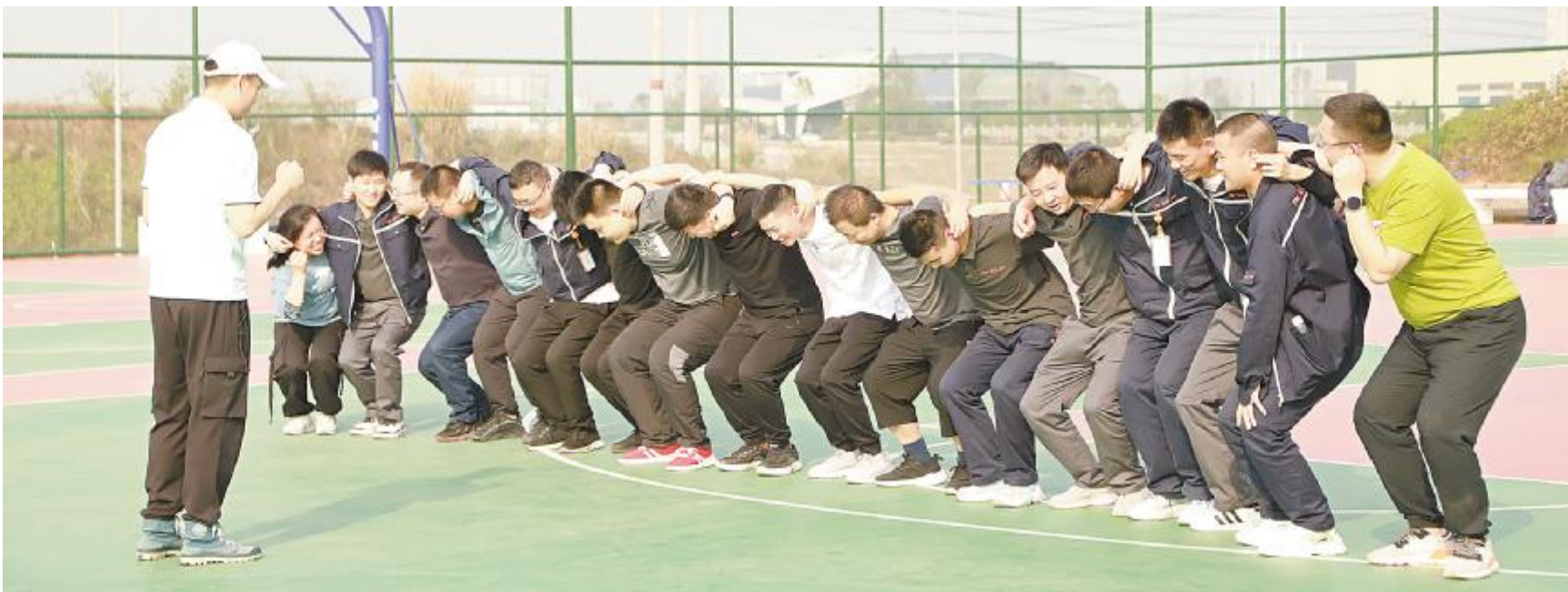
通合新能源精英团队2022年素质拓展活动