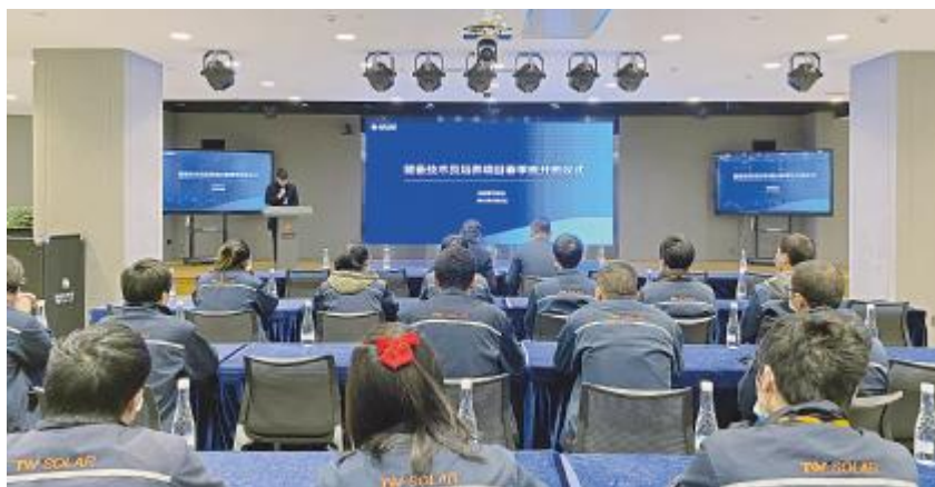
2022年储备技术员春季班开班仪式现场

2020年9月,通威太阳能双流基地成功荣获首批成都市职业技能等级认定试点企业,获批半导体芯片制造工及设备点检员两大工种。3月9日,通威光伏学习中心创新认定方式,将技能等级认定与运行6年之久的技术等级评定工作相结合,成功组织开展第三批半导体芯片制造工企业技能等级认定证书考试,共计284人参考考试,通过率100%。 企业的发展离不开人才,如何做好人才评价和培育是重中之重,为满足生产管理需求,通威太阳能双流基地不断调整创新技能培训、技能考核评价方式,坚持与时俱进,坚持国家标准与岗位要求相结合,认定内容与生产实际相结合,职业资格认定与薪酬待遇相结合,摸索出一套由核心能力评价、工作成果业绩评价、生产现场能力考核和理论知识考试四大模块构成的企业高技能人才评价模式。 未来,通威光伏学习中心将坚定不移,以同导标准为基础,不断完善技能认定硬件设备,开发技能认定软件系统,提升技能认定的软硬实力,以满足公司和社会对职业技能等级认定的变化需求,继续充实自己,完善自我,提升自我,建立更加完善的人才标准及人才评价体系。