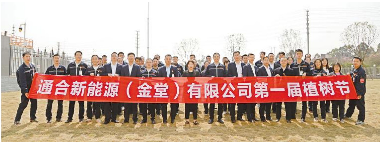
通合新能源第一届植树节合影留念