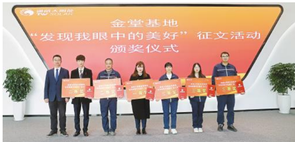
“发现我眼中的美好”主题征文活动颁奖现场