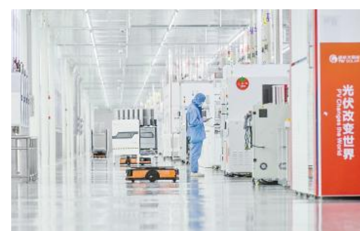
通威太阳能智能制造生产车间

“双碳”战略、省绿色低碳优势产业发展部署及“1+3”主导产业发展方向,继续加大眉山基地投资规模,继续扎根眉山发展,为眉山制造强市,建设成都都市圈高质量发展新兴城市贡献更多通威力量。 胡元坤书记指出,眉山要把进城入圈的主攻方向、追赶崛起的核心支撑、转型提质的根本出路放在制造业上,不断夯实制造业这个根基,让眉山长远发展有更深沉更持久的动力。全市上下要按照一年突破、两年攻坚、三年冲刺的目标,以首战必胜的决心,抓住关键、集中火力,坚决打赢制造强市第一仗,力争制造强市突破年首战首胜。