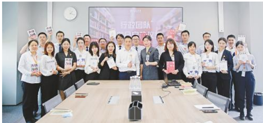
双流基地行政团队读书会启动仪式现场

通威太阳能双流基地行政团队将继续努力,不断提升,围绕“主动服务、微笑服务、过程服务、结果服务”的服务理念,打造更高质量的服务团队,坚持将“您的满意,我们的追求”作为行政工作的宗旨,为公司实现高质量发展提供有力的后勤保障与支持。