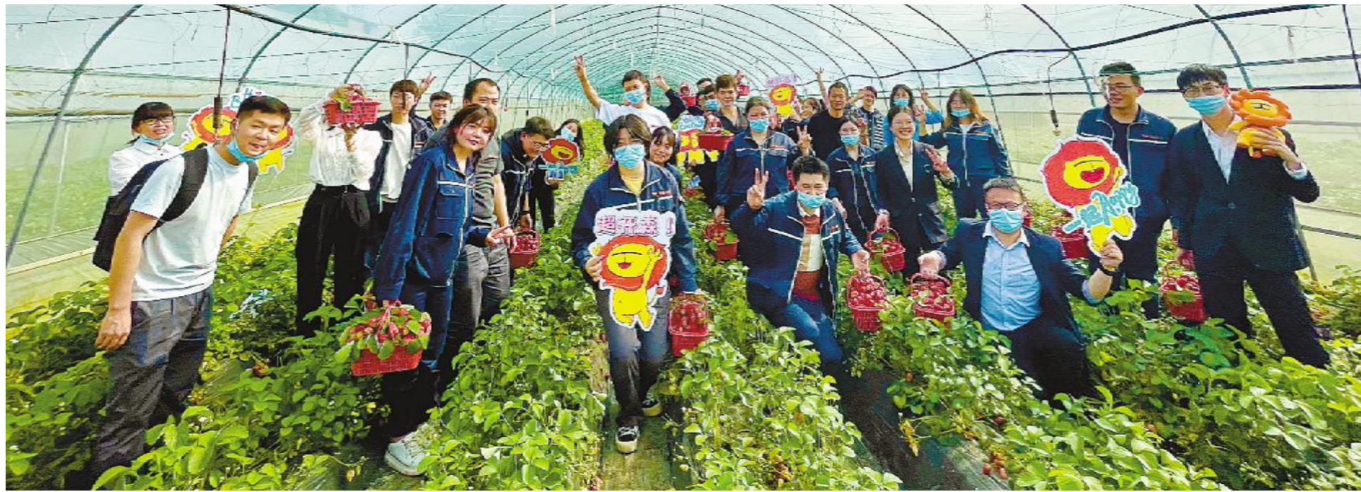
寿星齐聚共度美好时光

拥抱美好春光,享受奋斗时光。为弘扬奋斗者文化,让员工感受到通威太阳能满满的关怀,通威太阳能组织开展第一季度员工主题生日会、“发现我眼中的美好”主题征文活动、素质拓展活动和篮球社团启动仪式及“一盒牛奶”关爱行动,通过实实在在的员工关怀福利,不断增加员工归属感和幸福感,为企业的快速发展和员工成长作出积极贡献,让员工感受到“家”的温暖。