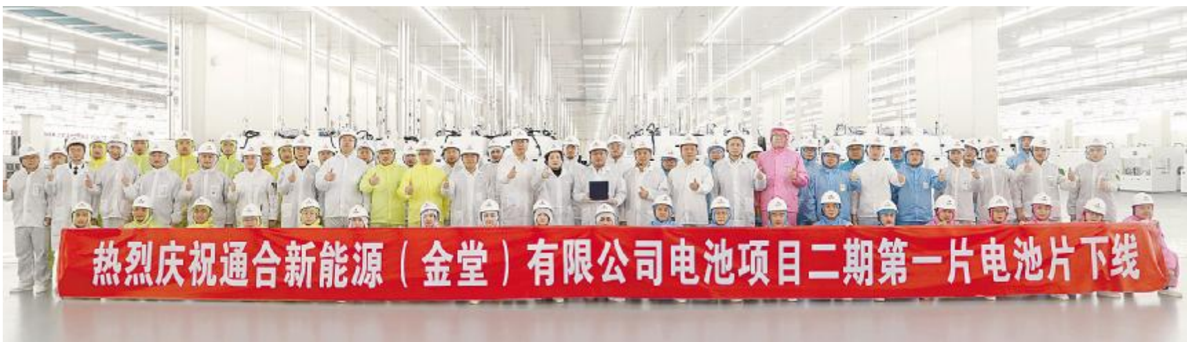
通合新能源电池项目二期第一片电池片顺利下线