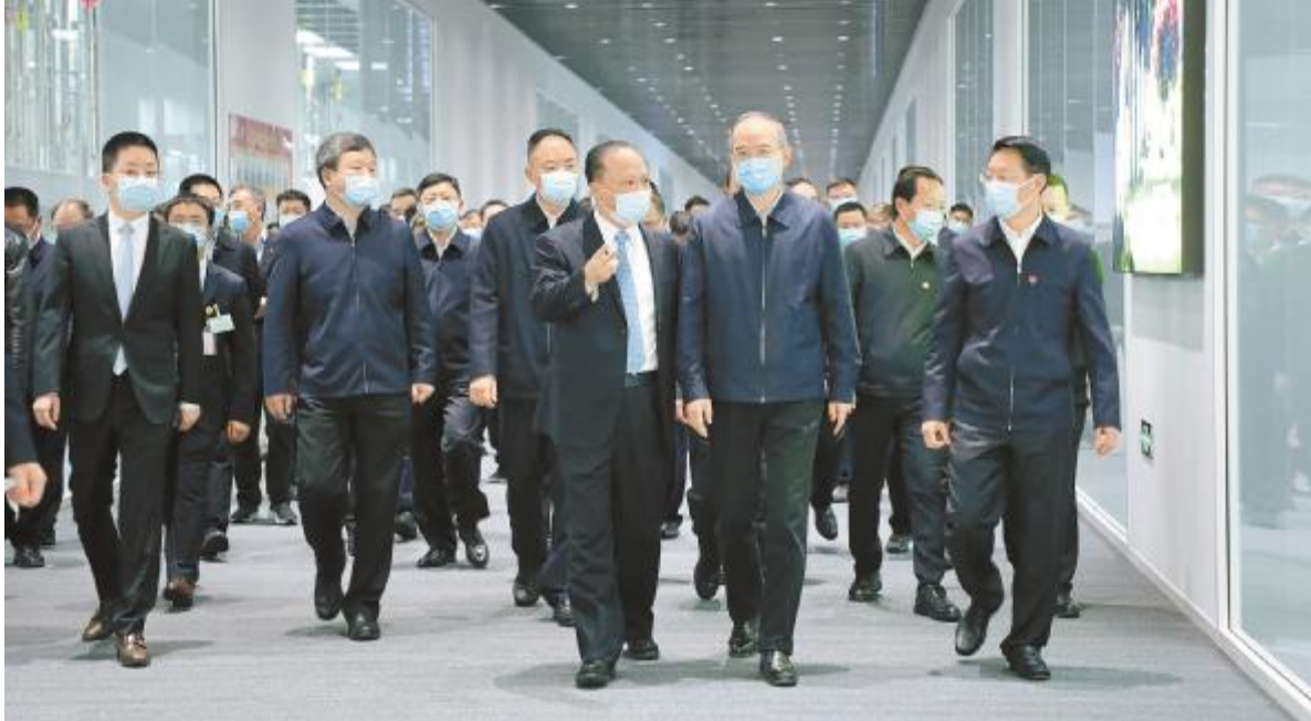
刘汉元主席陪同黄强省长视察通威太阳能眉山基地智能制造生产车间