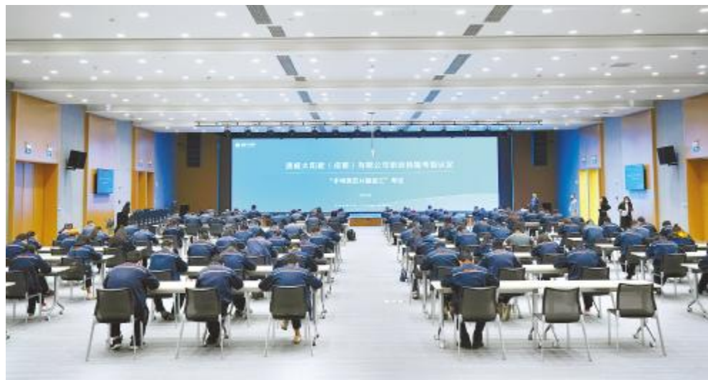
第三届半导体芯片制造工企业技能等级认定证书理论考试现场

环境部组织各厂部安全员开展“以案说环保”专题培训。 本次“以案说环保”专题培训,旨在通过对近期环境污染事故案例进行分享,通过专业讲解与问题分析以增强安全员的环境保护意识,掌握环境保护工作的内容、要求及相关法律法规,提高对生态环境保护的重视程度。培训现场,首先为大家讲解国家现行相关法律法规的基础知识,强调“污染环境罪”被纳入刑法中;其次,在各案例的讲解中,强调环保工作需要人人参与、人人负责,各厂部要加强对全体员工的教育培训,落实公司各项相关规章制度;最后,针对相关问题提出相对应的解决方法,并要求各厂部安全员在部门内部进行转训。 良好的生态环境和充足的自然资源是人民群众生存发展的基础和条件,企业发展要有可持续性,在发展经济的同时重视环境保护问题,落实各项规章管理制度,坚持“预防为主、防治结合、在发展中保护、在保护中发展”的原则,坚决守护好环境保护的红线。