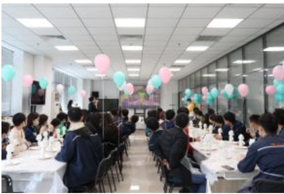
合肥基地流体熊 DIY 活动现场