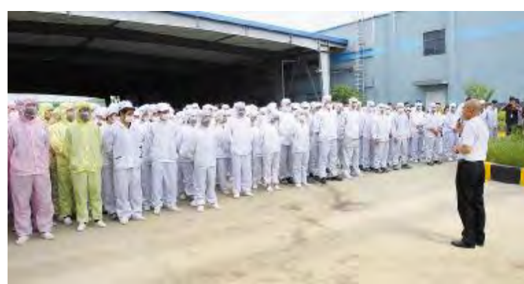
合肥公司应急疏散演练活动现场

本届“安全生产月”活动系通威太阳第五届安全生产月主题活动,吸引了两地共计千余名员工参与。活动虽已结束,安全生产仍在继续。未来,安全生产月活动将逐步向全员参与迈进,安全生产更将进一步渗透到工作的点点滴滴。本次活动的成功开展积极推动了公司2018年安全生产各项工作的深入、有效进行,进一步引导了公司员工学习安全知识,强化企业安全文化教育,大力营造企业安全文化氛围,全面保障公司安全高效生产。