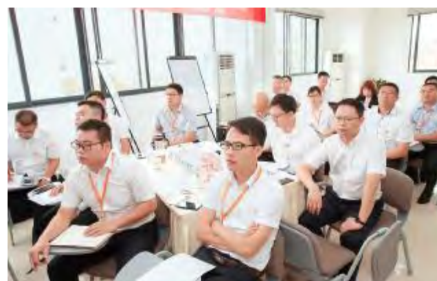
管理经验分享会现场