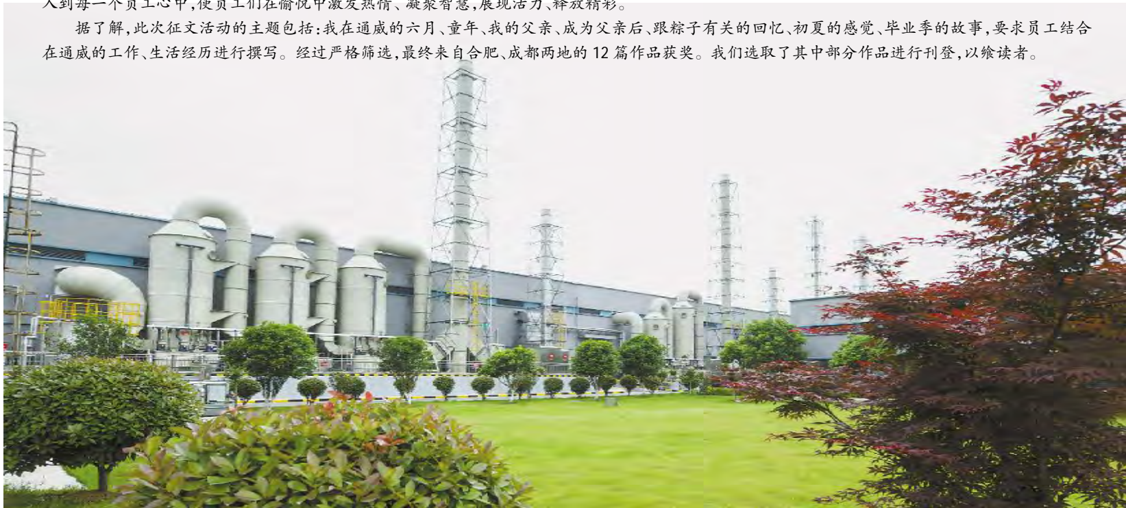
通威太阳能合肥公司厂区

据了解,此次征文活动的主题包括:我在通威的六月、童年、我的父亲、成为父亲后、跟粽子有关的回忆、初夏的感觉、毕业季的故事,要求员工结合在通威的工作、生活经历进行撰写。经过严格筛选,最终来自合肥、成都两地的12篇作品获奖。我们选取了其中部分作品进行刊登,以饕读者。