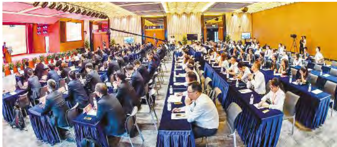
通威太阳能(合肥、成都)有限公司2018年中总结计划会现场