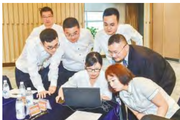
会议现场大家热烈讨论