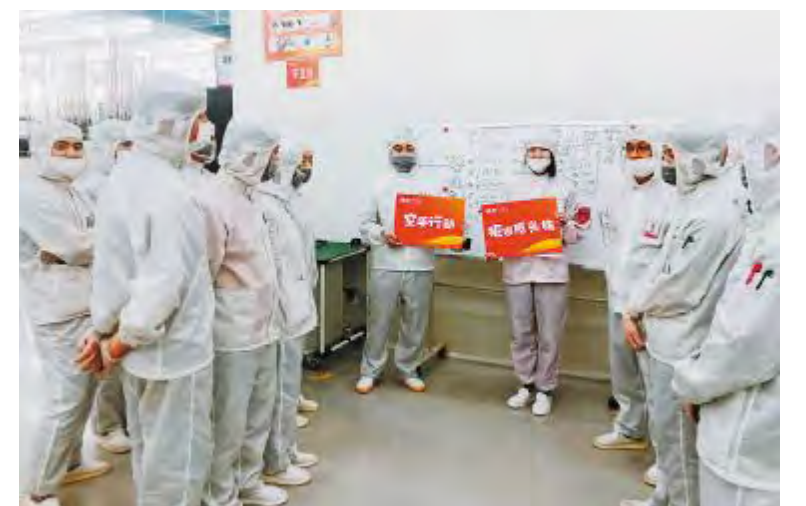
员工积极响应“空手行动”