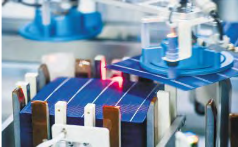
通威太阳能智能制造生产线

根据 PV InfoLink 统计,2018年,通威连续第三年居电池片出货第一,爱旭与展宇并列第二。从产业链全局来分析,2018年可说是电池片势力的重要转折点,通威等电池片大厂挟规模以及新产能的成本优势,纷纷冲出了超过4GW的出货,尤其通威总出货量超过6.5GW,遥遥领先其他电池厂。PV InfoLink 预期此三家电池厂在2019年也将稳居电池片出货前三