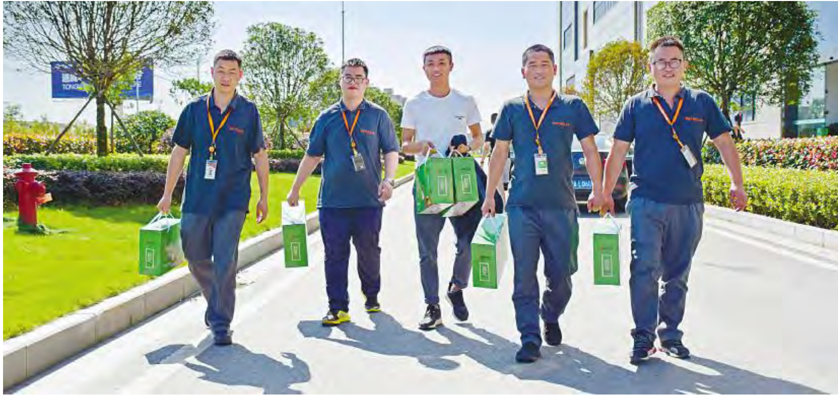
成都公司员工兴高采烈领取端午节礼品

小长假期间,两地员工餐厅还准备了精美的节日菜品以及特别的加餐福利,免费粽子等特色小食让员工在辛勤工作的同时,度过一个温暖、祥和的传统佳节。