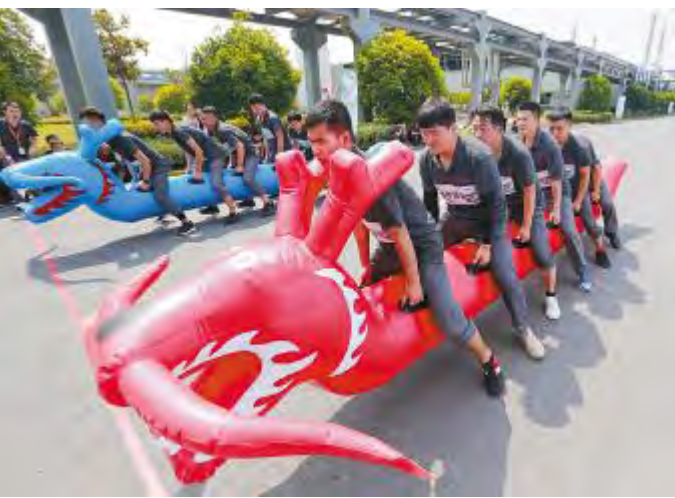
合肥公司旱地龙舟比赛现场