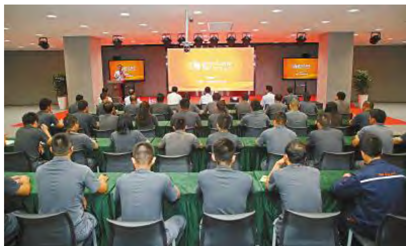
“我的工作,我负责”安全生产管理专题会议现场