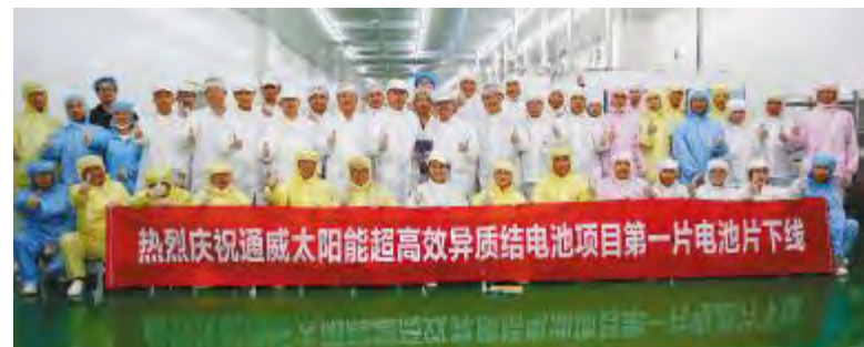
通威太阳能超高效异质结电池项目第一片电池片顺利下线

自2018年11月18日启动以来,短短7个月,就完成了从启动仪式到设备安装调试等一系列繁琐复杂的筹备工作,全车间采用智能制造自动化生产线。本次成功下线的超高效异质结电池片采用低温工艺制作,转换效率高、温度系数低、无LID、抗PID性能优,具备双面发电特性,双面率高达90%以上。