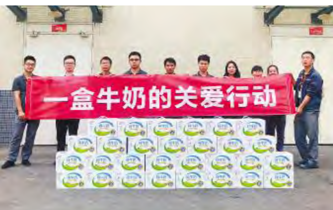
通威太阳能开展“一盒牛奶”职工关爱活动