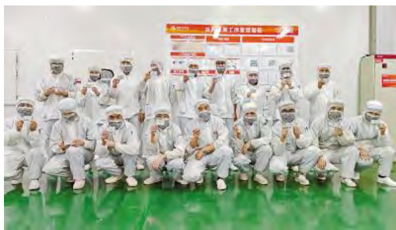
“安全环保十大禁令”推行活动现场