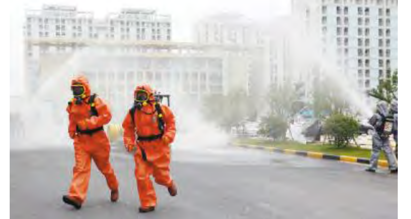
合肥公司应急救援演练现场

安全意识要深入骨髓。只有让安全文化深入人心,才能从根本上消除安全隐患,降低事故发生率,真正做到防风险,除隐患,遏事故。此次活动的推行,进一步强化了安全红线不可逾越,保障安全,尊重生命的意识!