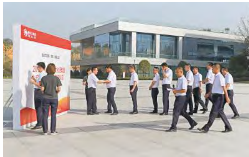
通威太阳能 2019 年企业安全文化暨“安全生产月”启动仪式现场

此次演练在公司H2危险化学库进行,主要针对氨气泄漏、人员撤离、现场处置、应急救援及请求政府支援等应急流程进行。通过安全演练活动的开展,检验了公司应急救援队伍对应急响应程序的熟悉程度,测试应急救援预案可实施性、应急培训的有效性、应急救援人员可操作性,提高了与事故应急相关部门的协作能力,为通威太阳能安全、稳定、高效发展奠定了坚实基础。