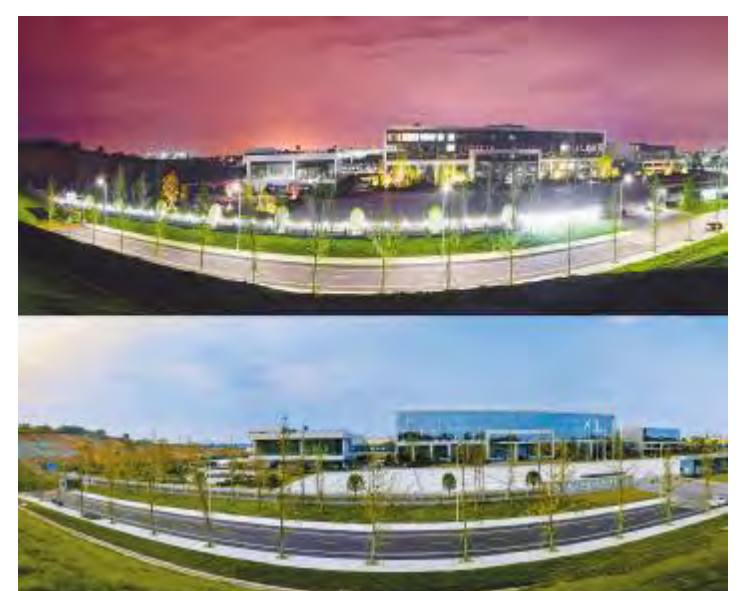
通威太阳能的昼与夜