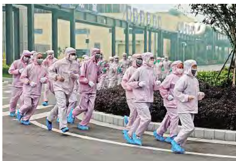
成都公司应急演练疏散现场