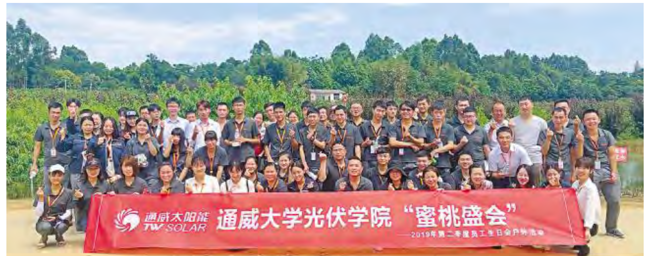
成都公司生日会合影留念

整个桃园。采摘结束后,寿星员工们一同围坐在草坪上,品尝新鲜的蜜桃,共唱生日快乐歌,互送生日祝福语。最后,聚焦的镜头留下了本次生日会寿星员工们的身影,也为本次生日会划下了圆满的句号。镜头上寿星们欢快的笑脸,正是公司构筑一个充满关爱的通威大家庭的温馨画面。2019年光伏学院将持续致力于打造特色员工活动,营造自信、阳光的工作氛围,激发员工热爱企业、投身企业发展的激情,形成良好的企业向心力和凝聚力。