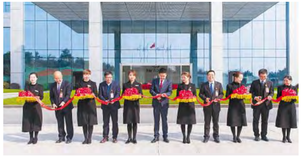
通威太阳能办公楼乔迁仪式现场

人勤春来早,实干正当时。春节刚结束,通威太阳能全体员工迅速进入状态,新大楼搬迁、外出交流学习、技术序列培养班开班,用行动诠释奋斗者姿态,心怀梦想、奋力追梦,开足马力,冲刺新年开门红。