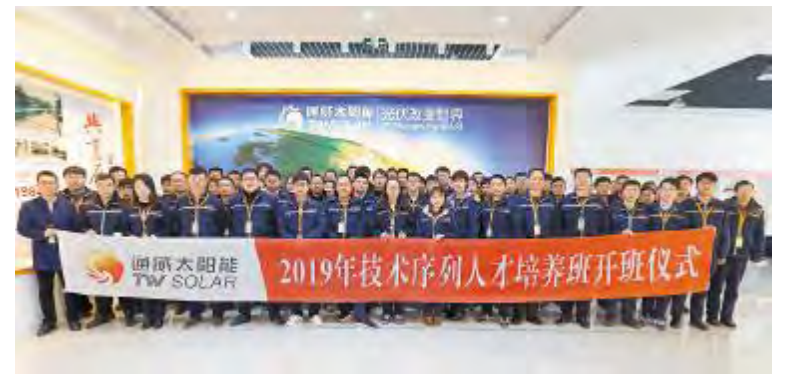
合肥基地2019年技术序列培养班开班仪式现场

满落幕,是通威大学光伏学院搭建完善的人才培养体系、提升定制式人才培养计划的又一重大举措,旨在通过加速技术人才成长、提高岗位胜任力,紧跟公司发展步伐,为公司快速发展提供强有力的技术人才支撑。未来,通威大学光伏学院将继续以公司战略为导向,源源不断的、全方位的为公司快速发展储备更多的人才。