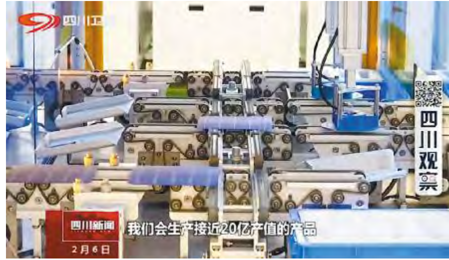
《四川新闻》聚焦通威太阳能画面

智能制造高效晶硅电池片自动化生产线,均由自动抓取的机械臂、智能运输机器人组成,全面采用背钝化技术,以高效单晶电池无人智能制造路线为主。大大强化了合肥市创新发展内驱力,助力新能源产业借“智”登高。本次媒体专题聚焦,再次展现了通威太阳能卓越的创新能力和强劲的发展势头。2019年,通威太阳能将发挥竞争优势,用更具开拓性、创造性的工作,为合肥打造“中国光伏第一城”添砖加瓦!