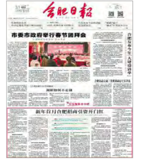
《合肥日报》头版聚焦通威太阳能发展