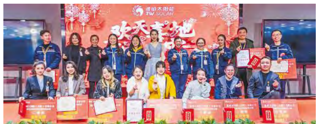
成都基地获奖选手合影留念