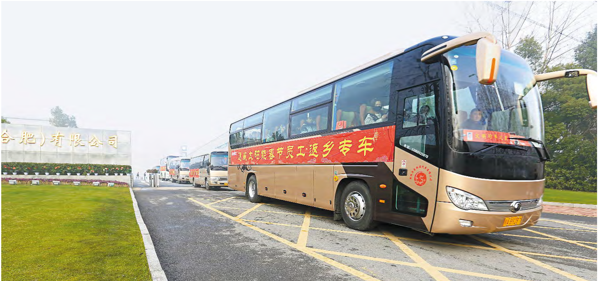
大年三十,两地 22 条回家专线开启回家路