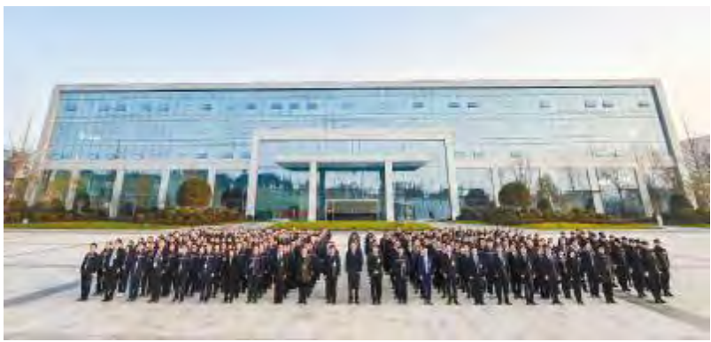
通威太阳能新年首次升旗仪式在新办公区广场隆重举行