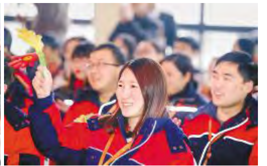
员工为参赛选手欢呼呐喊