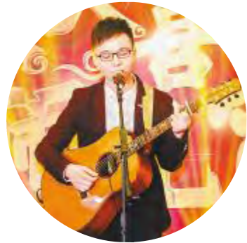
参赛选手深情演唱