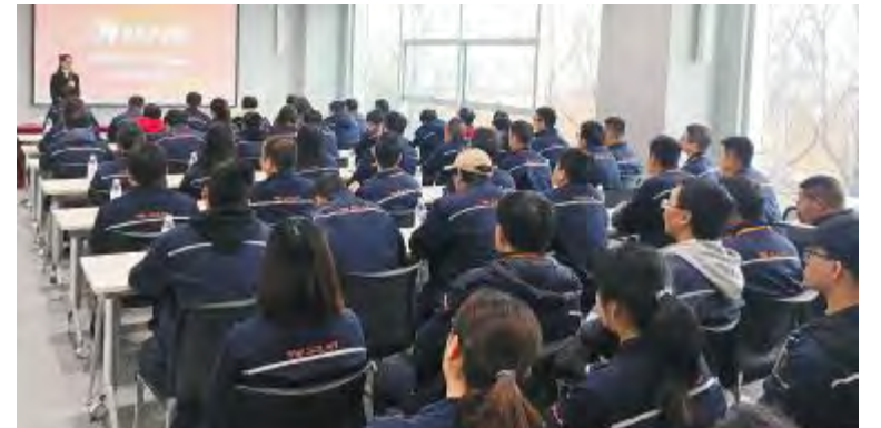
成都基地2019年技术序列培养班开班仪式现场