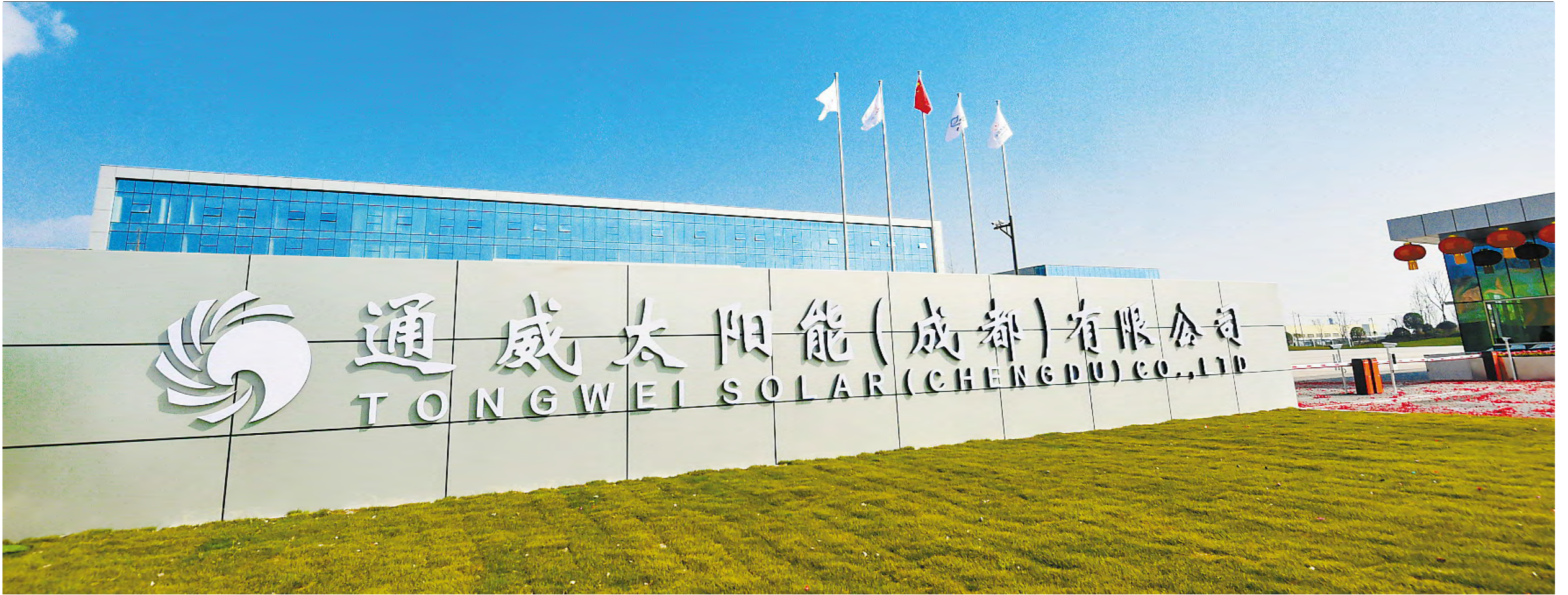
通威太阳能新办公楼