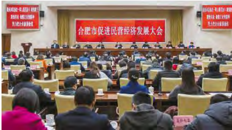
合肥市促进民营经济发展大会现场

谢董在发言中对成都市委、市政府在通威太阳能成长及发展过程中给予的关心与支持表示感谢,并介绍了通威太阳能发展现状,重点就通威太阳能2018年经营状况及