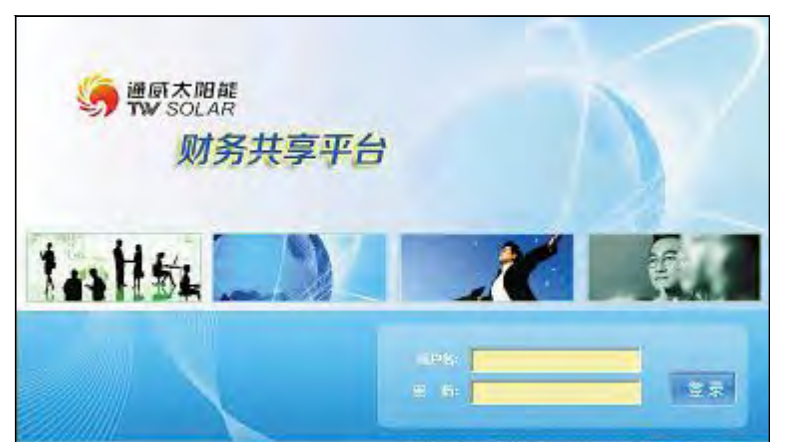
通威太阳能财务共享一期项目上线,通威太阳能正式开启“ERP2.0”时代

本期财务共享项目实现费用共享服务,梳理了财务核算系统的主数据、核算标准口径的统一以及财务费用制度,消除业务流程、核算口