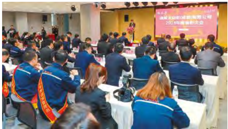
成都基地表彰现场

2月11日,通威太阳能2018年度表彰大会分别在合肥、成都两地隆重举行。通威太阳能董事长谢毅及公司中高管团队出席大会,两地共计300余名员工代表参会。