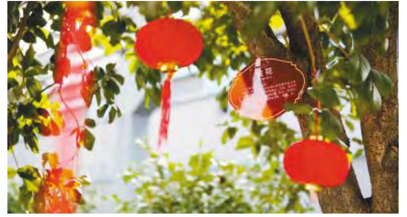
冬日暖阳下的厂区新春装饰

一个个温馨的举动,一场场精彩的活动,为了让员工更好地感受到通威大家庭的温暖,新年伊始,通威太阳能继续想员工之所想,持续打造“接地气”的企业文化,能真正使企业文化成为员工共有的精神家园。