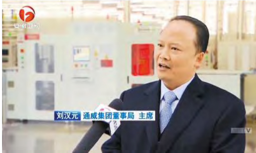
安徽卫视《新闻联播》专访刘汉元主席

2月18日,安徽卫视《新闻联播》推出《安徽:民营经济迈上高质量发展新平台》专题报道,专访十一届全国政协常委、全国人大代表、通威集团董事局刘汉元主席,聚焦通威高质量发展之路。报道指出,自2013年通威太阳能合肥二期2.3GW项目无人生产车间,并指出,该车间内共16条全封闭的智能制造高效晶硅电池片自动化生产线,均由自动抓取的机械臂、智能运输机器人组成,全面采用背钝化技术,以高效单晶电池无人智能制造路线为主。与常规半自动化产线相比,该项目非硅成本预计在目前基础上下降10%以上,实际产量可达设计产能的120%。