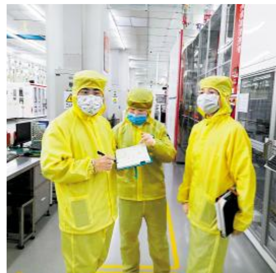
2020 年中威企业文化融合主题学习交流现场

据悉,自今年年初中威电池厂并入以来,人力资源体系已完成编制梳理并同时着手开展绩效方案修改,本次交流活动落实了光伏学院针对中威电池厂开展的文化融入、效能提升工作方案的第一步。未来,光伏学