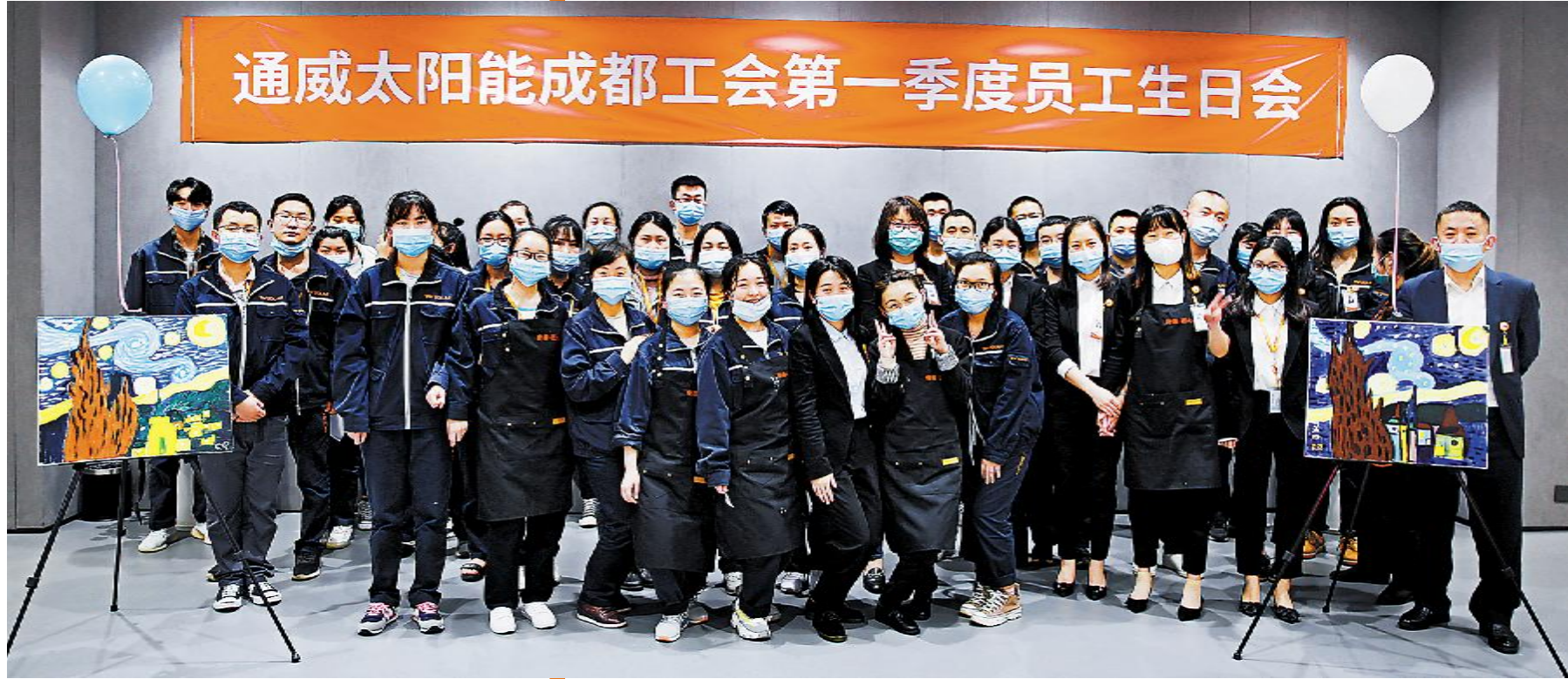
成都公司 2020 年第一季度员工生日会合影留念