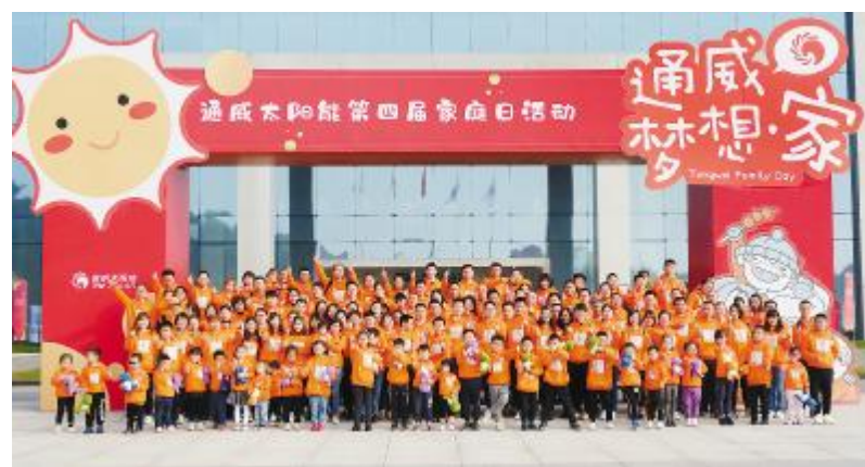
家庭日等系列活动,提升了员工归属感,增强了员工凝聚力

余人,为了管好人、用好人,公司探索总结出了一套优秀的人力资源管理经验。完善的薪酬保障和绩效激励,使员工的工作价值得到满足;光伏学院定期组织开展主题培训、外派进修,为员工的成长提供了学习渠道;公开透明的晋升机制,促进员工在岗位上发挥自己最大的潜能,实现自我。企业文化建设体系中,篮球比赛、拔河比赛、烘焙、插花、节假日主题活动等多姿多彩的企业文化活动,丰富了员工的业余生活;工会开展奋斗者关爱系列项目,定期为员工发放生日礼品、购物卡,开展困难职工帮扶,并积极为大病家庭申请国家级救助金,