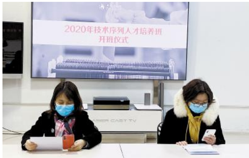
技术序列春季培养班合肥公司开班仪式现场