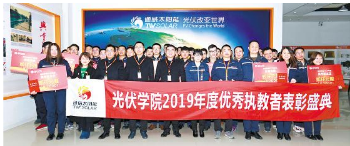
成都公司 2019 年度优秀执教者表彰盛典合影留念

光伏学院一直致力于组织赋能工作,为了持续承接公司战略与绩效需求,在打造更有竞争优势的管理理论与实践培训体系上不断探索,推动组织战略目标落地。未来,也将不断把握行业风向,为公司应对外部多变的挑战与机遇夯实基础,为抵御困境与风险、拥抱变革与转型储备足够的“势”与“能”。