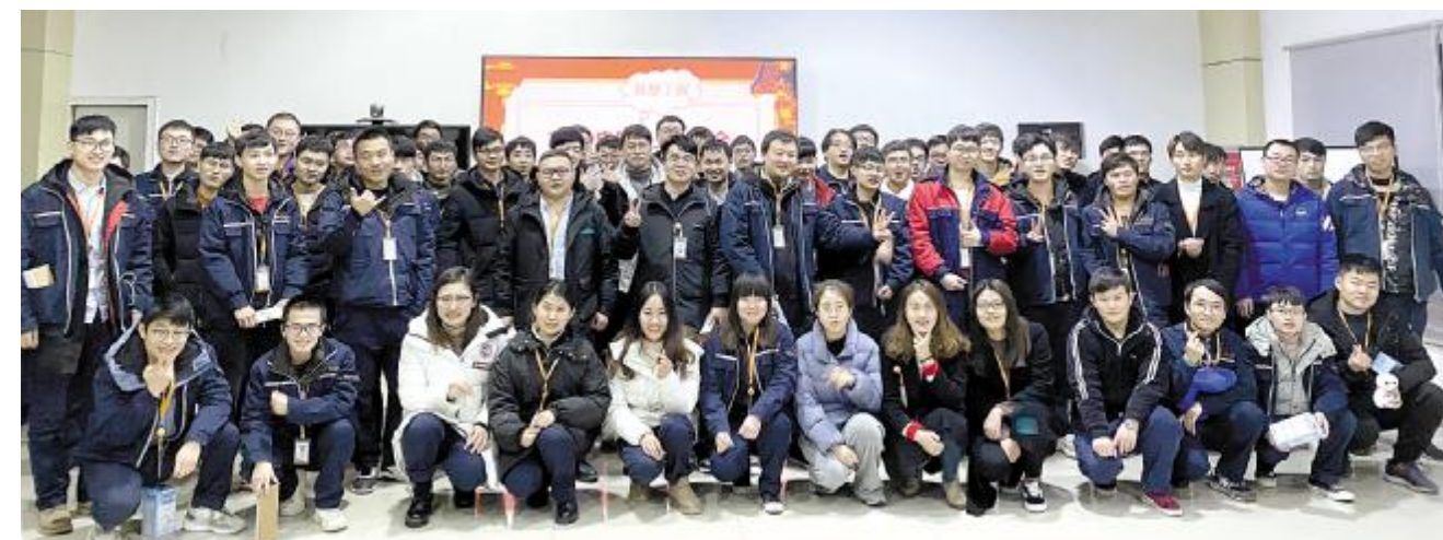
2019届启航员工年度座谈会合肥公司合影