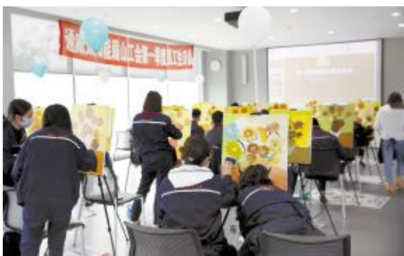
眉山公司 2020 年第一季度员工生日会活动现场

此次员工生日会作为奋斗者关爱的重要组成部分,让大家切身感受到公司大家庭的温暖,增强了员工的归属感。未来,通威太阳能工会将继续进行创新探索,让通威太阳能真正成为广大员工信赖的“职工之家”。