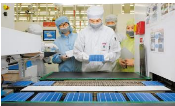
技能等级评定等公开透明的晋升机制,充分激活员工潜能

本报讯(通讯员 王园园)企业向前发展的动力来源于每一位员工,如何让员工在公司工作生活的舒心、安心、放心、对未来充满信心,是通威太阳能公司管理层持续思考的话题。为了实现以文化的力量助推幸福企业的建设,让员工实现精神与物质的双丰收,通威太阳能特色文化建设不断升级,“以人为本”的雇主品牌蓝图开始绘就。