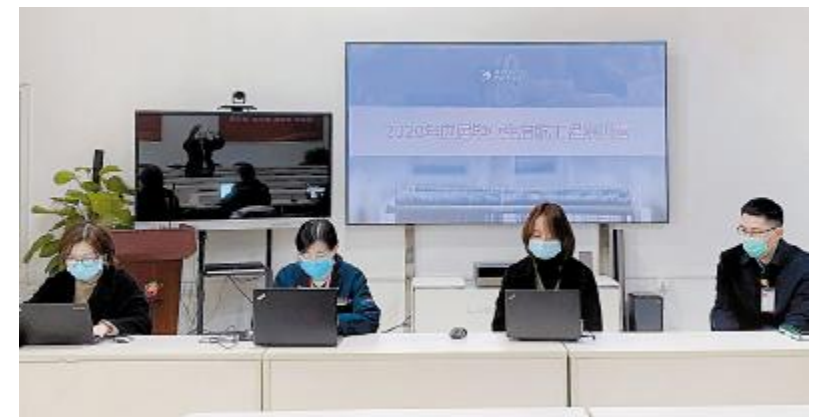
2020年启航工程春季班线上集训营开班仪式现场

光伏学院老师们不断创新授课模式,在启航集训营的开展过程中结合讲授、素质拓展、沙盘模拟、参观等方式开展灵活教学,同时坚持每日有考核的过程管理,带给学员们一场兼具系统性、多样性、挑战性、趣味性的学习之旅。