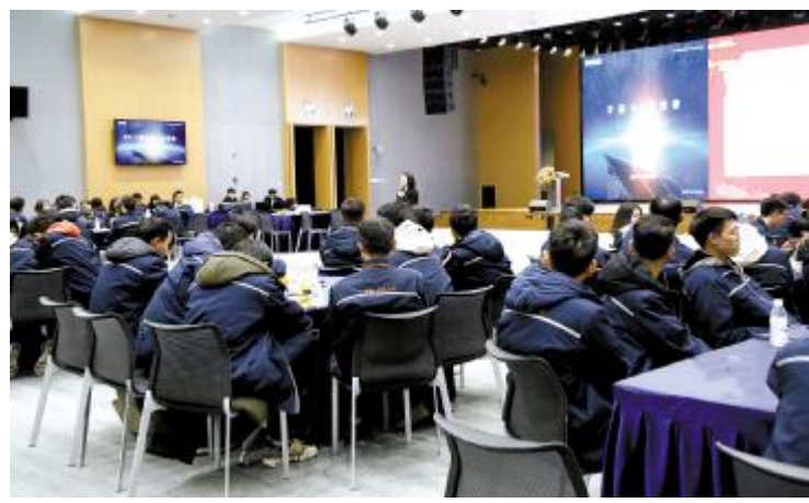
2019届启航员工年度座谈会成都公司现场