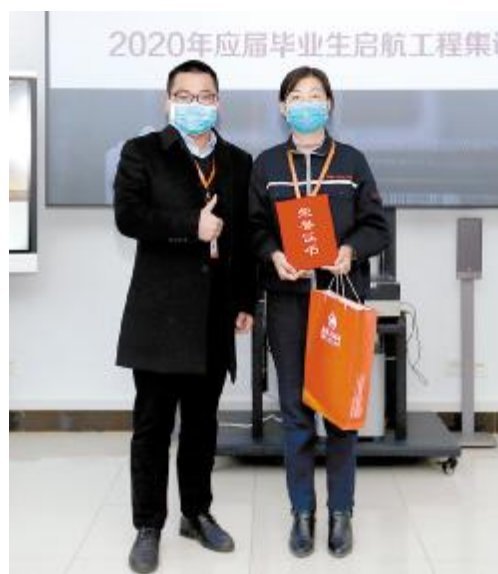
2020年启航工程春季班集训营结业仪式颁奖环节