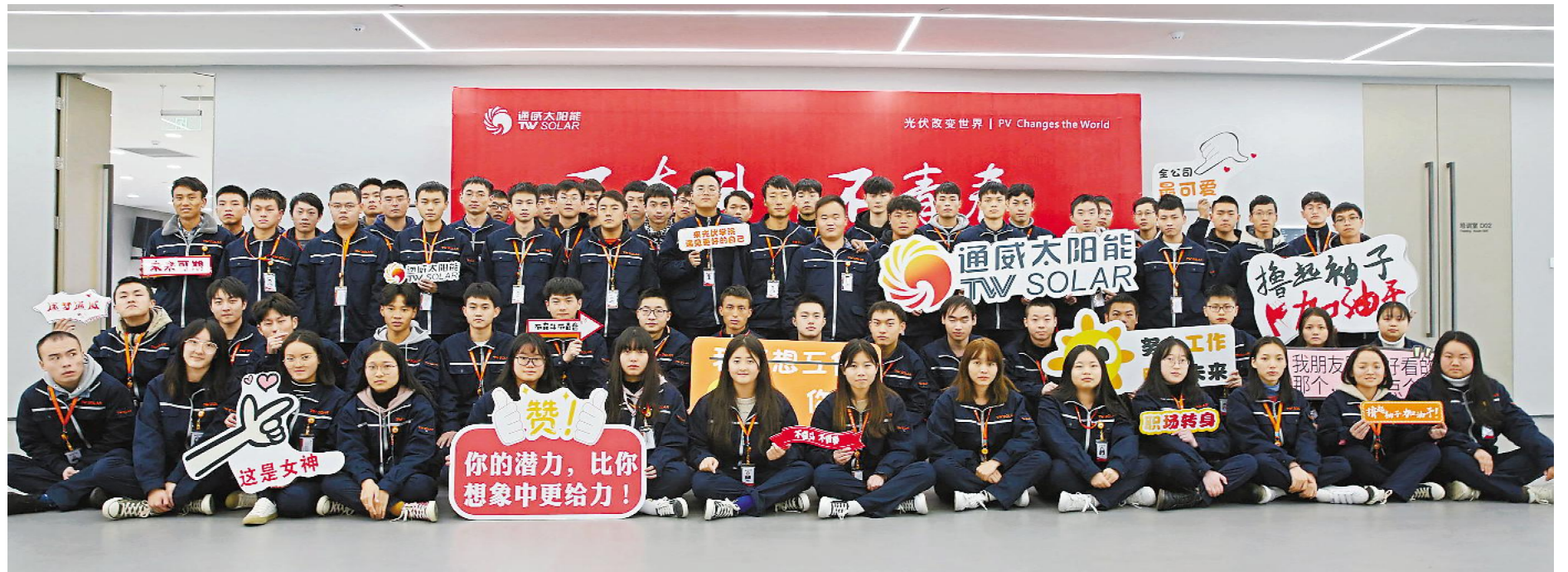
启航工程学员合影留念